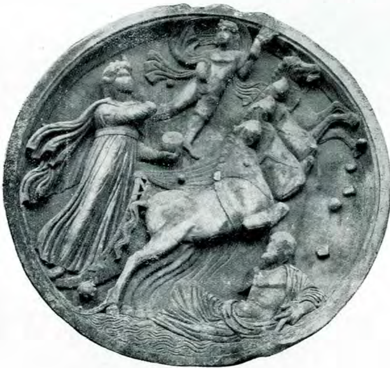
Fig. 7. - Răsăritul Soarelui.

Carul solar trece printre stele, înfățișate ca ființe omenesti care plutesc în văzduh. Prin felul cum sânt arătate în desernul