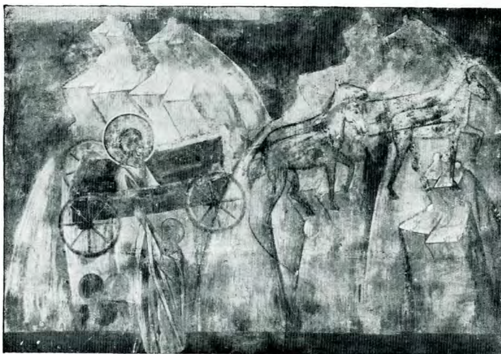
Fig. 1. — Sf. Ilie în căruță. Pictură din biserica Sf. Ilie de lângă Suceava.

„Ilie, înălțat spre cer, pe un car de foc,