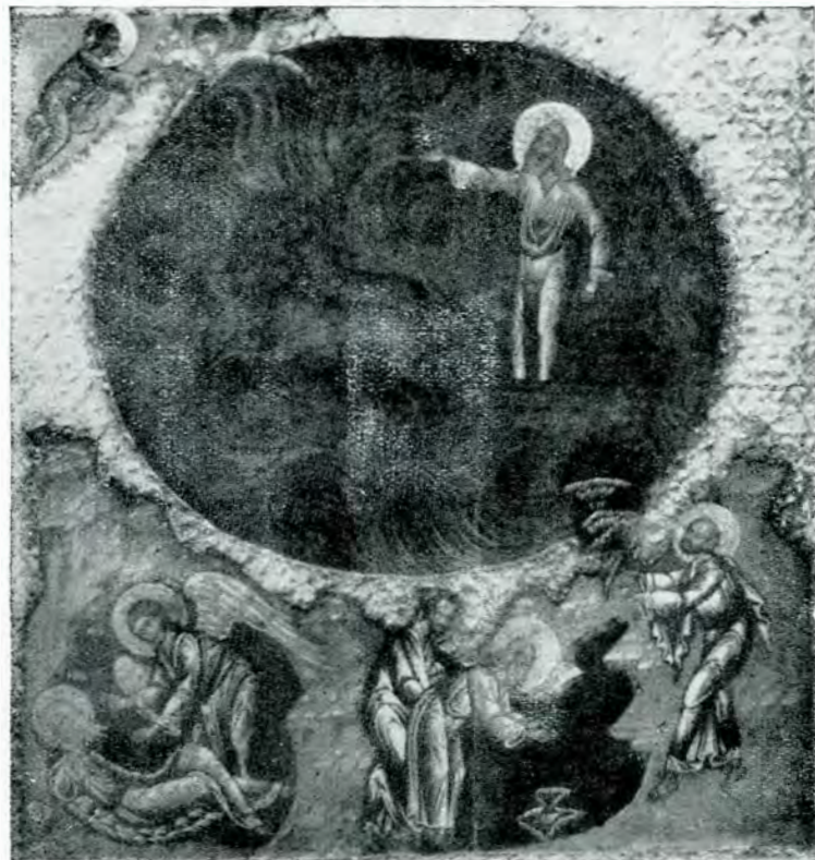
Fig. 9. – Sf. Ilie. Icoană rusească din secolul al XVI-lea

În această miniatură, noaptea apare ținând un vâl de-asupra capului, în mâna stângă are o torță stinsă. Aurora, în chipul unui copil, de cealaltă parte, ține o torță aprinsă 1 .