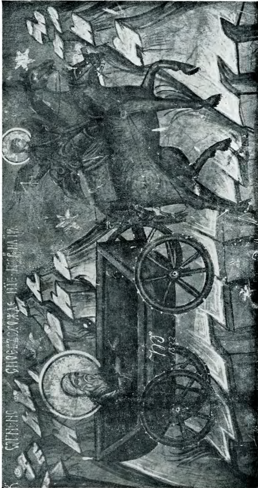
Fig. 3. — Ridicarea la cer a Sf. Ilie. Pictură din biserica mănăstirii Veroneț.