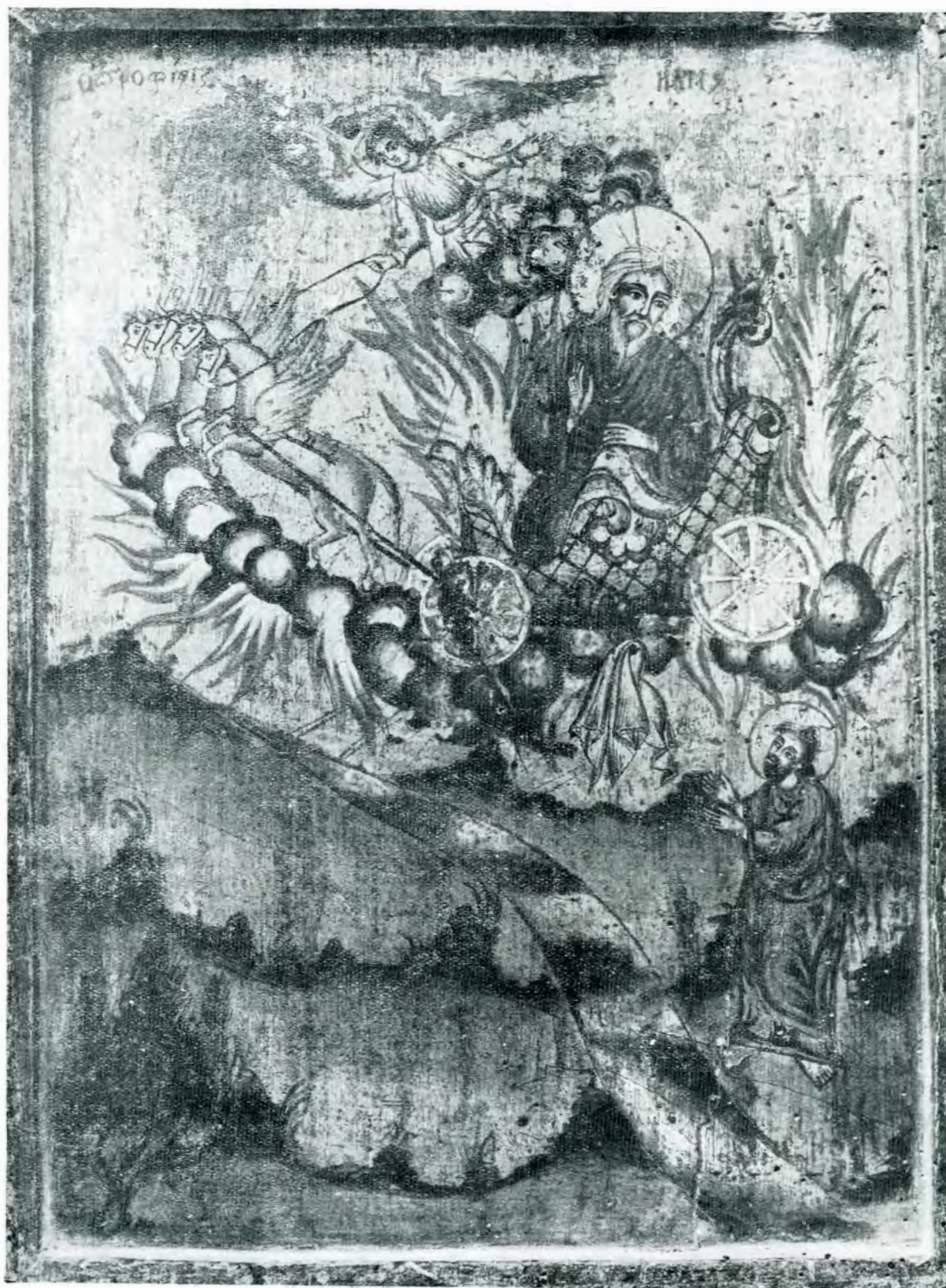
Fig. 6 – Icoana Sf. Ilie de la Catedrala din Giurgiu.