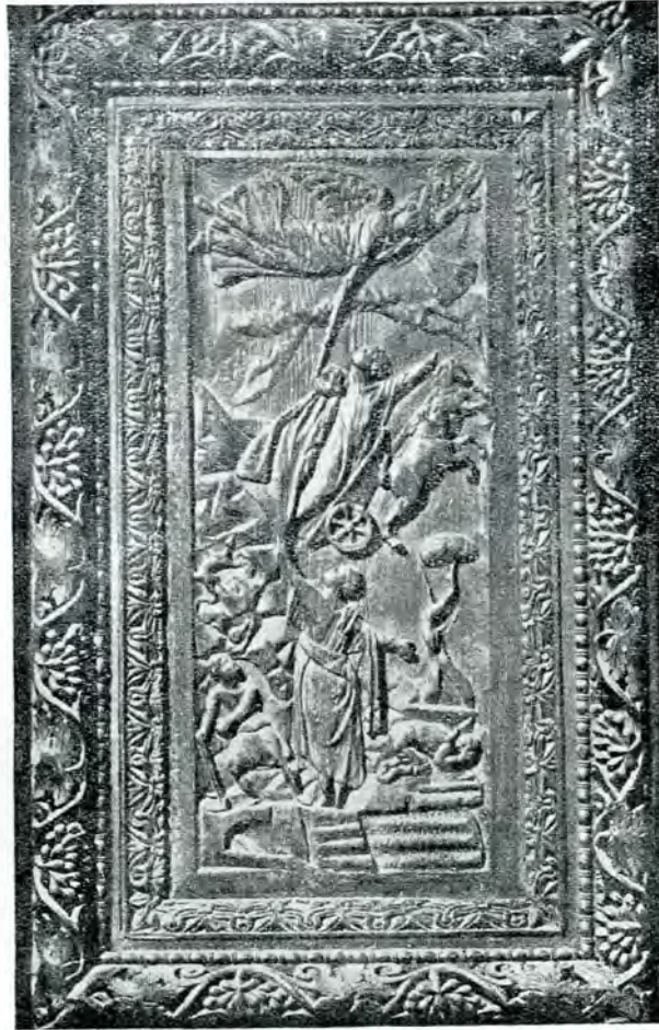
Fig. 10. – Ridicarea la cer a Sf. Ilie. Sculptură din sec. al V-lea, ușile bisericii Sf. Sabina din Roma. După Ch. Diehl, o. c., fig. 139.

Un amestec al ridicării Sfântului Ilie la