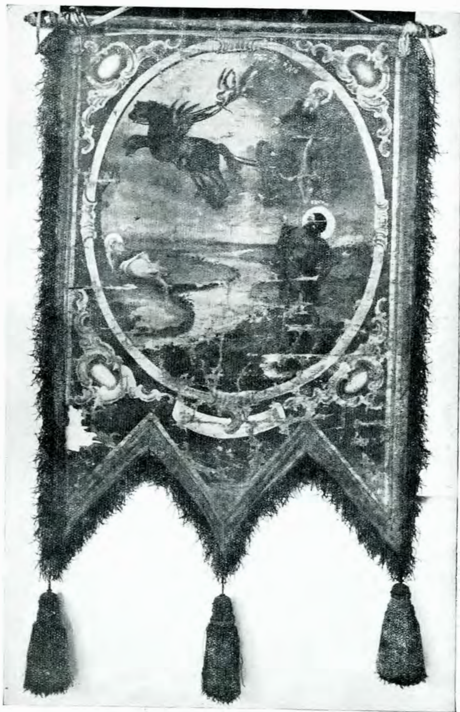
Fig. 5. — Ridicarea la cer a Sf. Ilie.

de zeița Aurora, inaripată 1 , ceea ce, în zugrăveala de la Voroneț, ca și în icoana de la Giurgiu, o face ingerul inaripat. Acesta învărtește biciul, călărește pe calul