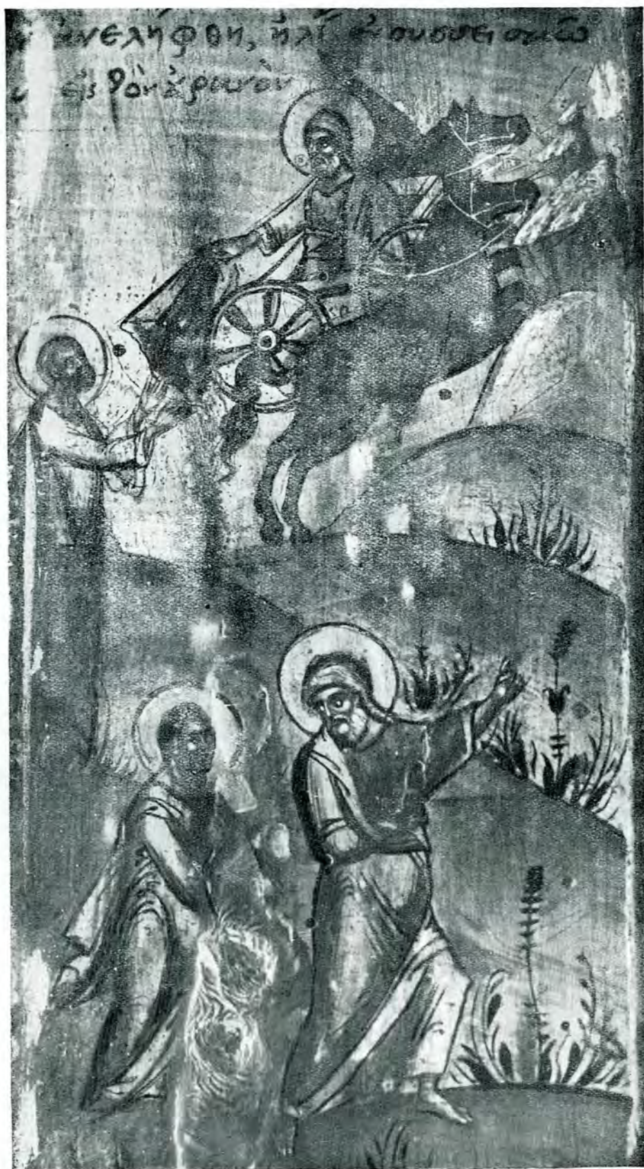
Fig. 2. – Detaliu din icoana Sf. Ilie de la biserica Sf. Ilie Gorgani din București.