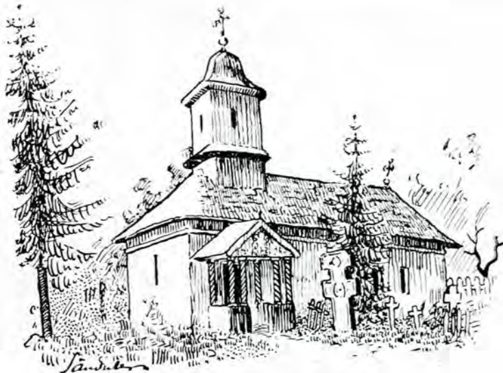
Biserica veche Cuv. Paraschiva, din Scorțeni, desenată după tabloul cu ctitorii.