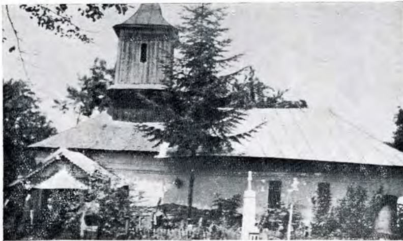
Biserica veche Cuv. Paraschiva din Scorțeni, înainte de reparație.

Pomelnicul de la Proscomidie , zugrăvit, în litere, tot așa de lung, pentru morți. Pe păretele