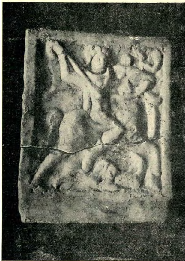
Fig. 1. — Mangalia. Cavalerul trac. Fotocopie

În vreme ce în reliefurile Kazarow, l. c., vol. cu tab. LIX nr. 348 și 351 (vol. cu text, p. 127, nr. 705 și 708), deabia că se pot desluși conturile hitonului scurt — hlamida flutură la spate sau se vede spânzurând pe spate — zeul călăreț al reliefului Kazarow, l. c., vol. cu tab. LIX, nr. 352 (vol. cu text, p. 127—8, nr. 710), dar mai ales cel al reliefului Kazarow, l. c., LXVII, nr. 397 (vol. cu text, p. 141—42, nr. 803), s'ar părea a fi în completă nuditate, dacă hitonul și hlamida nu erau indicate prin colori, azi dispărute fără urme. Or