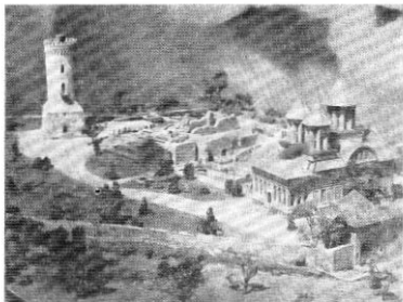
Curtea domnească din Tîrgoviște.

În cazul cînd nu există planuri, atunci singura modalitate de a-ți procura documentația este relevul. Acesta se execută la fața locului și adesea este de lungă durată, pot participa mai mulți machetiști, lucru care ușurează măsurătorile.