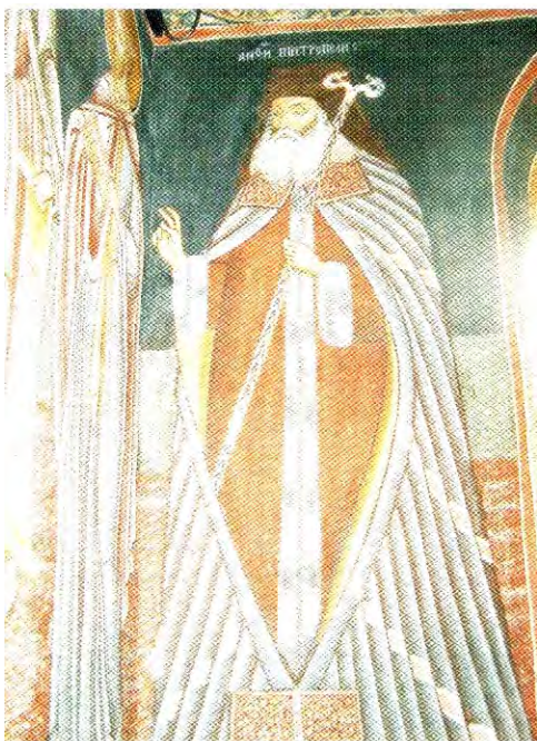
Mănăstirea Govora – Mihăești. Antim Ivireanul, mitropolitul Ungrovlahiei.