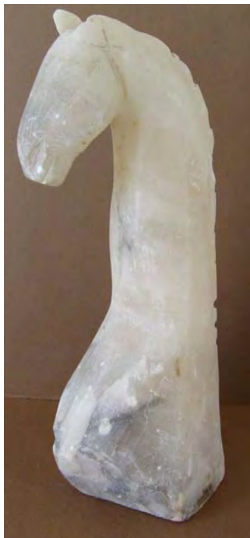
Cap de cal