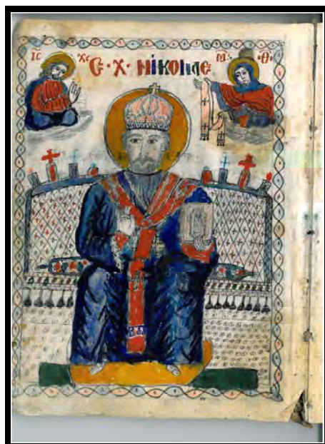
Sfântul Nicolae- patronul bisericii (fila 1, verso)