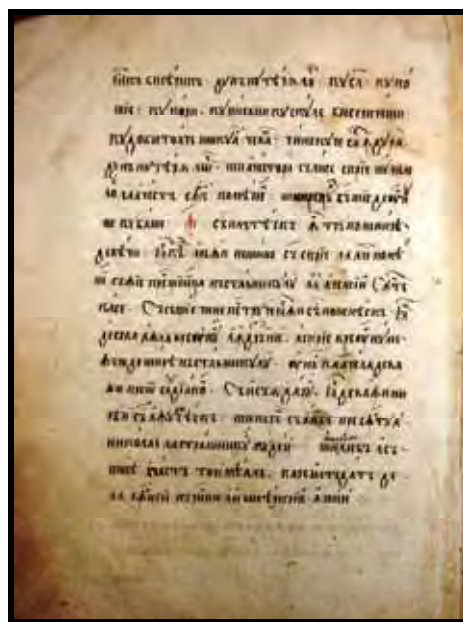
Predoslovie Pomelnicului de la 1701 (colecția documente Dumitru Bondoc)