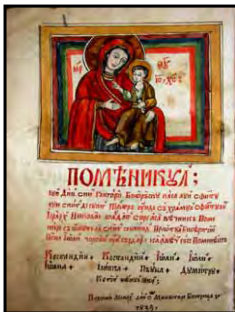
Pomelnicul lui Ioan Petrovici (1831) și al lui Din Grigorie Boorăscu (1835) (colecția documente Dumitru Bondoc)