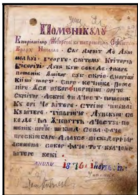
Prima pagină a Pomelnicului de la 1876 (fila 1, recto)