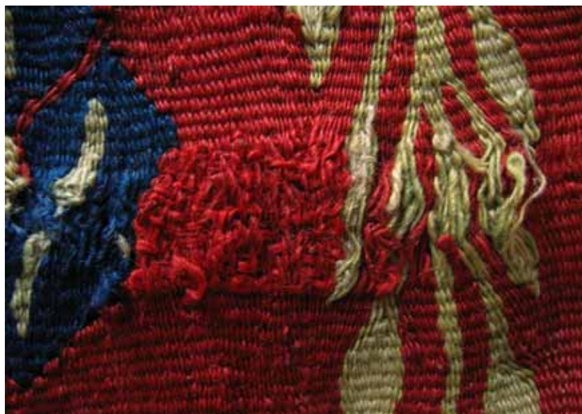
Înainte de restaurare