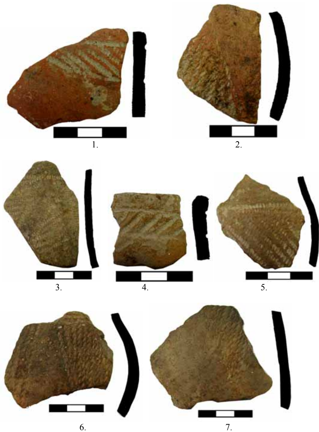
Fig. 6. Cultura Coțofeni.Ocnița-Aval Baraj