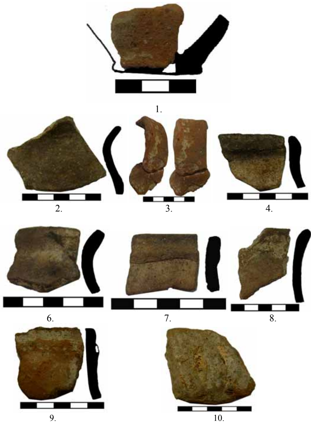
Fig. 9. Cultura Coțofeni. Ocnița-Aval Baraj