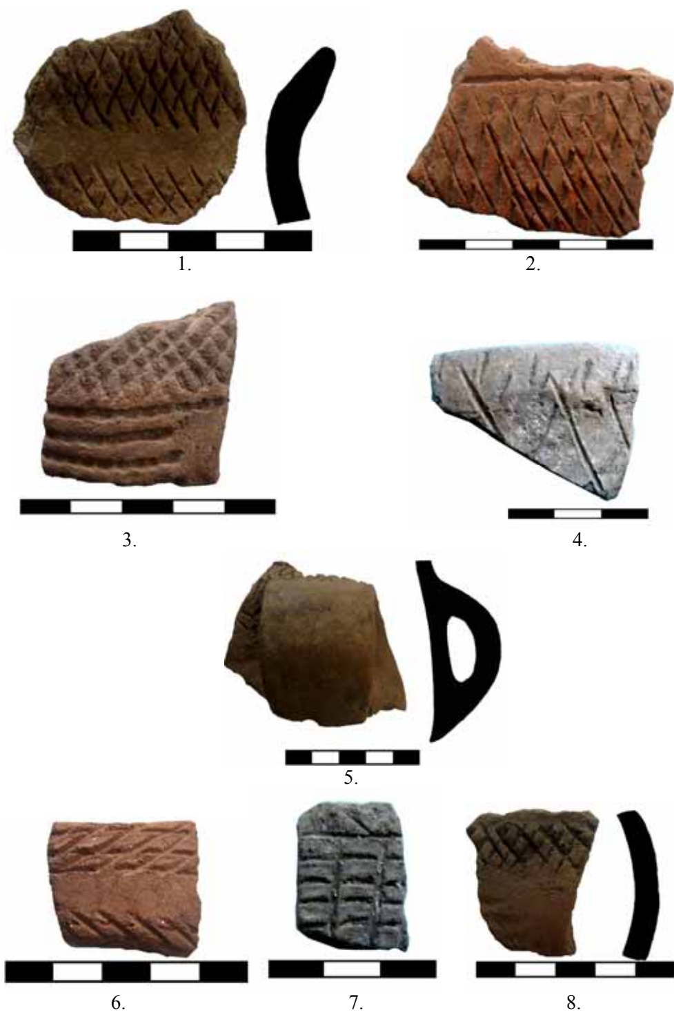
Fig. 4. Cultura Coțofeni. Ocnele Mari-Zdup