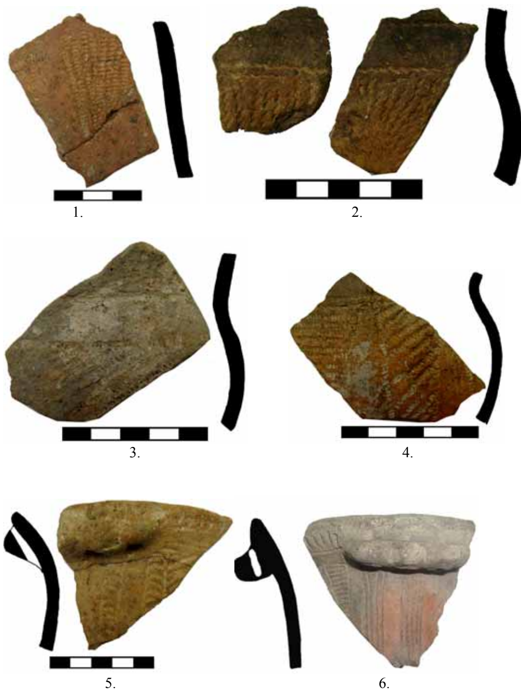
Fig. 7. Cultura Coțofeni. 1-5, Ocnița-Aval Baraj; 6 -Ocnița-Cosota