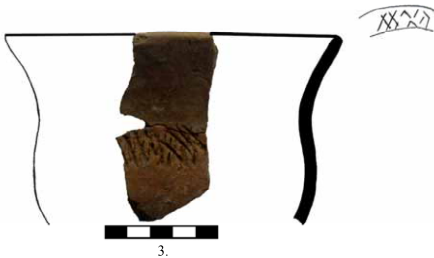
Fig. 3. Cultura Coțofeni. Ocele Mari-Zdup