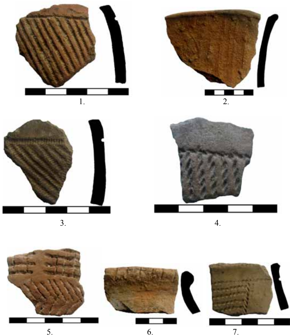
Fig. 5. Cultura Coțofeni. Ocnele Mari-Zdup