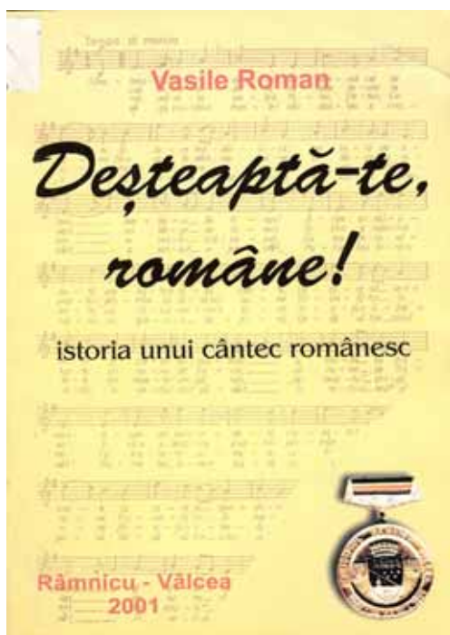
Coperta cărții lui Vasile Roman