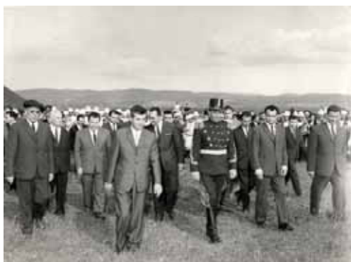
1966, Nicolae Ceaușescu în tabara de la Râureni. Aici s-a reactivat melodia Imnului actual, după instaurarea comunismului în România