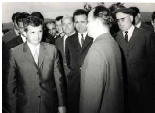
1966, Râureni. Petre Purcarescu îi dă raportul secretarului general al PCR, Nicolae Ceaușescu