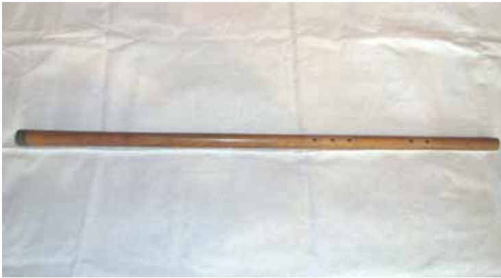
Fig.2 Fluier din Vaideeni, meșter Rugea Nicolae