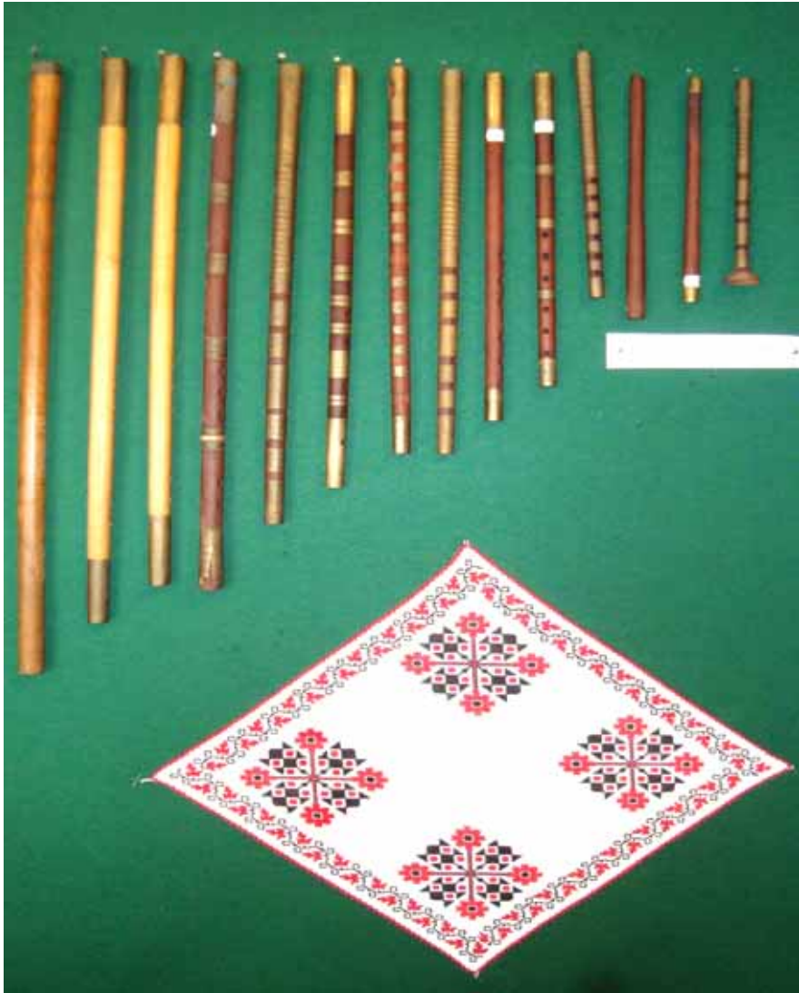
Fig. 4 Fluiere, flaute, cavale expuse la Muzeul Județean „Aurelian Sacerdoțeanu” Vâlcea, Secția Muzeul Satului din Bujoreni în cadrul expoziției „Arta prelucrării lemnului în nord-estul Olteniei”