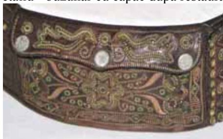
curelele de închidere cu uzură funcțională și produși de coroziune ai cuprului înainte de restaurare