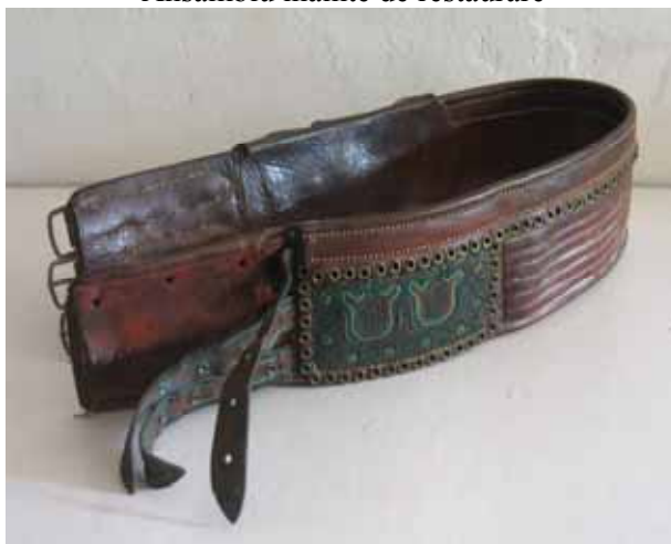
Ansamblu înainte de restaurare

- proporția ultravioletelor sub 75 microwatt/ lm