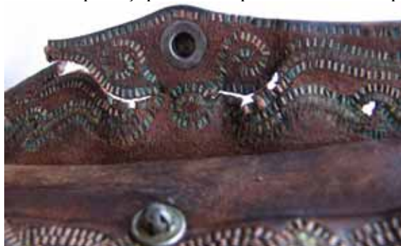
Detaliu - rupturi și pierderi de piele de brodată la buzunar, după curățirea „firului de cupru”