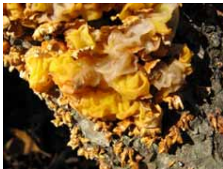
Paraziți asupra speciei Stereum hirsutum