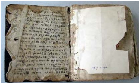
Forzaț anterior (partea fixă)