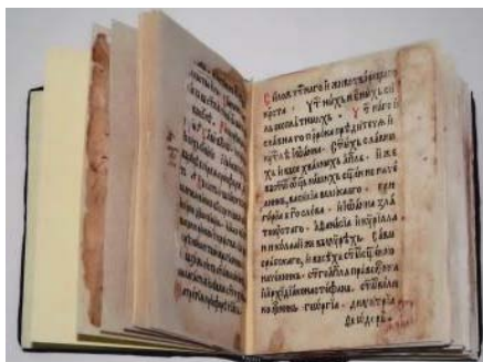
Bloc în interior după restaurare