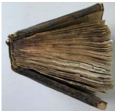
Tranșa de sus