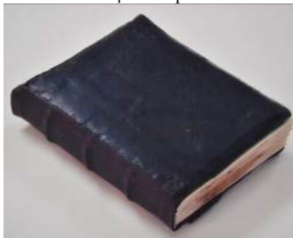
Învelitoare după restaurare