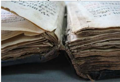
Bloc deschis (vedere tranșa și capitalband)