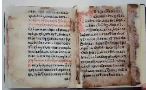
Volum în interior