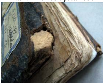
Detaliu colț dreapta sus