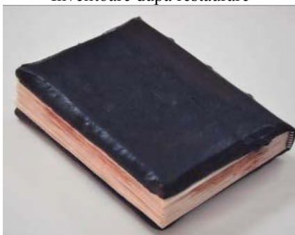
Învelitoare după restaurare