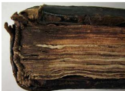
Tranșă de la picior