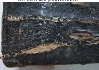
Detaliu învelitoare posterioară