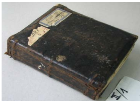
Volum înainte de restaurare