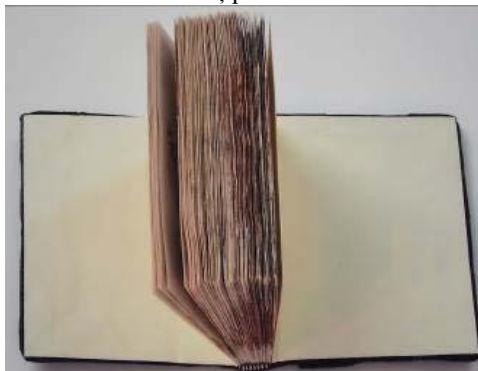
Forzațuri dupa restaurare