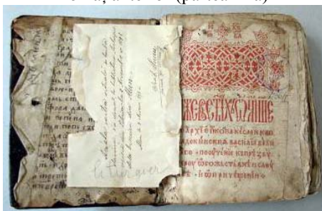
Forzaț anterior (partea fixă), foaie de titlu