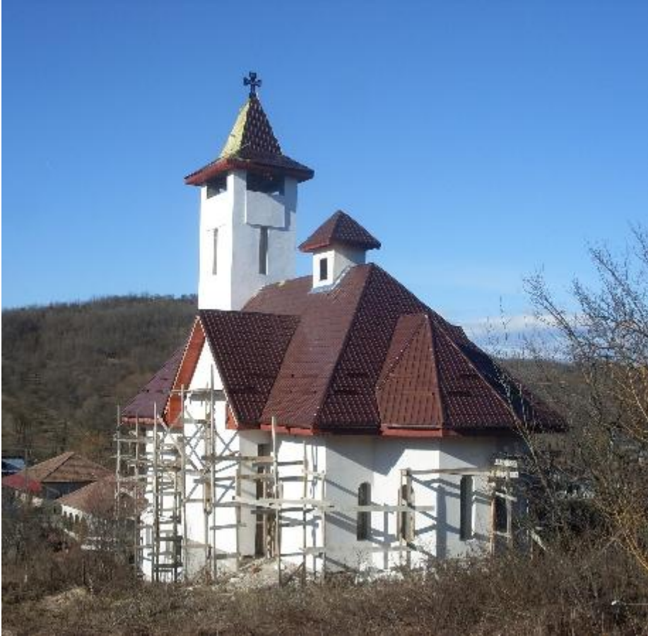
Fig. 6. Biserica Greco-catolică din Pesceana.