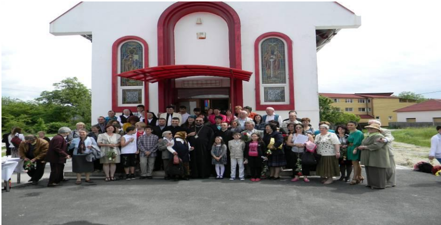
Fig. 5. Biserica Greco-catolică Rm. Vâlcea.