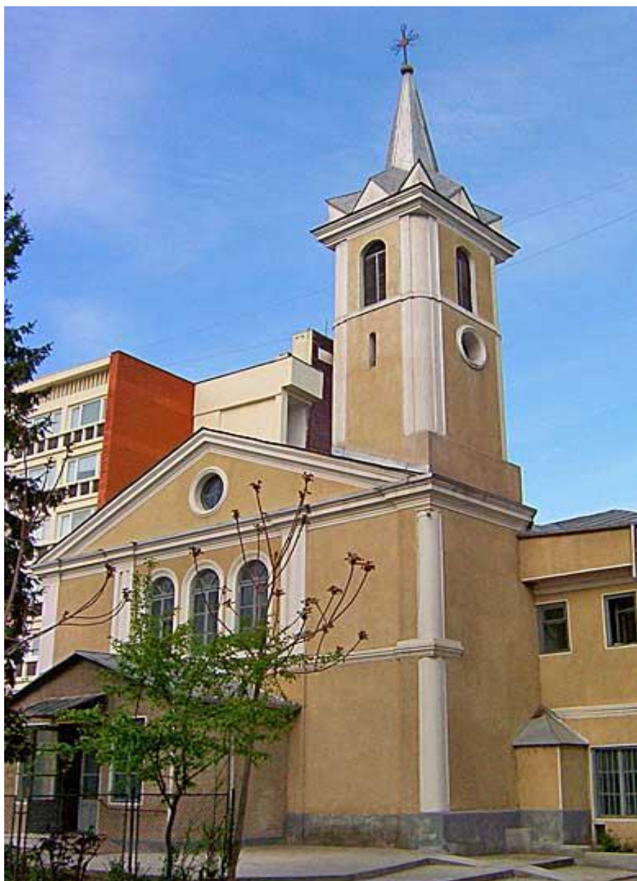
Fig. 2. Biserica Romano-Catolică din Rm. Vâlcea.