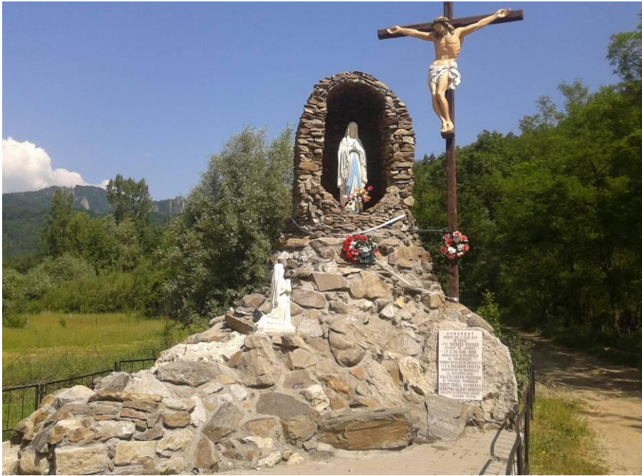
Fig. 4. Replica grottei de la Lourdes.