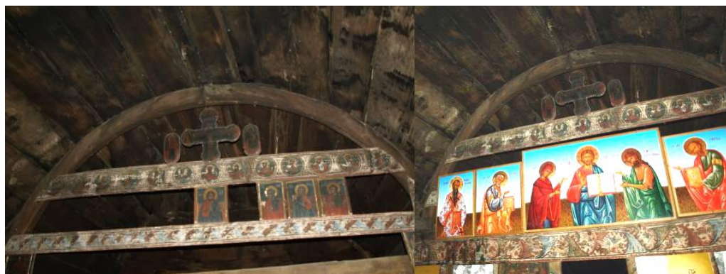
Foto 7. Iconostas octombrie 2012 / Iconostasis, 2012, October.