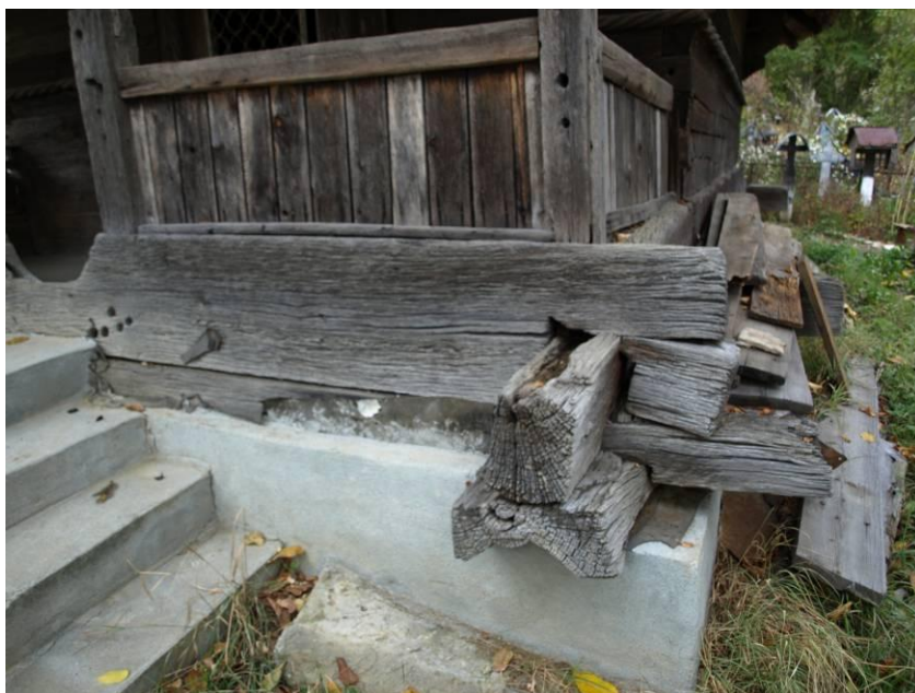
Foto 2. Aspect grinda talpă / Main wooden beam.