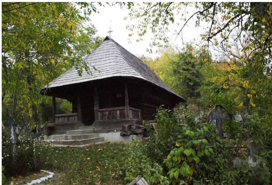
Foto 1. Biserica de lemn din Mitrofani- La Nuc / The wooden church Mitrofani- La Nuc .