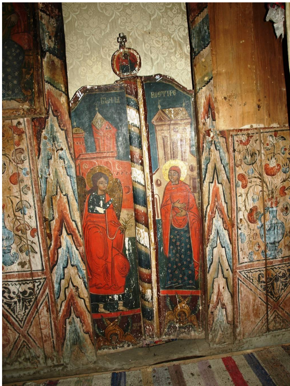
Foto 5. Pictura porților împărățești / Painting of the royal gates.