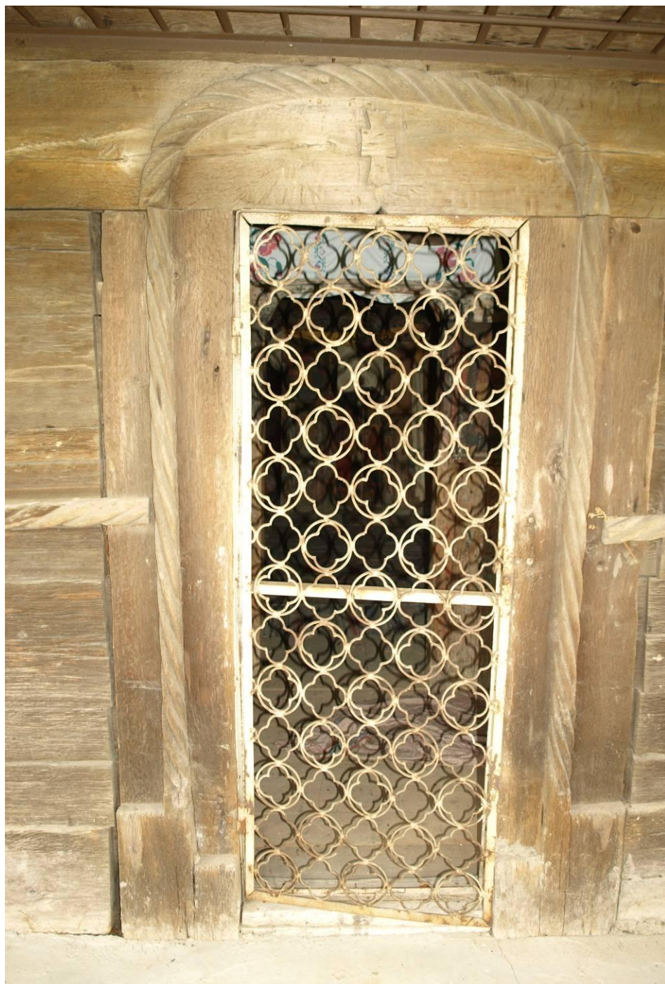
Foto 4. Portal și ancadrament / Portal and framing.