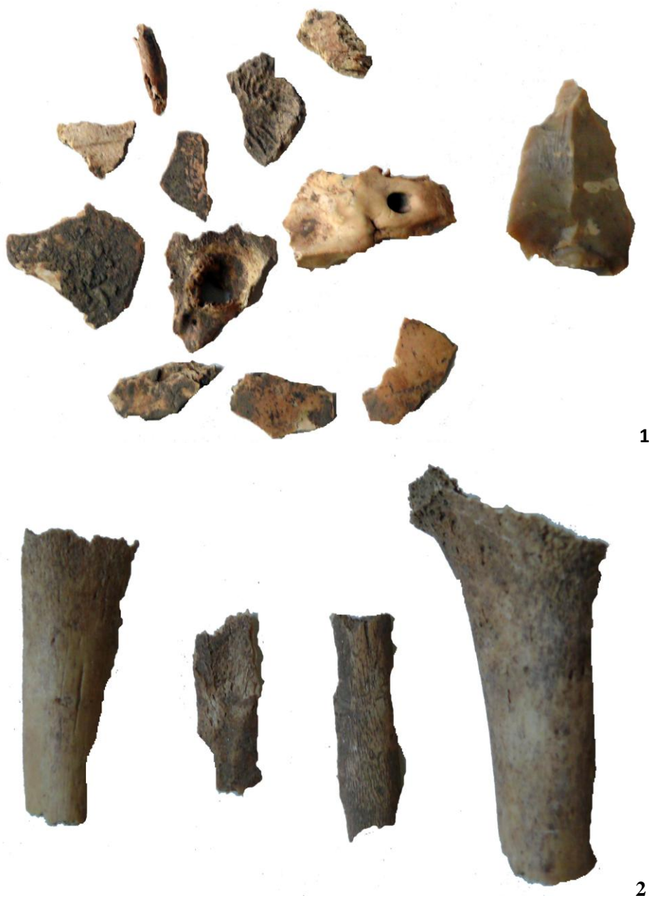
Pl. III. Radovanu- La Muscalu : 1-2 = Mormântul 2 . Diferite scări/ Radovanu- La Muscalu : 1-2 = Grave 2 . Different scales.