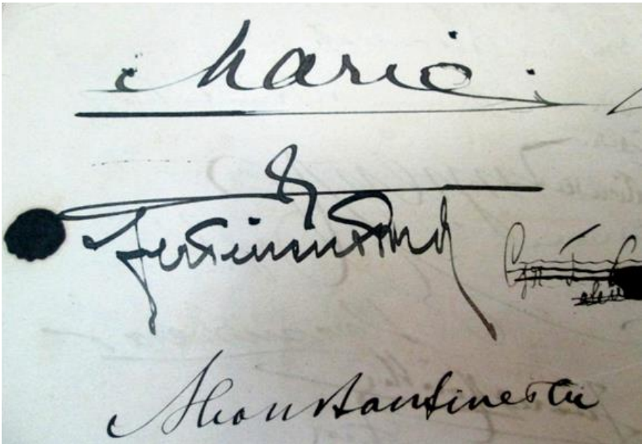
Foto nr.6 Caietul de Impresii din Casa memorială „Elena Farago” – Craiova