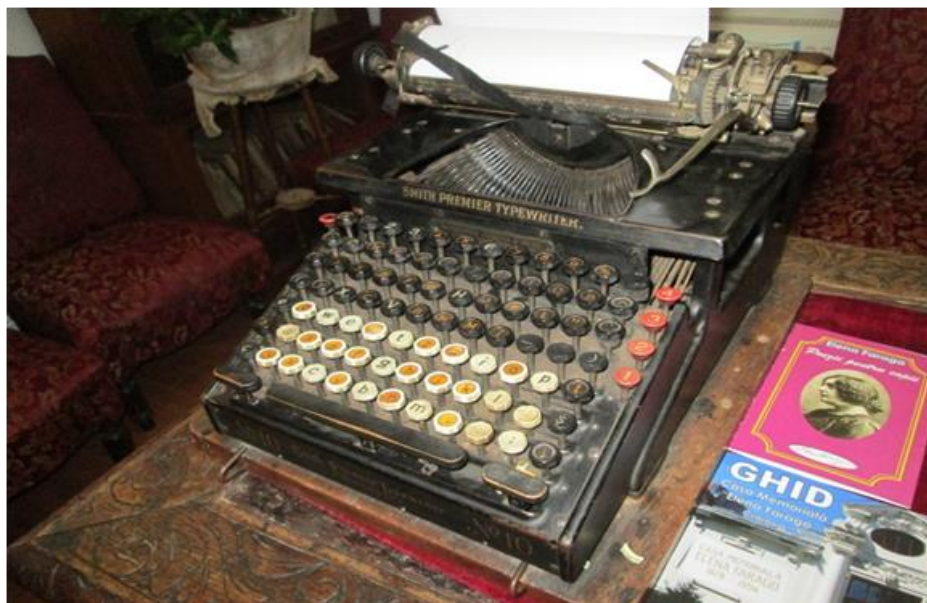
Foto nr.3 Mașina de scris a Elenei Farago - Casa memorială „Elena Farago” – Craiova