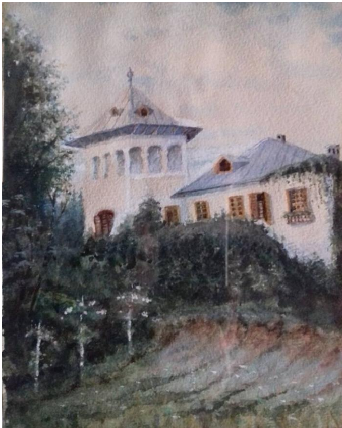
Conacul Bălceștilor începutul sec. XX, acuarela Zoe Mandrea