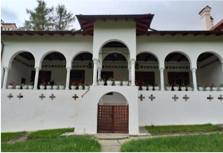
Logia (construită 1937 -1939; piatră de moară, poartă din stejar cu tiranți, coloane din piatră de Baschioi)