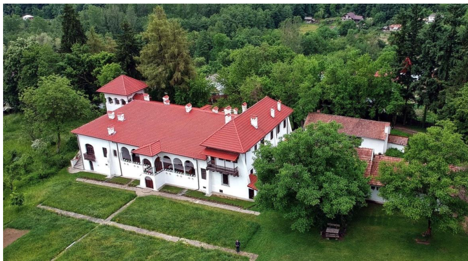
Conacul Bălceștilor – vedere aeriană