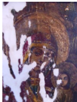
Detaliu din timpul curățării