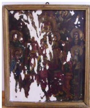
Icoana după chituire