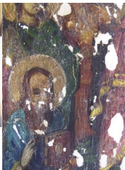
Repictare, brunizare, depuneri aderente, lacune