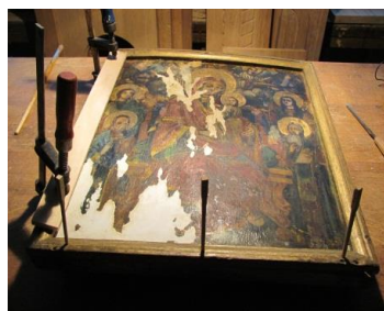
Detaliu din timpul intervenției asupra ramei

Pentru ca pictura originală să își redobândească continuitatea și profunzimea a fost nevoie de integrarea cromatică, optându-se pentru o abordare clasică cu un ton mai deschis și o nuanță mai rece. S-au folosit culori pe bază de apă și emulsie de gălbenuș de ou (1/4). Eroziunile au făcut obiectul tratării în velatura, suprafețele mici în ritocco iar zonele mari în tehnica tratteggio. Vernisarea s-a făcut cu verni de damar 12% aplicat prin pensulare și egalizat îndelung.