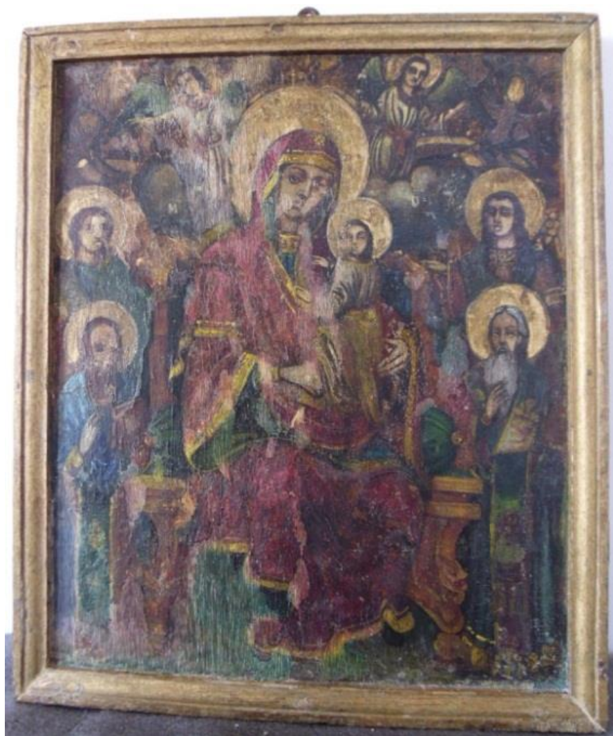
Icoana după restaurare