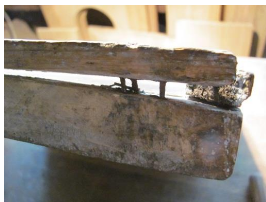
Lemnul ramei a lucrat diferit de lemnul icoanei lăsând spațiu în care s-au acumulat depuneri

Suportul prezenta: orificii de zbor rămase în urma unui atac xilofag, desprinderi ale ramei sub care s-a adunat murdărie, depuneri aderente și o fisură în partea inferioară ce traversează întreaga grosime a icoanei.