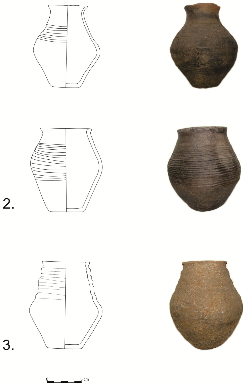
Fig. 2 - Vasele aparținând grupului ceramic IB1.