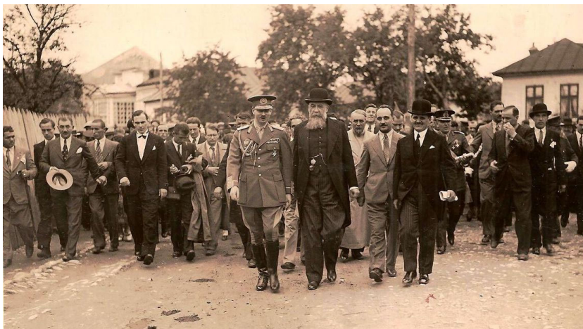
Vizita lui Carol al II-lea la Vălenii de Munte în 1930

împlinirea granițelor, dar și unul pentru ridicarea sufletească a sufletelor oropsite”, va spune Iorga. Școala de la Vălenii de Munte a fost o adevărată școală de patriotism, care a jucat un rol important în consolidarea conștiinței naționale.