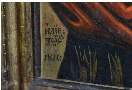
Figura 18 – detaliu 2