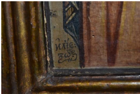
Figura 18 – detaliu 1