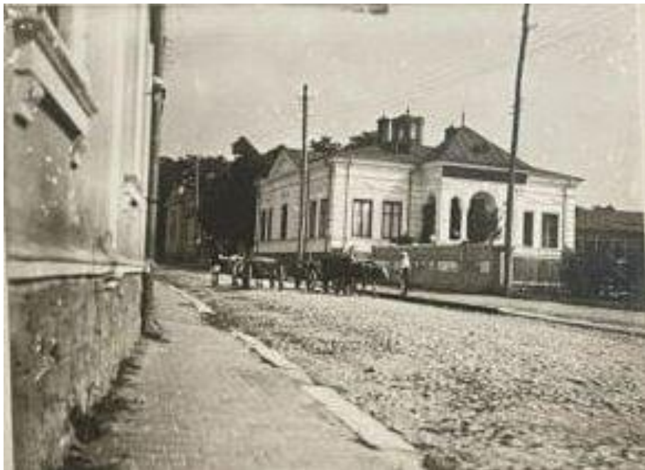
Liceul de fete din Strada Praporgescu

La sfârșitul anului școlar 1924, Școala de fete a cumpărat o clădire în Str. Praporgescu nr. 36 (căreia i s-a adăugat, ulterior, o aripă nouă), ca sediu propriu. Este fosta casă a doctorului Ioan Suci, cel dintâi medic al spitalului județean din Vâlcea. Astăzi, acolo se află clădirea de sticlă a BRD.