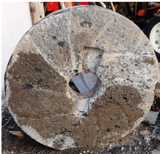
Fig. 6. O piatră de moară ferecată

Ce însemna pentru morar să ferece pietrele de moară? Dacă privim cu atenție o piatră de moară, vedem acolo niște șanțuri care pornesc din centrul acesteia, radial, către margini. Sunt șanțurile prin care se scurge mălaiul rezultat din boabele de porumb măcinate. Pentru că pietrele se uzează în timp, din când în când, acele șanțuri trebuie refăcute. Adâncite! În felul acesta se fereau pietrele de moară!