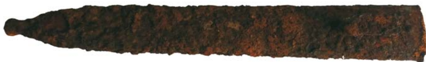
Teacă de baionetă (SII/M.5)