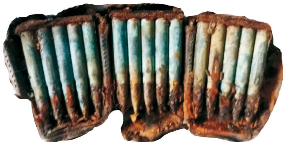
Cartușiere de tip Mauser (SC/M.3)