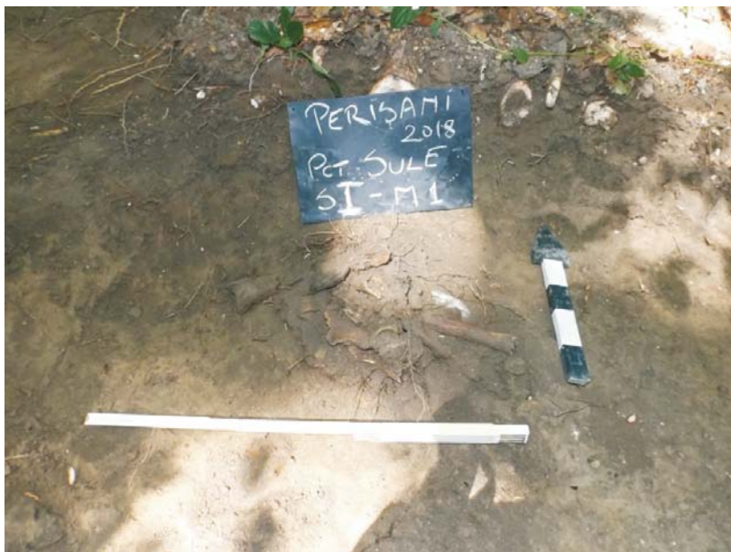
SI/M.1 - planul 2