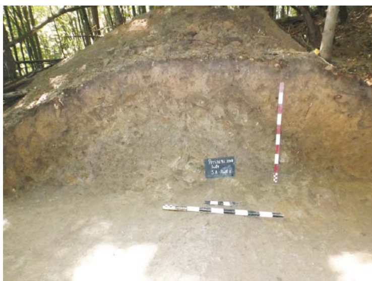
Profil de Est al SA - val