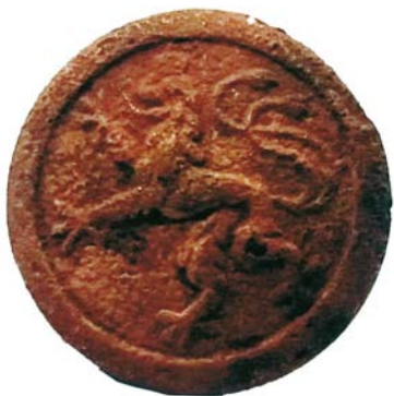
Buton militar german (SA/M2) - avers