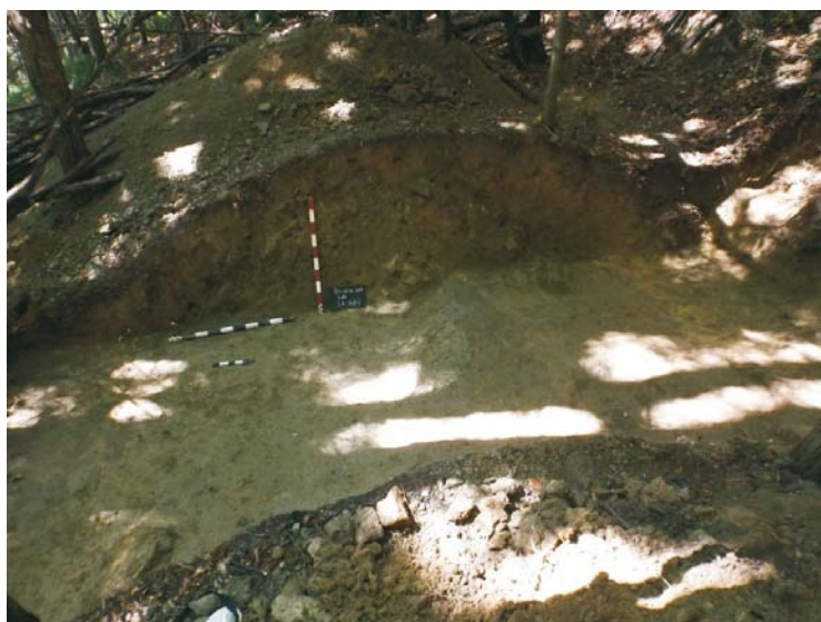
Profil de Est al SA - val