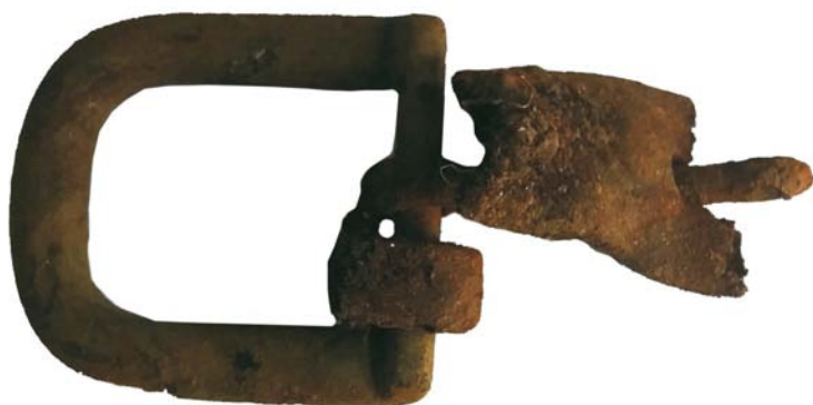
Cataramă din bronz (SA/M.2')