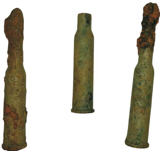
Cartușe de tip 6,5 x 53R pentru pușca cu repetiție Mannlicher M93