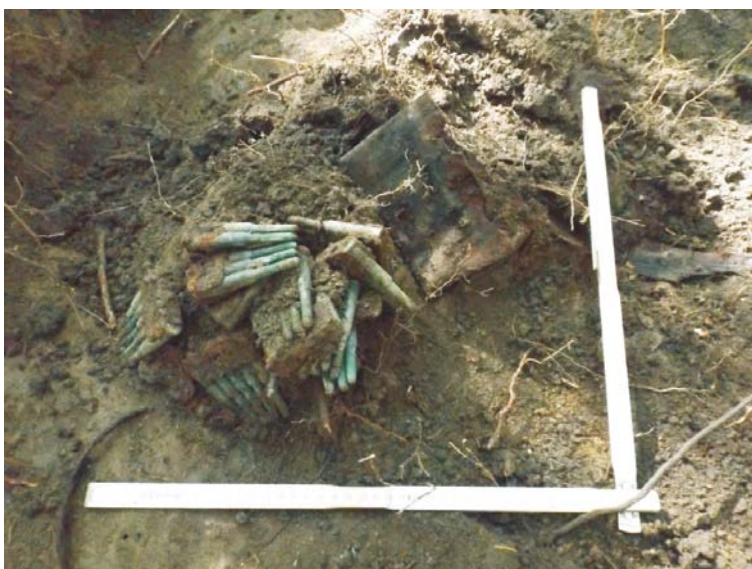
SA/C1 - M2' (cartușiere de tip Mannlicher M93)