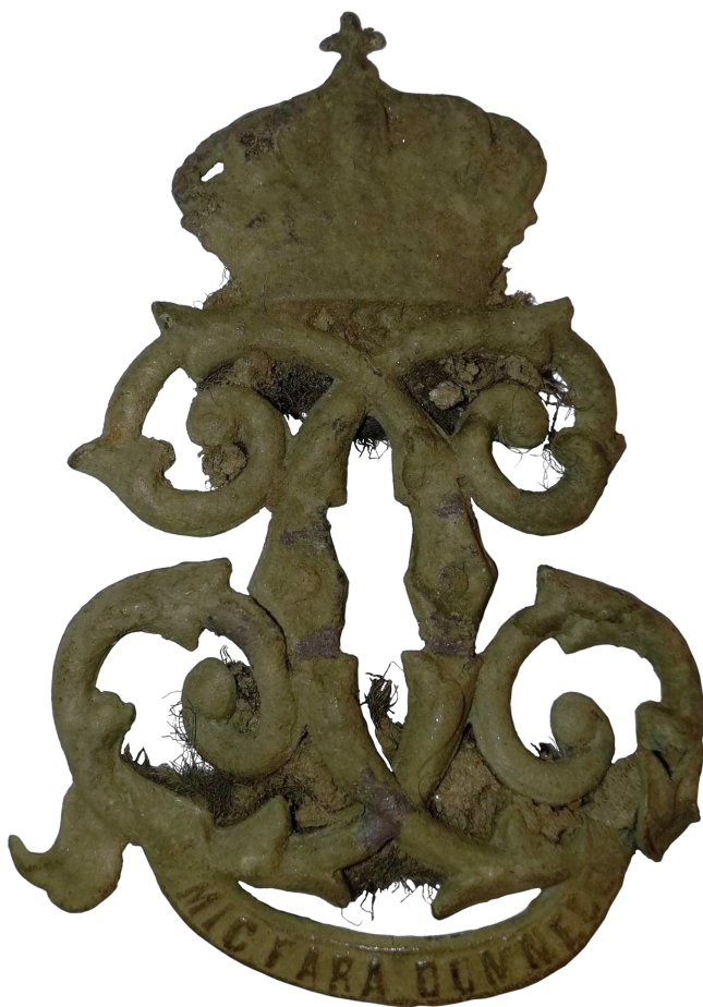
Cifru regal de la căciulă de iarnă model 1895 (passim lângă SI)