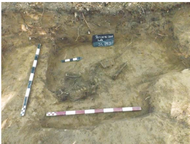
SC/M.3 - planul 2