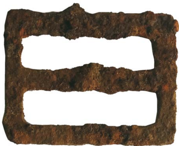
Cataramă din fier (SC/M.3)