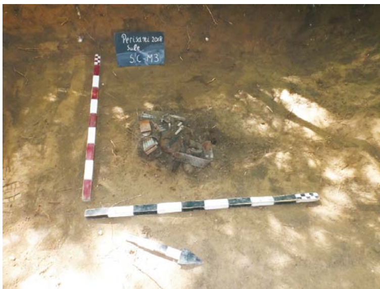
SC/M.3 - planul 1