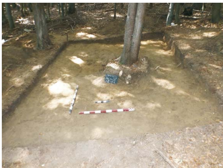
SI/M.1 - finalul cercetării