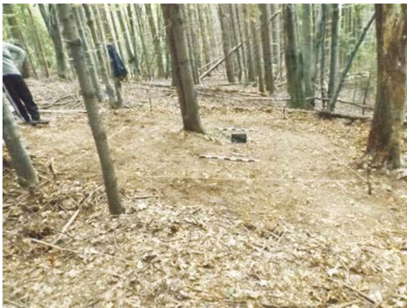
SI/M.1 - debutul cercetării