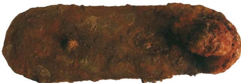
Palchiu pat de pușcă (SB)