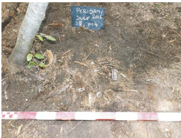
SII/M.4 - aspect cercetare