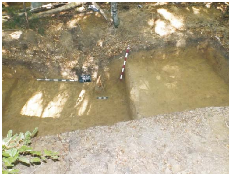
SB - profil de Est