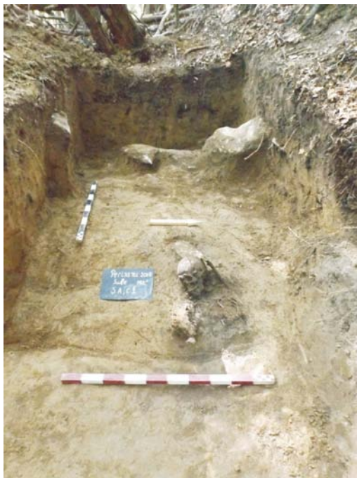
SA/C1 - M2"