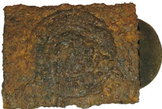
Cataramă de curea (SC/M.3) - avers