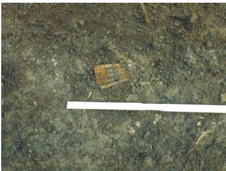
SA/M.2' - aspect săpătură