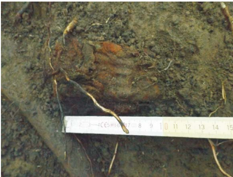
SA/C1 - M2' (cartușiere de tip Mannlicher M93)