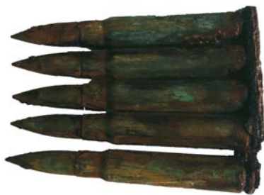
Lamelă cu 5 gloanțe de tip Mauser (SC/M.3)