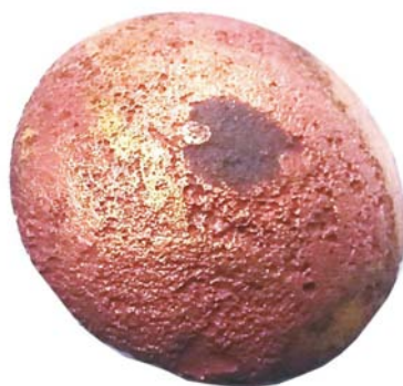
Buton militar românesc (SA/M2') - avers