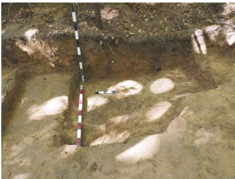
SC - profil de Est