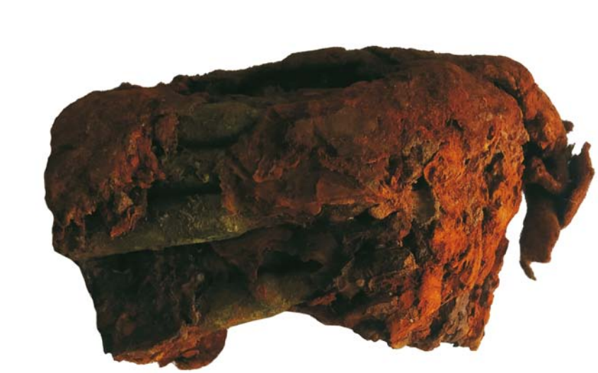
Cartușieră de tip Mannlicher (SA/C1 - M2')