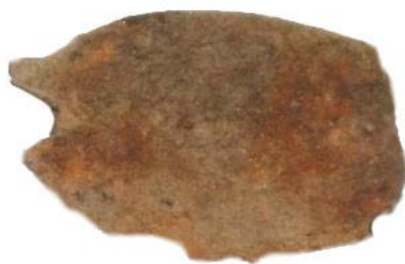
Fragment lingură din fier (SI/M.1)