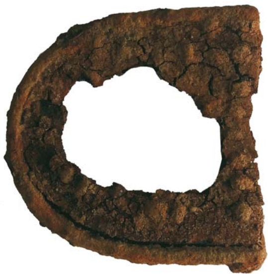
Fragment talpă de bocanc (SA/M.2)