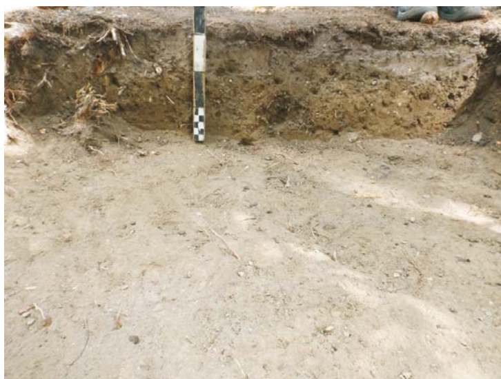
SII - profil de Nord