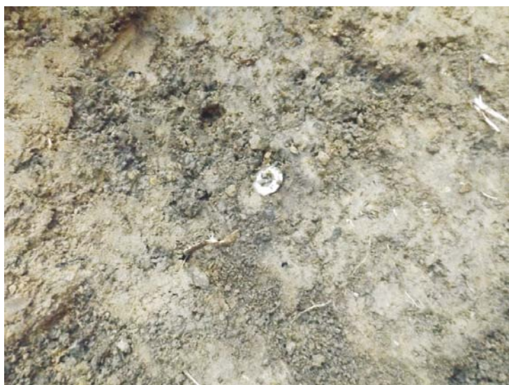
SA/C1 - M2" (nasture)