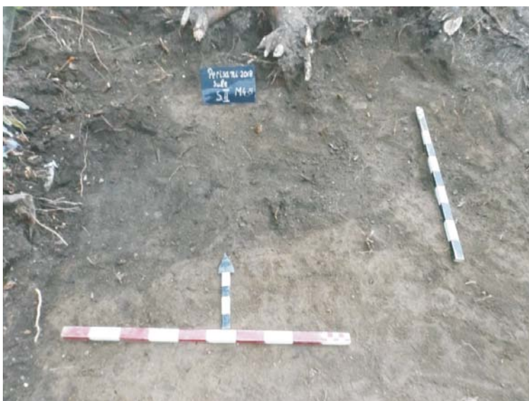
SII - conturarea complexului