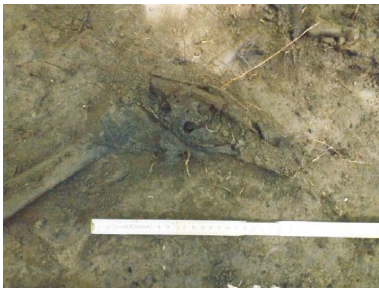
SA/M.2" - resturi bocanci