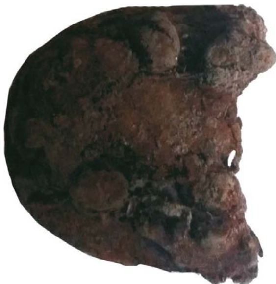
Fragment talpă de bocanc (SII/M.6)