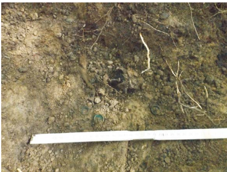
SC/M.3 - butoni