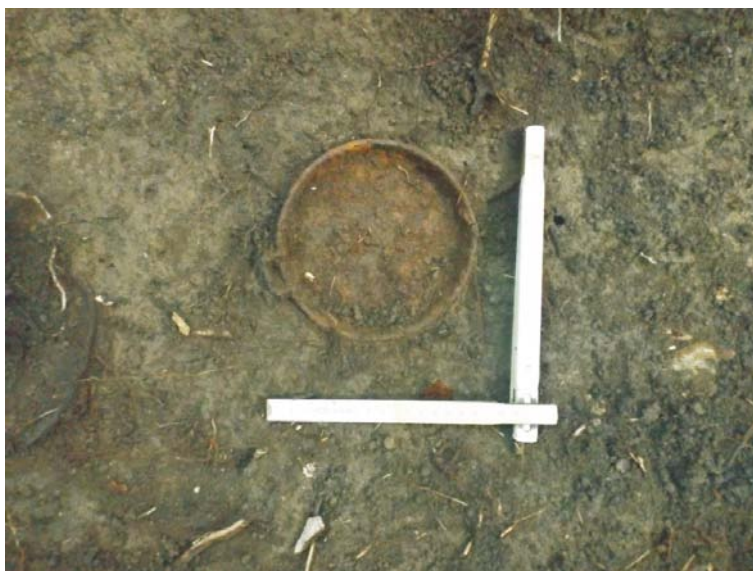
SA/M.2' - capac gamelă