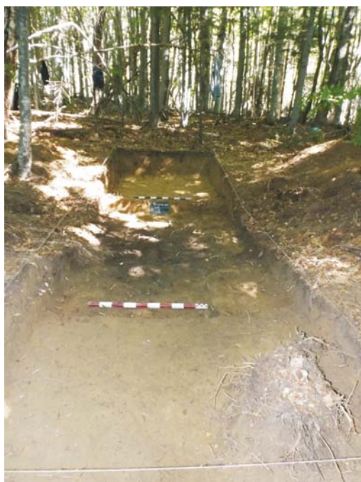
SB - aspect săpătură (cuib de mitralieră/groapă de obuz?)