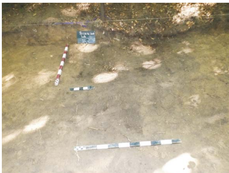
SC - aspect săpătură