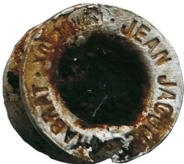
Inel de prelată de cort de proveniență franceză (SA/M.2")