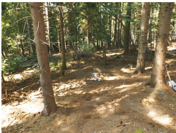
SII/M.4 - debutul cercetării și trasarea suprafeței