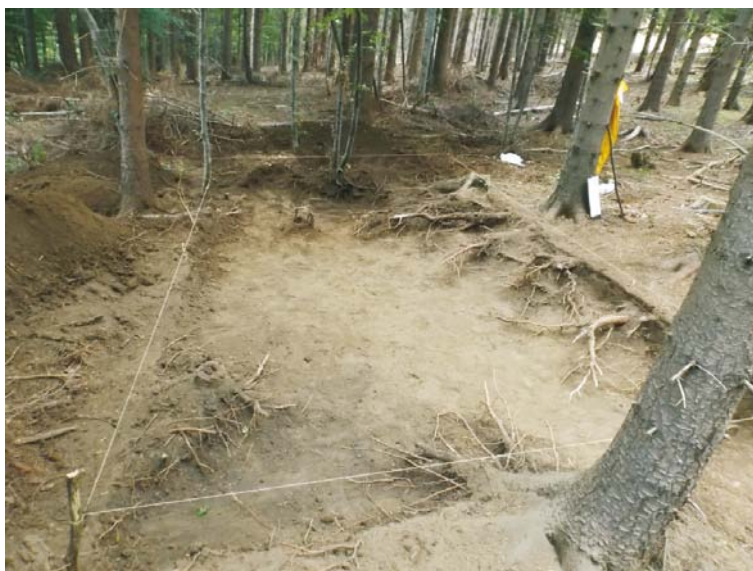
SII - aspect cercetare