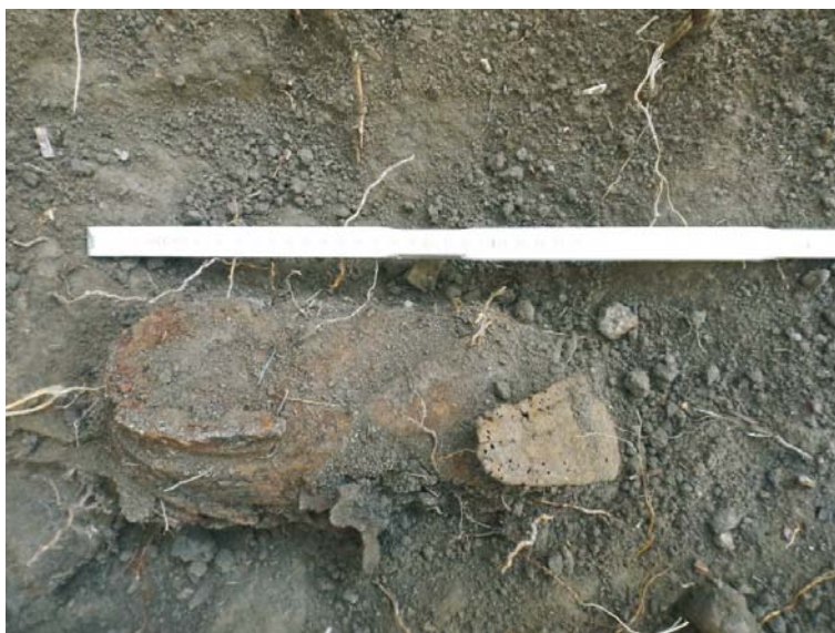
SII/M.5 - bocanci