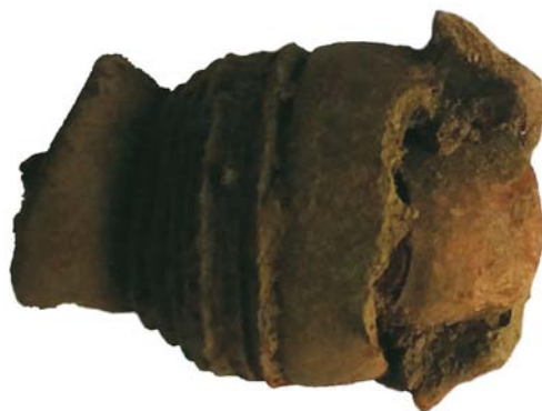
Manșon din bronz/Filtru mască de gaze (SII/M.4)