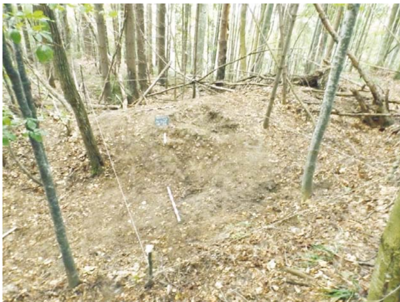
SA/M.2 - debutul cercetării și trasarea secțiunii