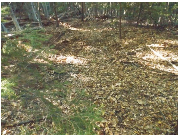
SB - debutul cercetării și trasarea secțiunii