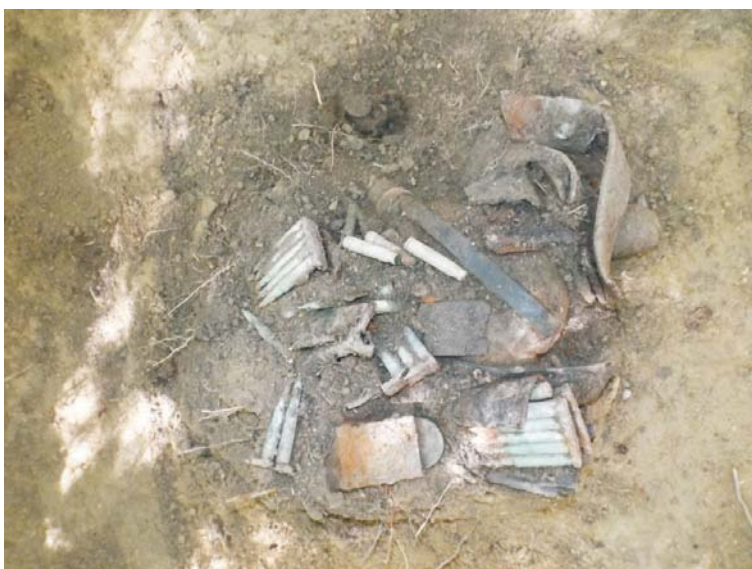
SC/M.3 - planul 1