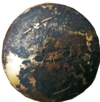
Buton militar românesc (SII/M.4)