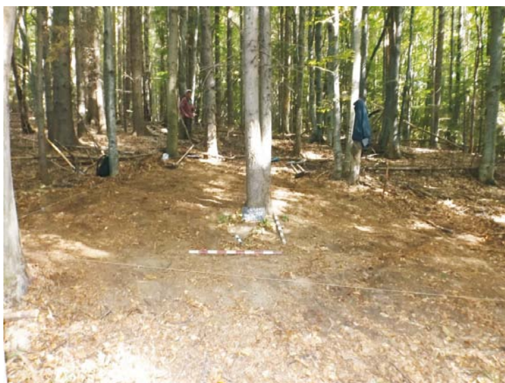
SI/M.1 - debutul cercetării