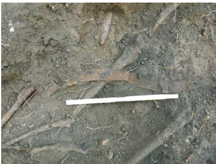
SII/M.6 - centură/curea