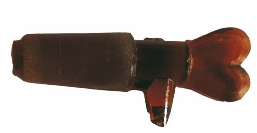
Capac de sticlă sanitară (SC/M.3)