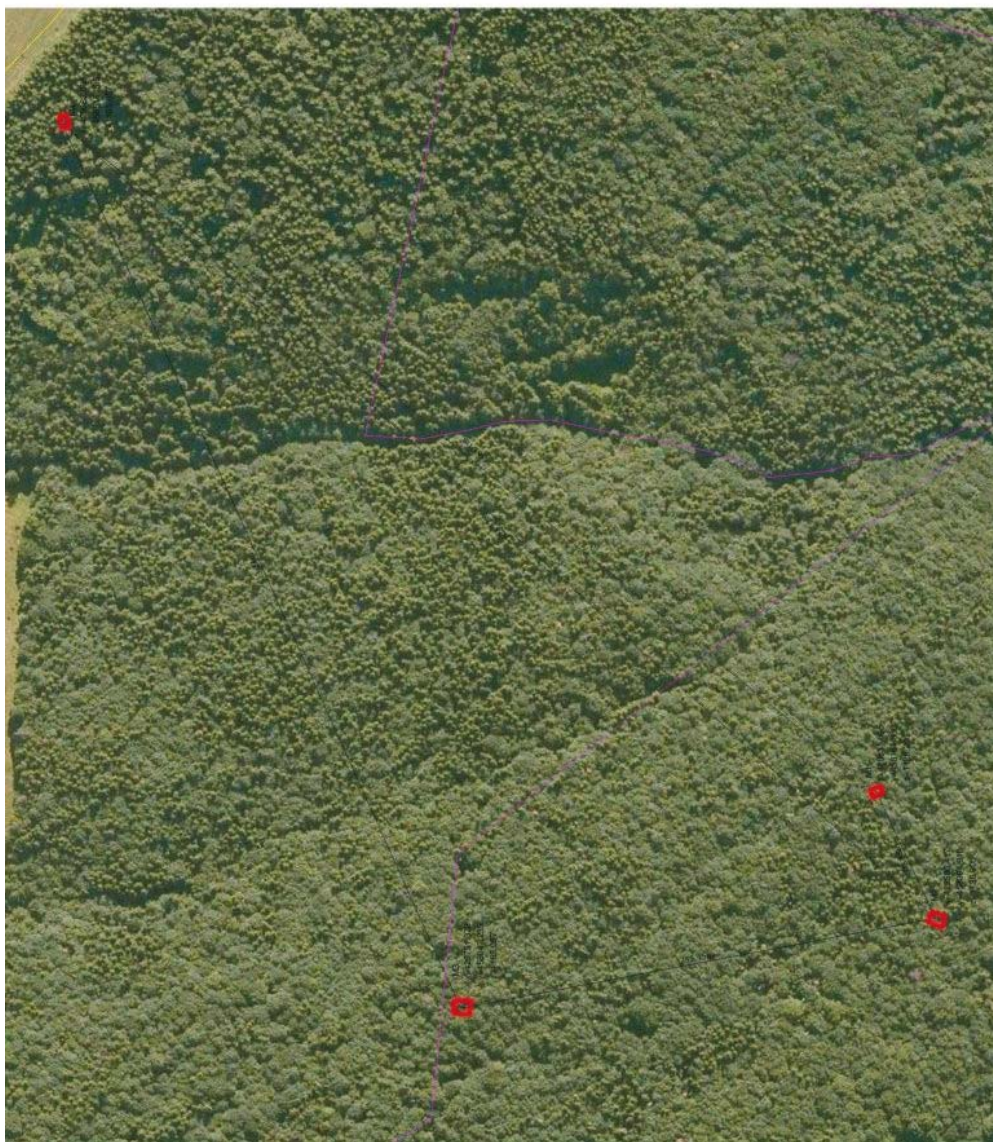
Ortofotoplan cu poziționarea celor patru complexe