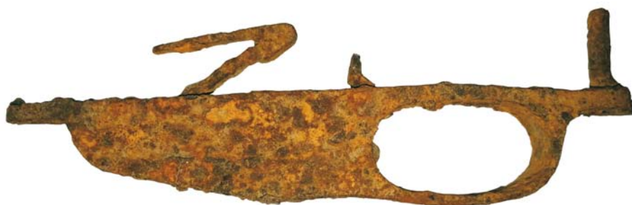
Gardă trăgaci pentru pușcă cu repetiție de tip Mannlicher (SA/M.2)