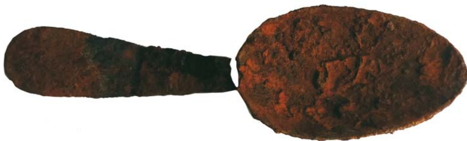
Lingură din fier (passim lângă SA)