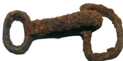
Carabină din fier/Sistem prindere curea armă (SC/M.3)