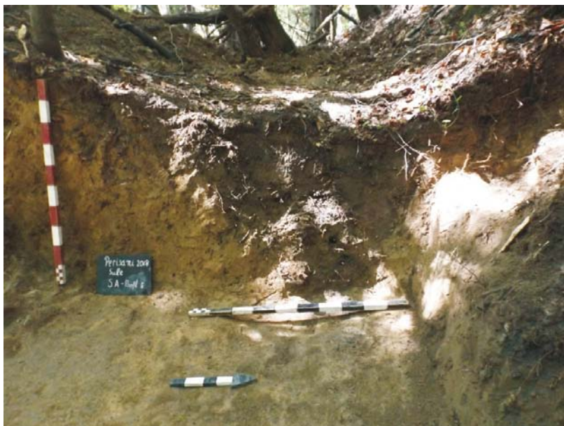
Profil de Est al SA - tranșee