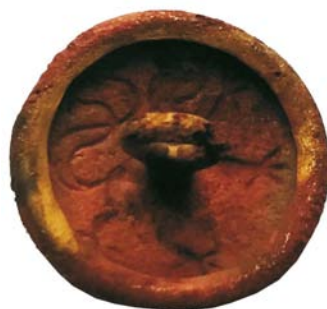
Buton militar german (SA/M2) - revers