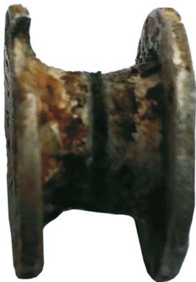
Inel de prelată de cort de proveniență franceză (SA/M.2")