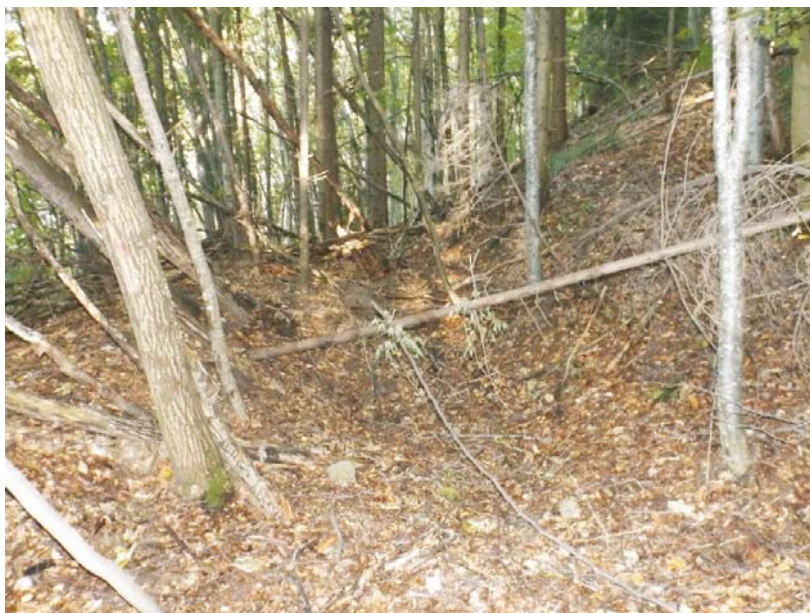
SA/M.2 - debutul cercetării