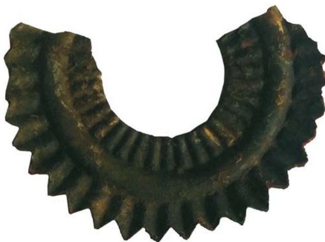
Cocardă de cască cu țui de tip Pickelhaube (SC/M.3) - avers