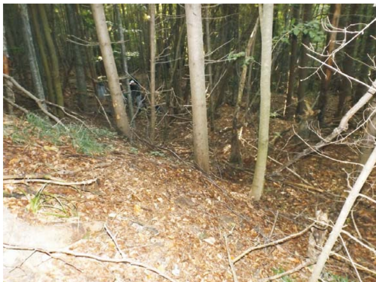
SA/M.2 - șanț tranșee