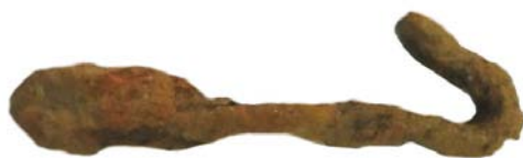
Carabină din fier/Sistem prindere curea armă (SII/M.5)