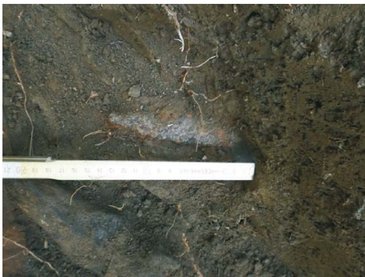
SII/M.6 - baionetă