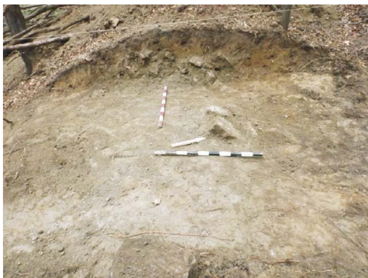
SA/M.2 - aspect săpătură și secționare val