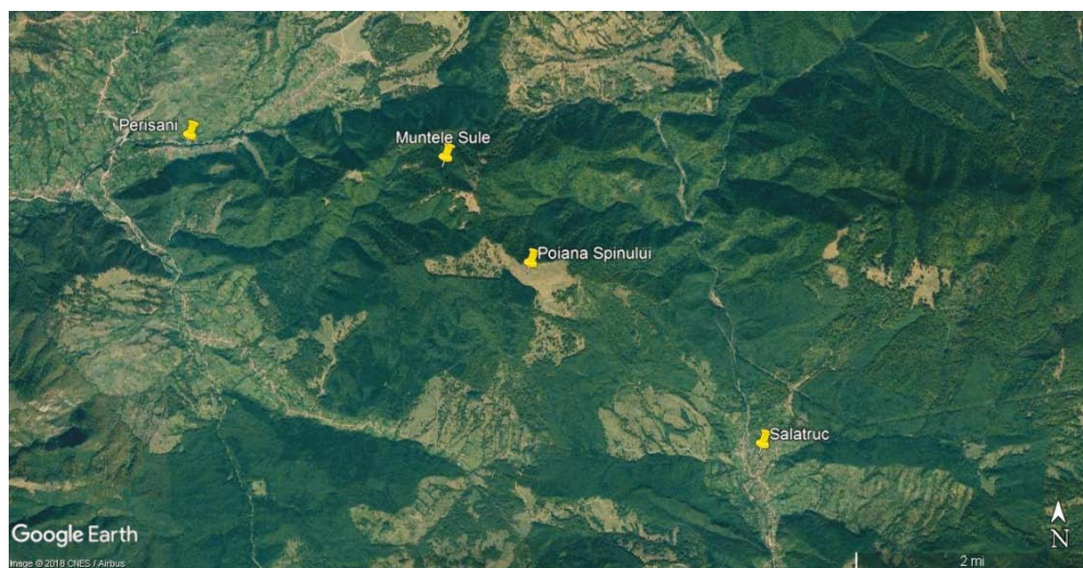
Harta satelitară cu punctele prezentate în text