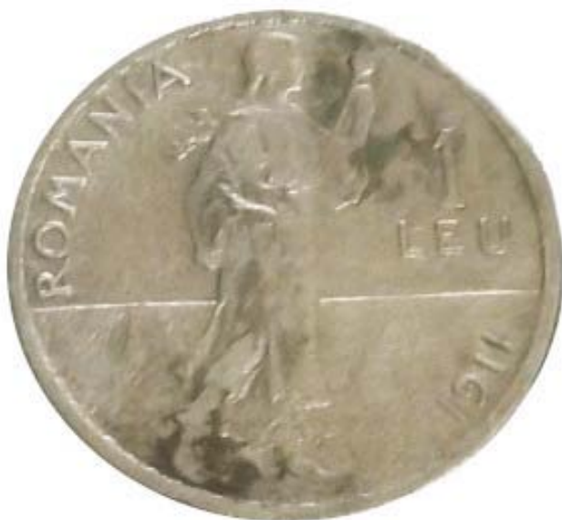
Monedă din argint din 1911 (SA/M.2')