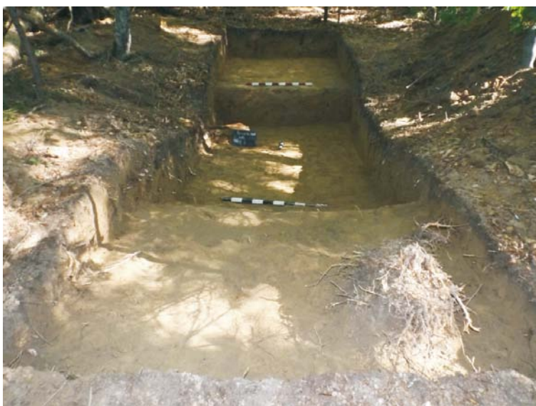
SB - finalizarea cercetării