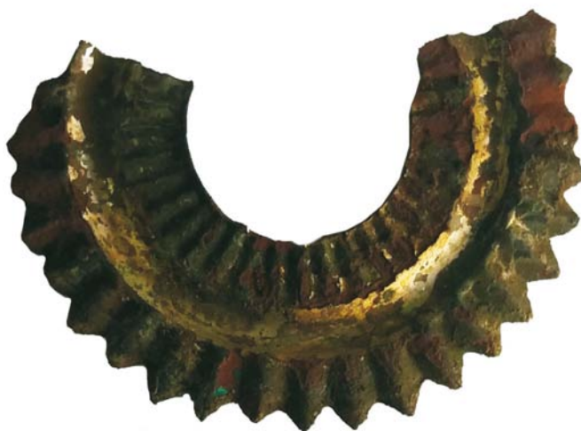
Cocardă de cască cu țui de tip Pickelhaube (SC/M.3) - revers