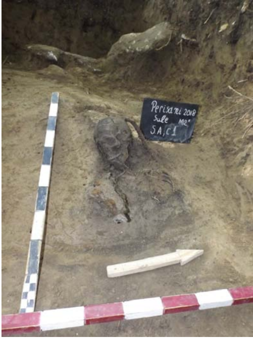
SA/C1 - M2"