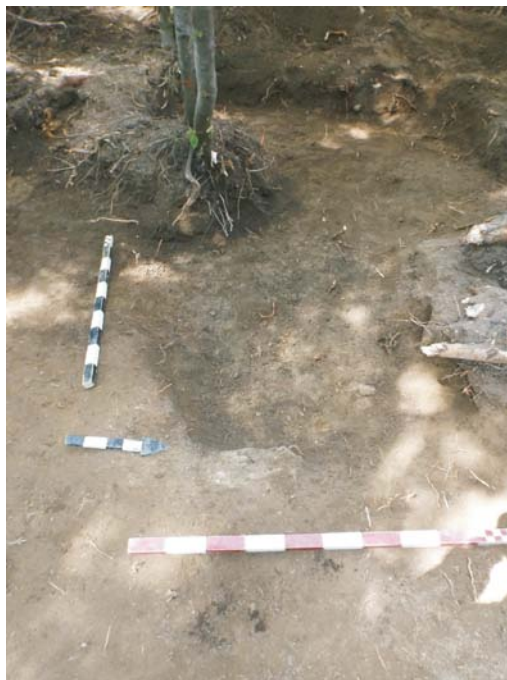
SII - finalizarea cercetării