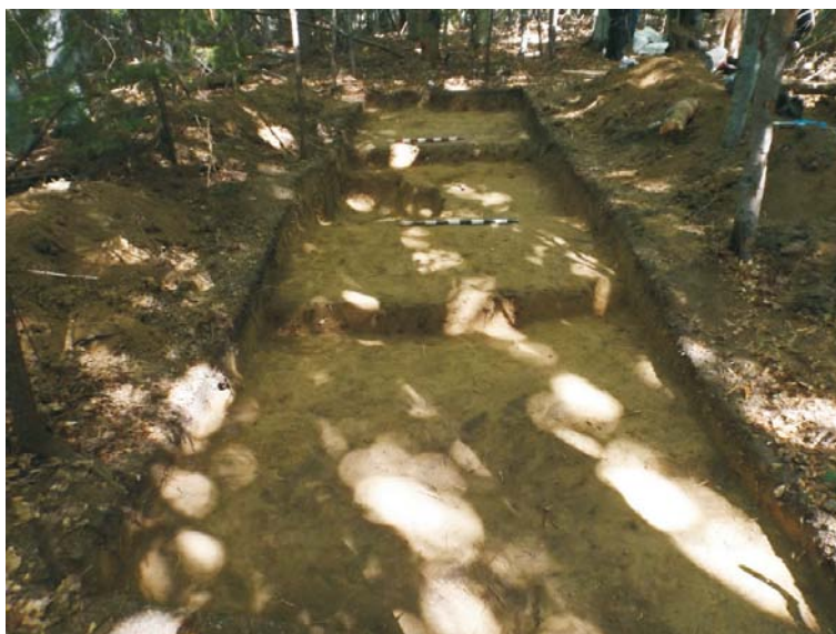
SC - finalul cercetării