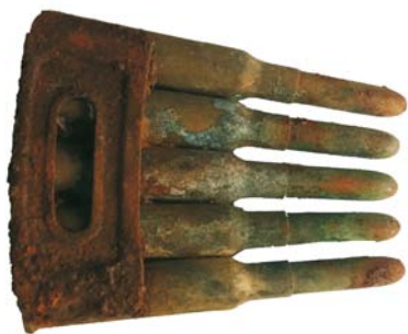
Lamelă cu 5 gloanțe de tip Mannlicher (SA/M.2')