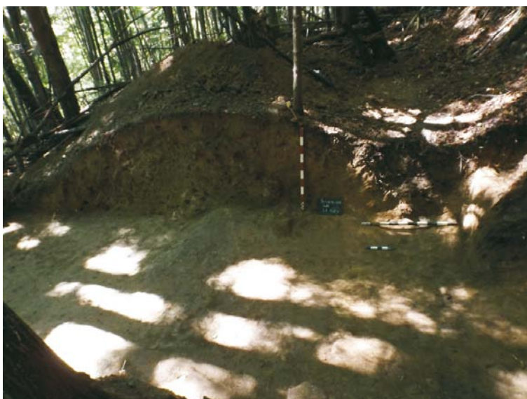
Profil de Est al SA