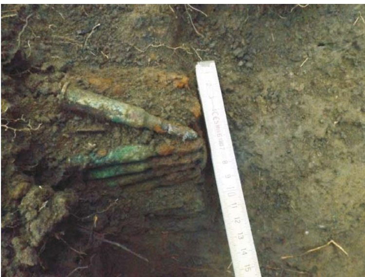
SA/C1 - M2' (cartușiere de tip Mannlicher M93)