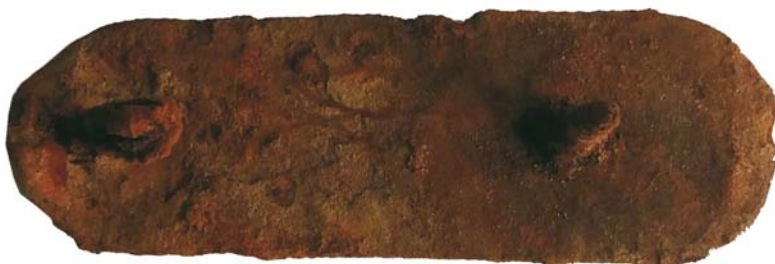
Plachiu pat de pușcă (SA/M.2)