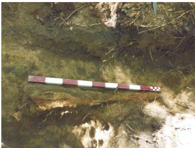
SB - pușcă cu repetiție de tip Mannlicher M93