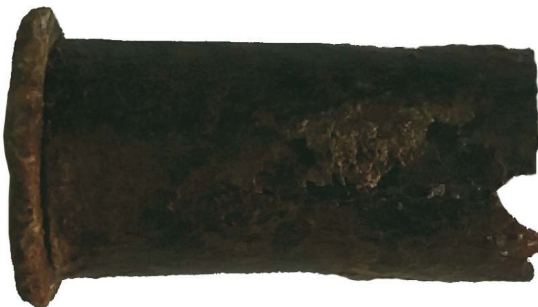
Tub de cartuş cu percuţie în ramă provenind de la un revolver pre-1880 (armă personală a unui ofiţer?) (SB)