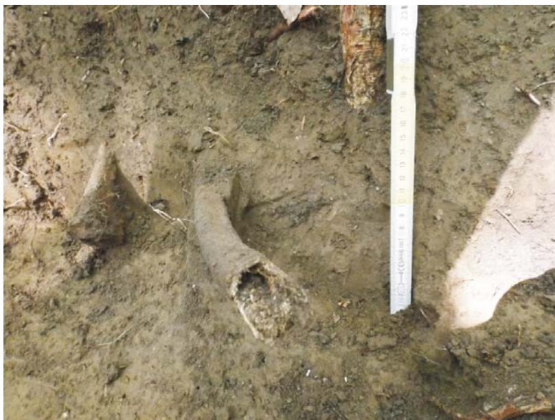
SI/M.1 - detaliu