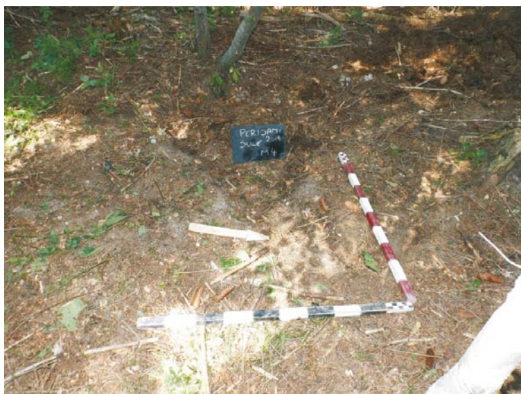
SII/M.4 - debutul cercetării