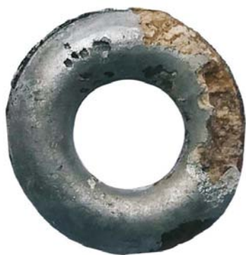
Inel de prelată de cort (SA/M.2”)