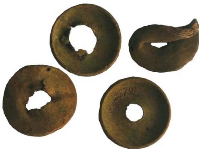
Bucăți de filtru de la masca de gaze (SII/M.4)