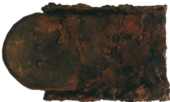
Cataramă de curea (SC/M.3) - revers