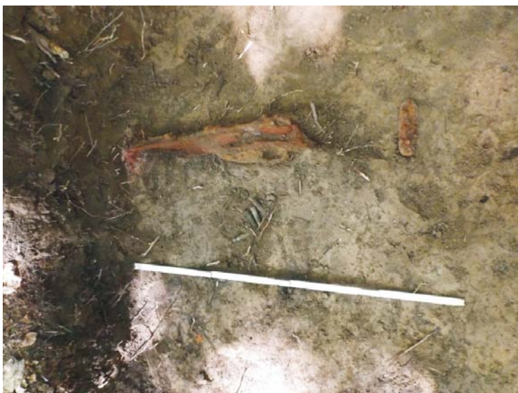
SB - pușcă cu repetiție de tip Mannlicher M93 și muniție