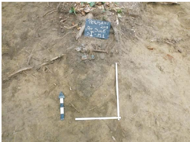
SI/M.1 - planul 1