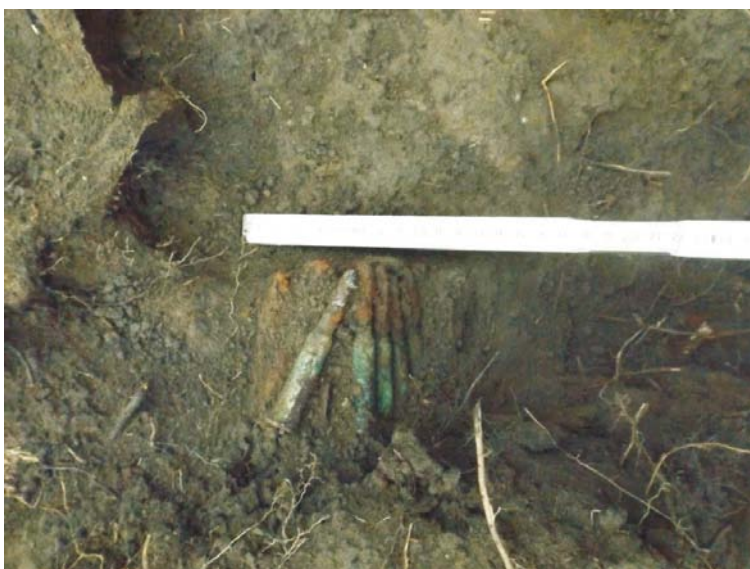
SA/C1 - M2' (cartușieră de tip Mannlicher M93)