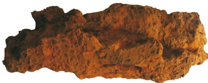
Fragment obuz/Schijă (SII/M.4)