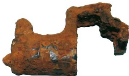
Sistem de percutare Mannlicher (SA/M.2')