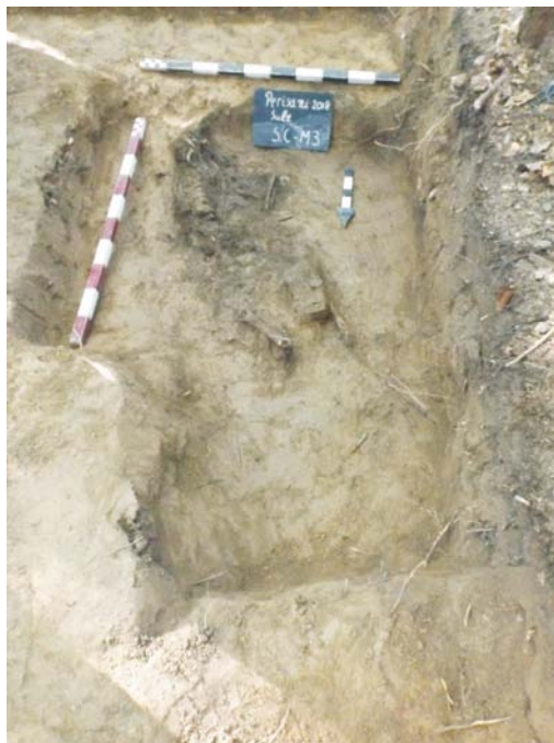
SC/M.3 - planul 2