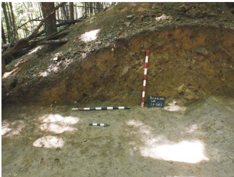
Profil de Est al SA - val