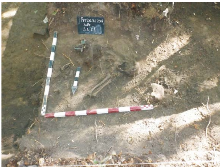
SA/C1 - M2-M2'