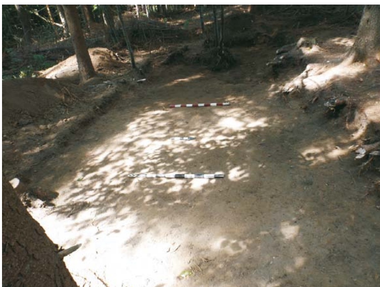
SII - finalizarea cercetării