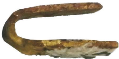
Carabină din bronz/Sistem prindere curea armă (SA/M.2')