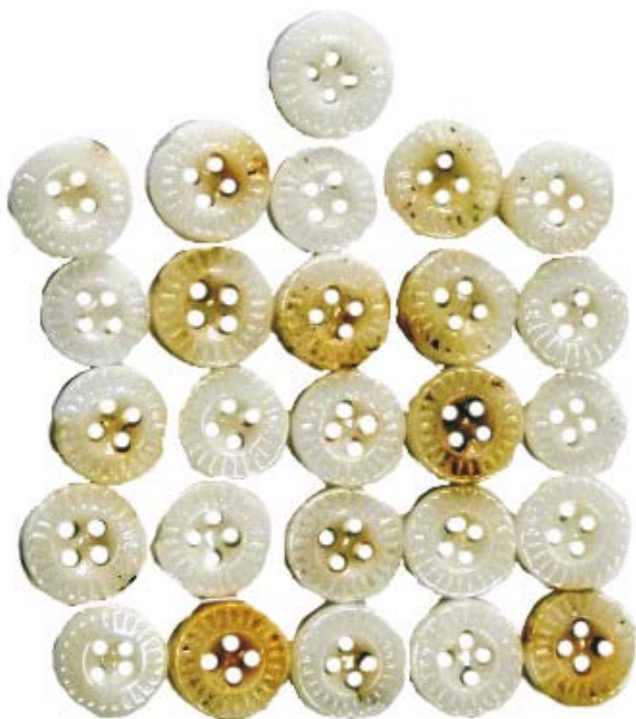
Nasturi de vestă (SA/M2'-M2")