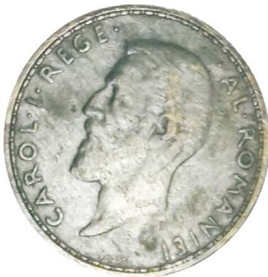
Monedă din argint din 1910 (SII/M.4)