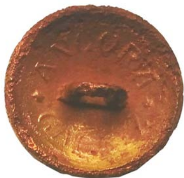
Buton militar românesc (SA/M2') - revers