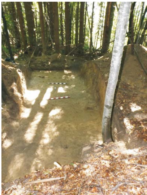
Profil de Est al SA - finalul cercetării