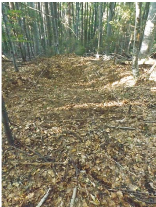
SC - debutul cercetării și trasarea secțiunii