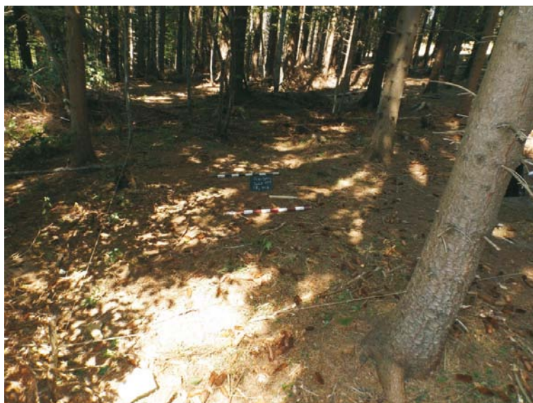
SII/M.4 - debutul cercetării