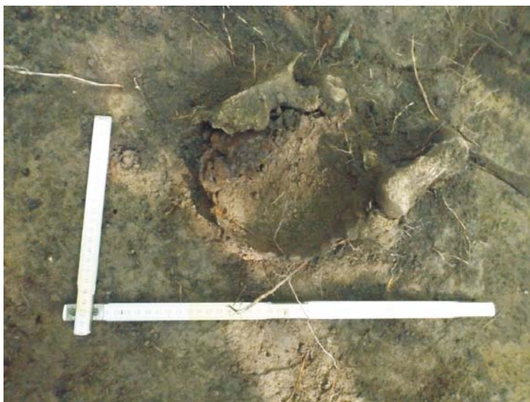
SA/C1 - M2' (gamelă)