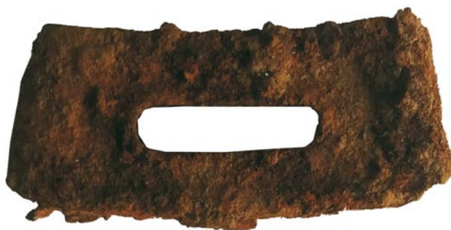
Lamelă pentru cartușe de tip Mannlicher (SB)