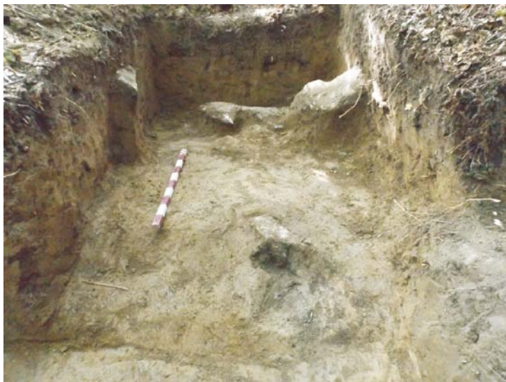
SA/C1 - finalul cercetării