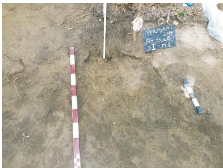
SI/M.1 - planul 3