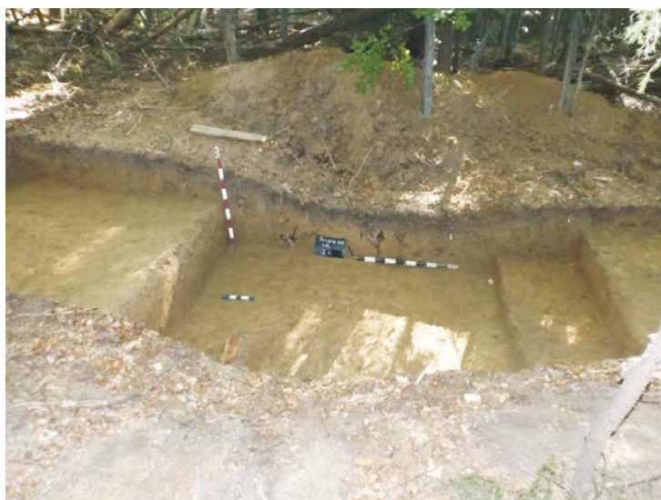
SB - profil de Vest