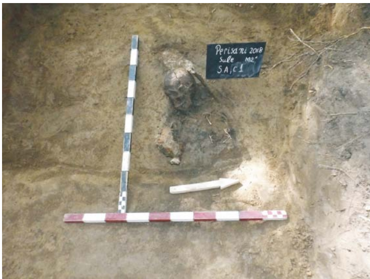
SA/C1 - M2"