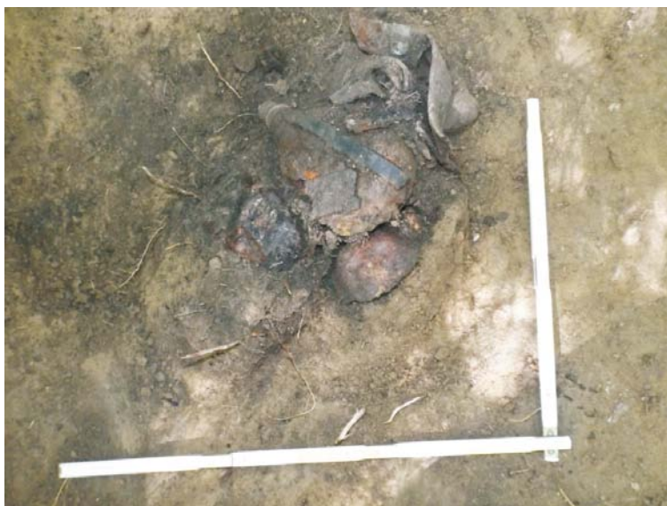
SC/M.3 - planul 1