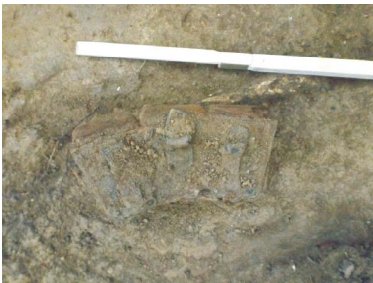
SC/M.3 - cartușiere de tip Mauser