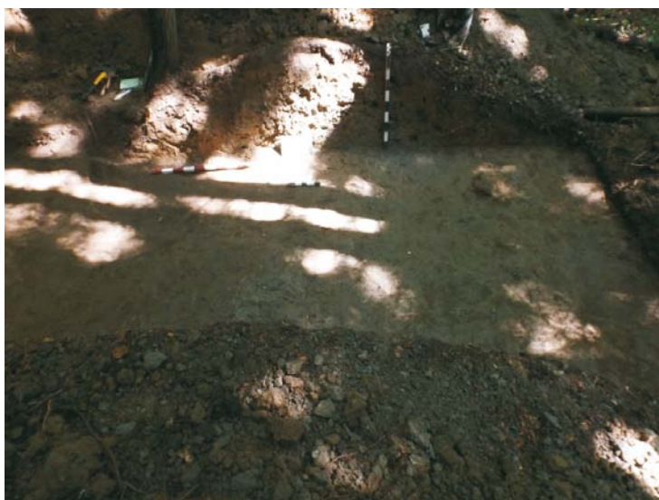
Profil de Vest al SA