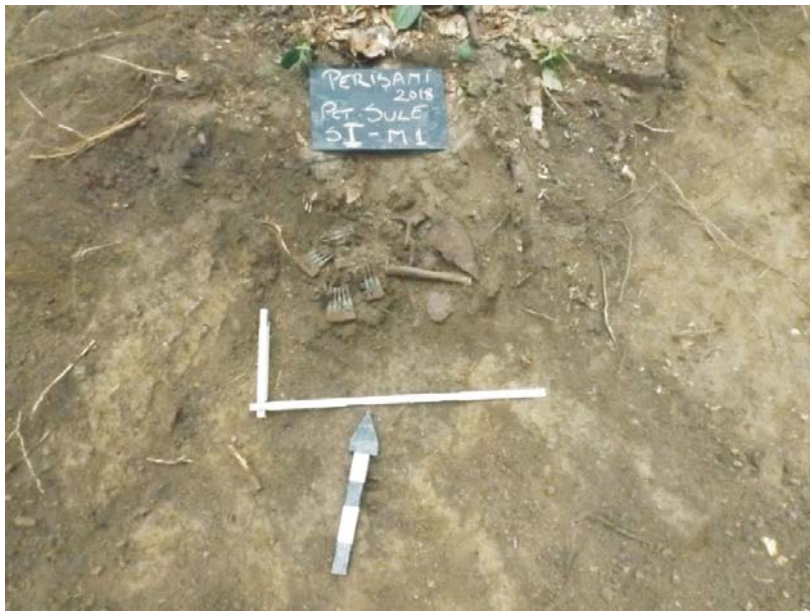
SI/M.1 - planul 1