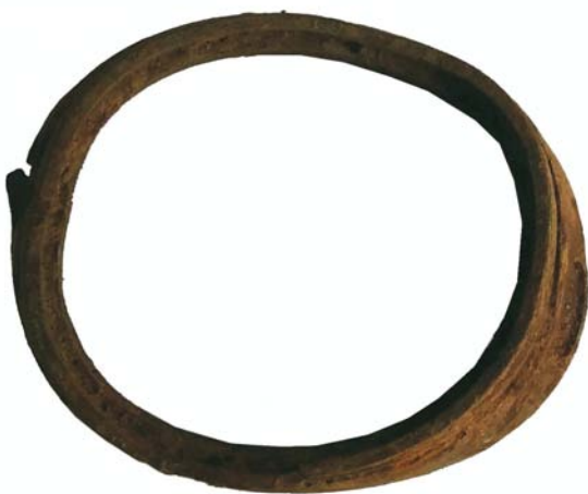
Ramă de ochelari din bronz de la masca de gaze (SII/M.4)