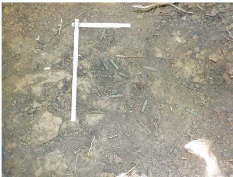
SB - cartușe trase