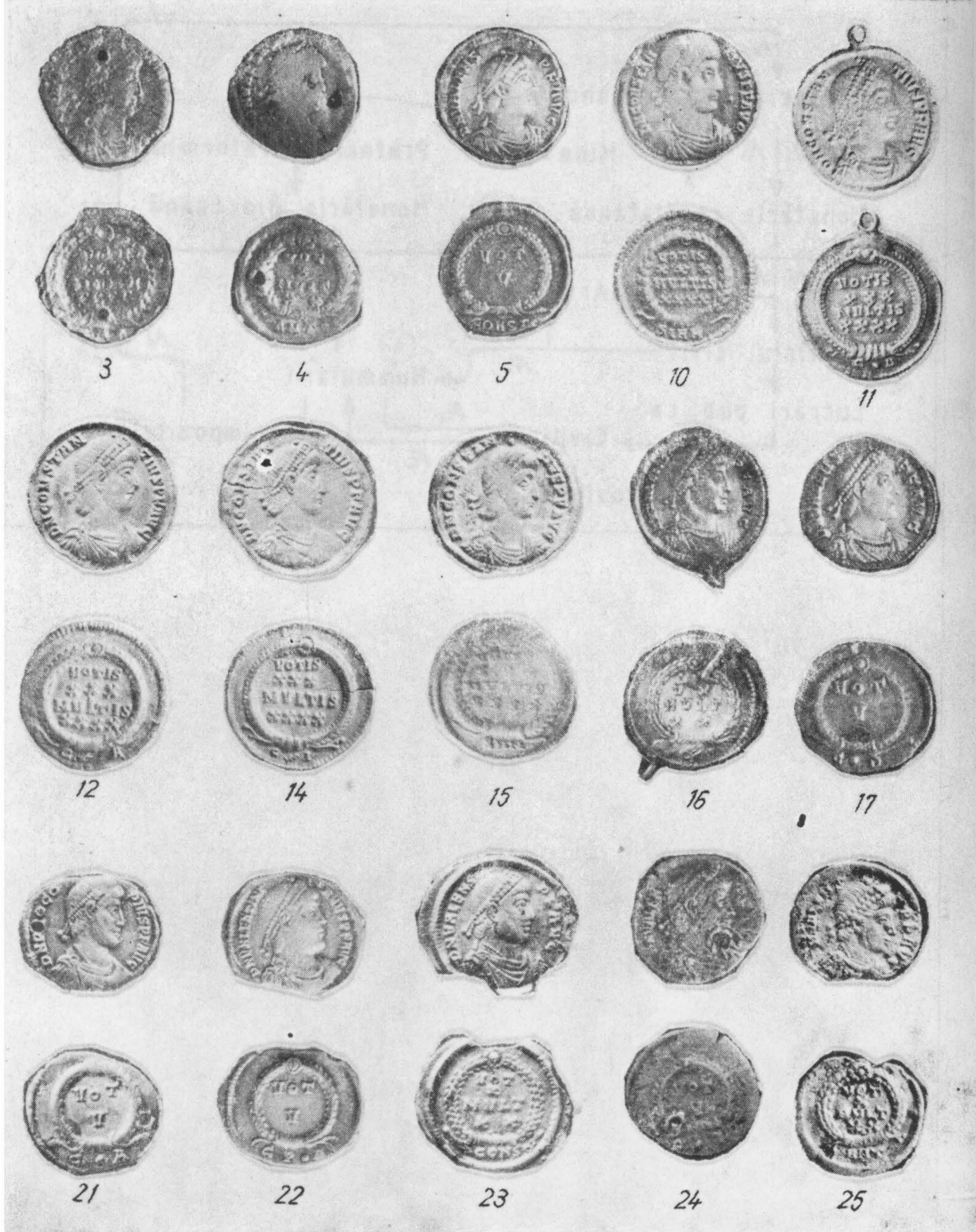
FIG. 2. MONEDDE DE ARGINT DESCOPERITE ÎN DOBROGEA. FIG. 2. MONNAIES D'ARGENT DÉCOURTES EN DOBROUDJA