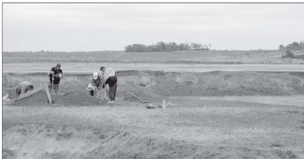
Fig. 3. Așezare Boian pe Valea Clăniței. În plan secund tell-ul de la Măgura-Bran.