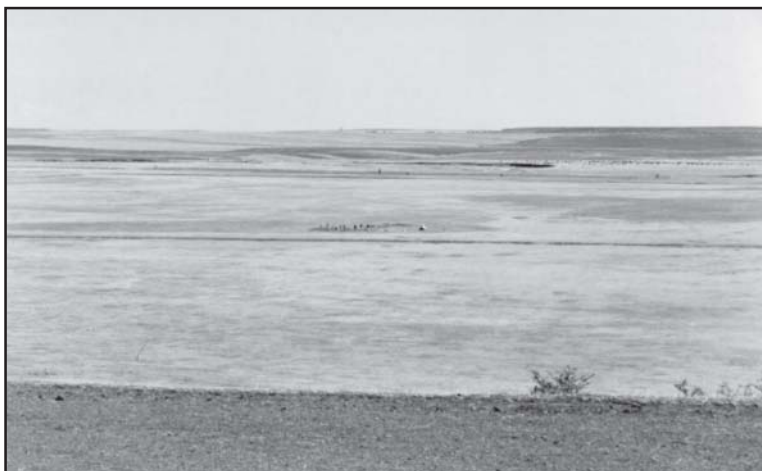
Fig1. Valea Teleormanului, Lăceni-Măgura. Punctul “Cioroaica”