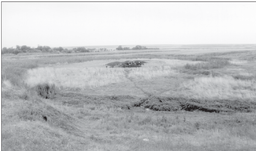
Fig. 5. Vitănești II. Vedere dinspre nord.