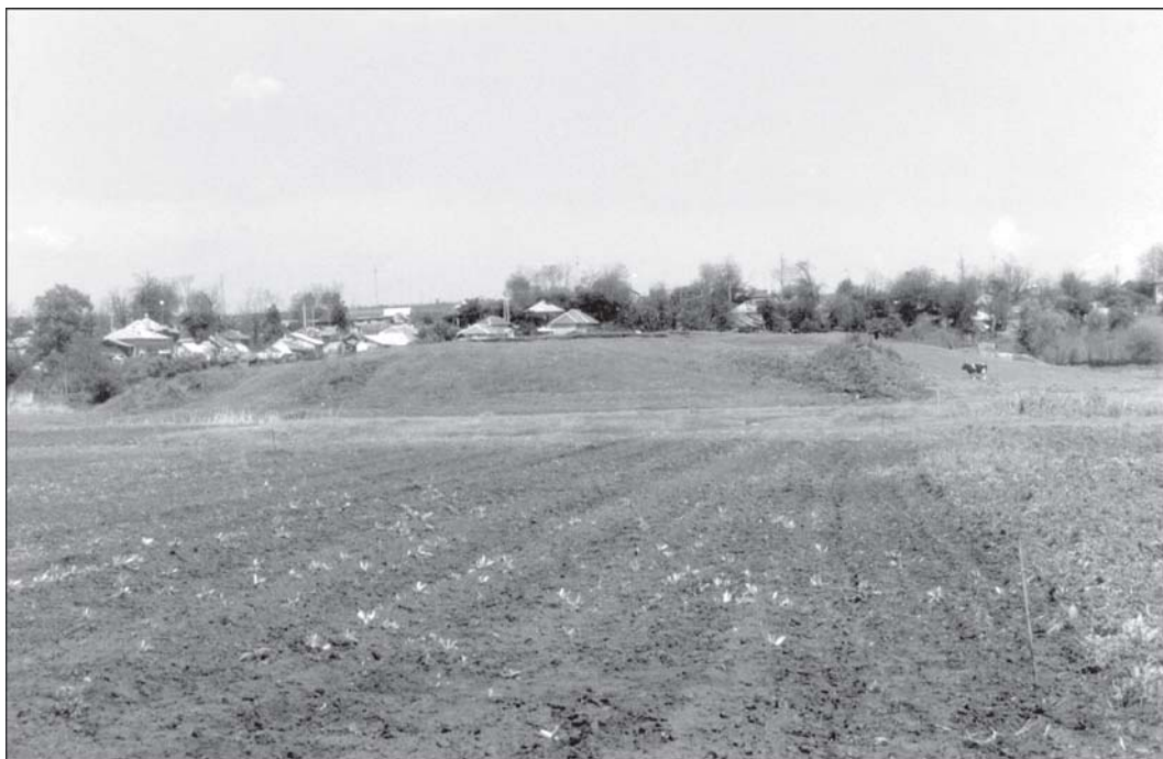
Fig. 4. Vitănești-tell. Vedere dinspre sud-vest.