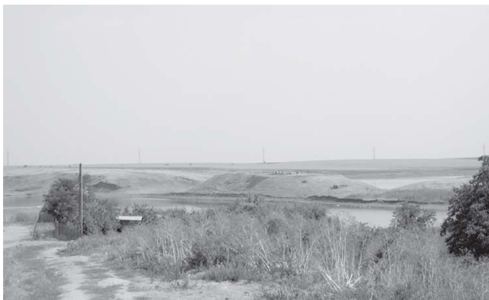
Plansa 1. Așezarea eneolitică de la Mariuța. Vedere generală.