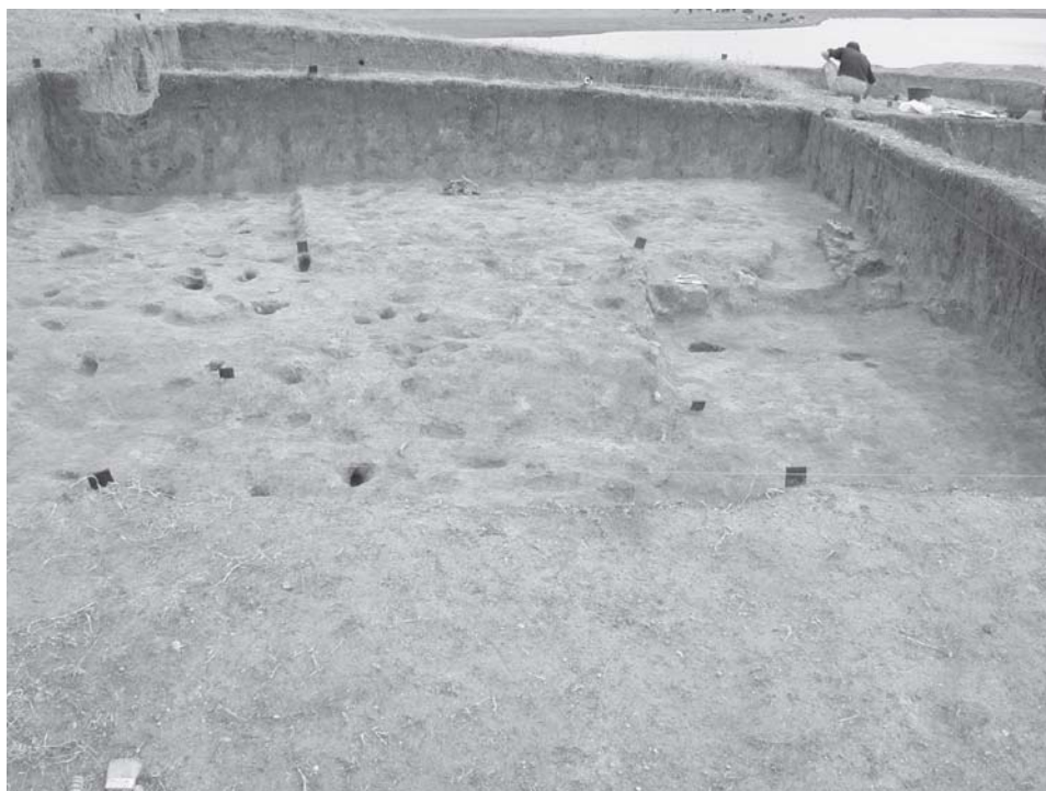
Plansa 2. L1/2001 – aspecte de sapatură.