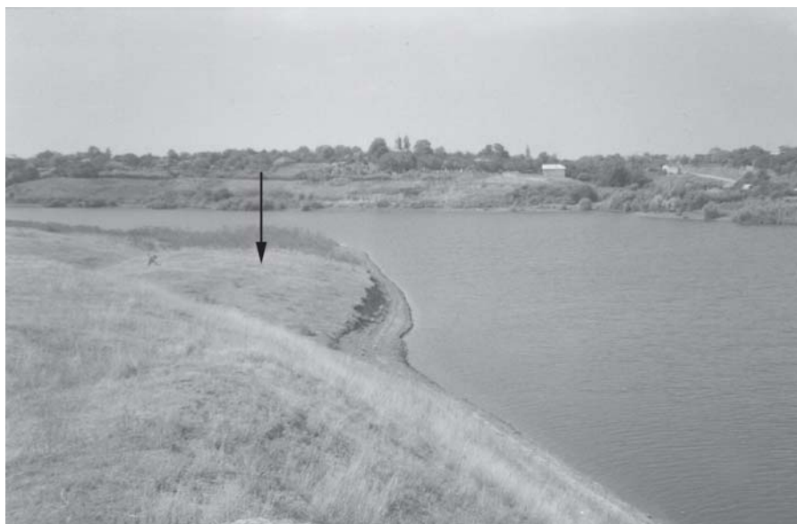
Planșa 6. Măriuța. Punctul “Movila mică” .