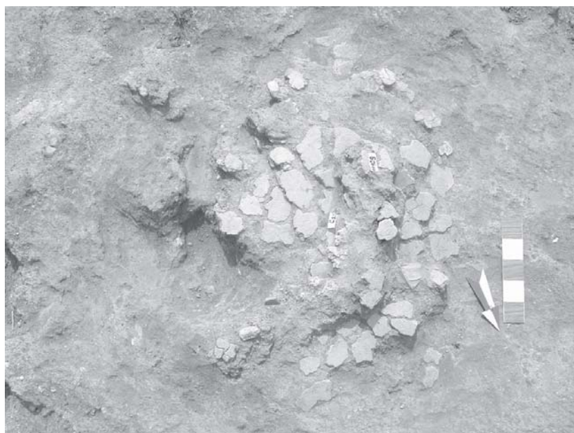
Planșa 4. C2 – vatra din prima cameră a L2/2001.