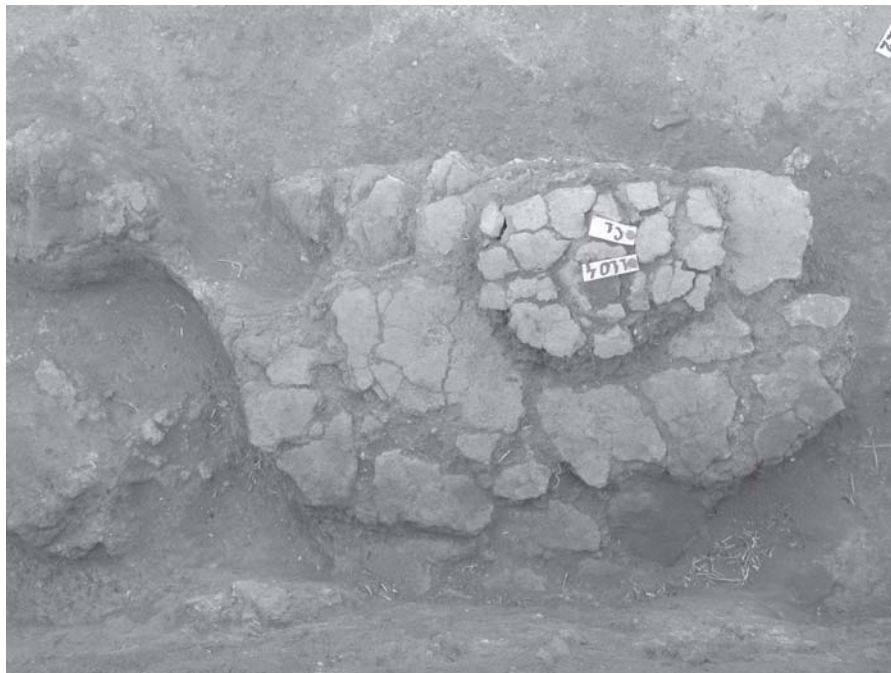
Planșa 5. C3 - vatra din cea de-a doua cameră a L2/2001