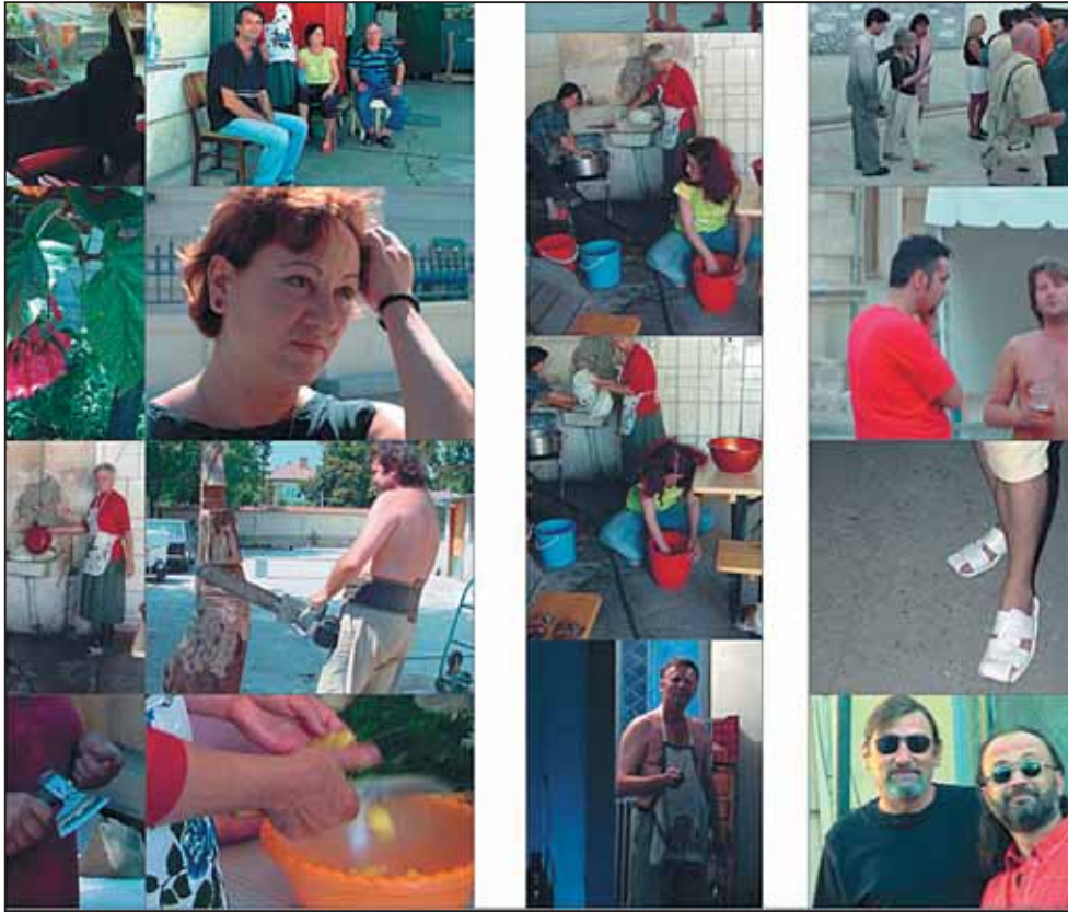
Colaj din tabăra de creație