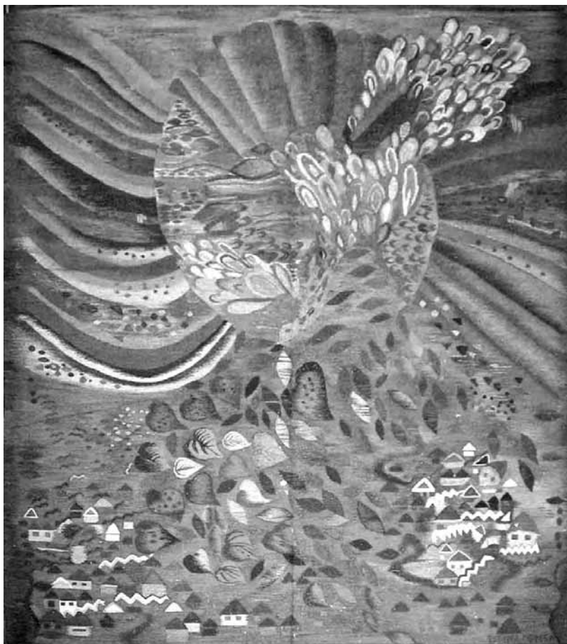
Toamna 220x191 cm, tapiserie, inv. 47 622