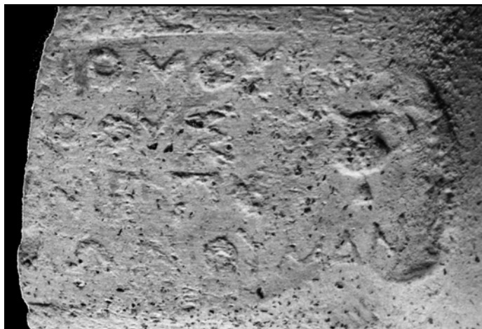
Рис. 7. Клеймо агоранома Пасихара, сына Фэниппа.