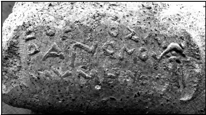
Рис. 2. Клеймо агоранома Бория.