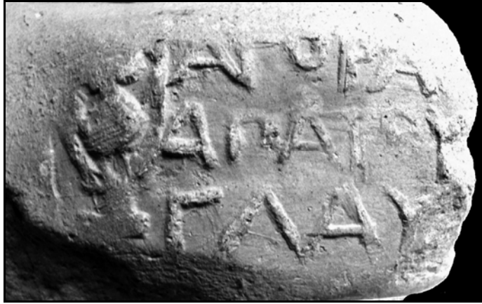
Рис. 1 . Клеймо агоранома Апатурия.