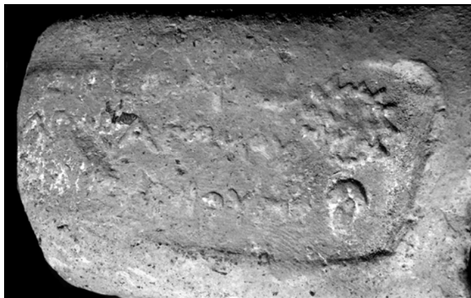
Рис. 6. Клеймо агоранома Феупейта.