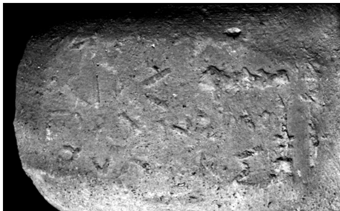
Рис. 4. Клеймо агоранома Зопириона, сына Посия.