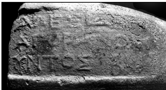
Рис. 8. Клеймо агоранома Алексида.