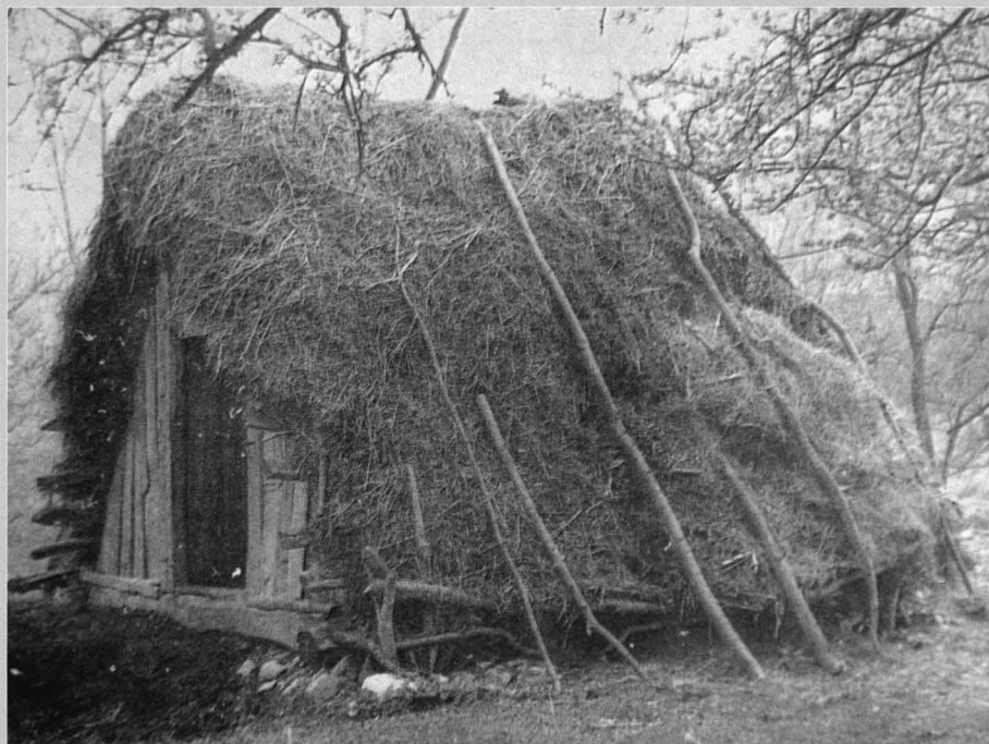
Fig. 9 Palancă sau căpreață – o anexă de gospodărie tipică pentru satele din Nordul Mehedințiului. Este vizibilă structura de lemn, șarpanta rudimentară în 2 ape, cu acces pe ușă din blăni și învelitoarea realizată din material vegetal - în general se utiliza feriga

Flocks, in variable numbers, of sheep and goats grazing in areas with grass resources from the limestone relief of the high plateau. Areas of valley landscapes with abundant flora, extremely important for animal husbandry.