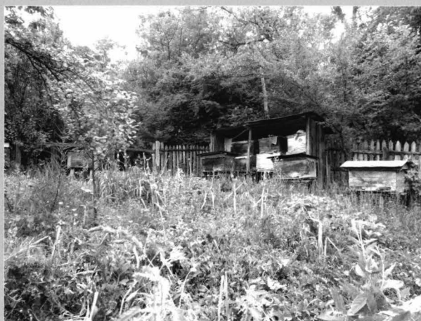
Fig. 5-6 Loturi legumicole dispersate printre culturile pomicole. În fundal se pot observa sisteme specifice de împrejmuire a grădinii /proprietății cu garduri de stobori de salcâm

Vegetable plots scattered among orchards. In the background, one can see the garden fencing system specific with fences made of „stobori” of acacia