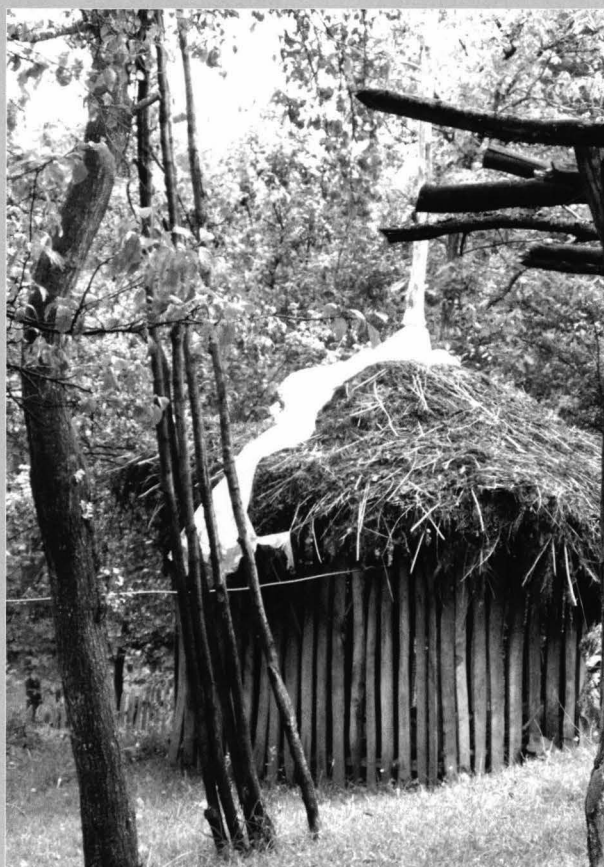
Fig. 12 Pătuleag închis. Această construcție se identifică în perimetrul gospodăriilor și conacelor din munte, reprezentând o formă eficientă de păstrare a nutrețurilor dar și de adăpostire a inventarului agricol.

Closed „pătuleag”. These building is found within the homestead and mountain household annexes, representing an effective type of storage of forage and tools.