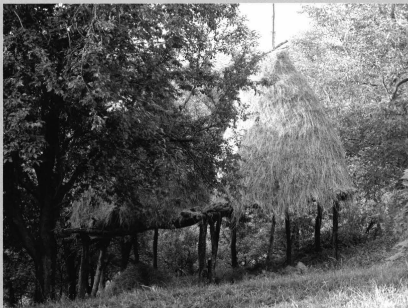
Fig. 11 Pătuiag sau pătuleag deschis . Această construcție se identifică în perimetrul gospodăriilor și conacelor din munte, reprezentând o formă eficientă de păstrare a nutrețurilor dar și de adăpostire a inventarului agricol.

Field „conac” - type of temporary housing, the organization of agricultural activity and livestock, with essential role in the economy of the mountain villages in Mehedinți. It notes the constructive structure and the acces by „șatră” or „aplecătoare” – longitudinal space in the rear wall, for sheltering animals.