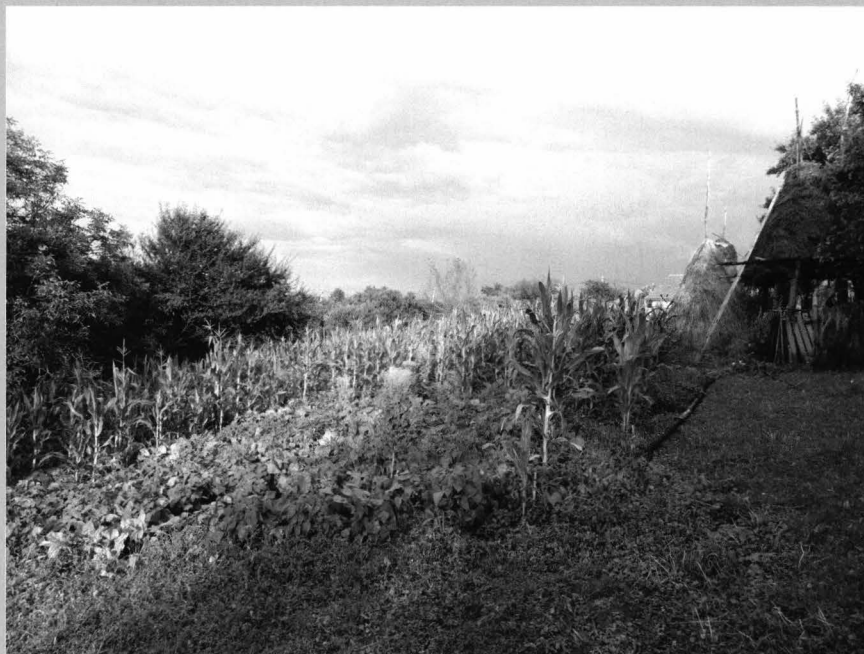
Fig. 3 Culturi agricole și legumicole pe suprafețe restrânse din perimetrul gospodăriei. Imaginea relevă prezența culturii porumbului, indispensabil hranei animalelor și oamenilor, acesta fiind și sursă de nutrețuri depozitate în clăi de coceni, pătulege și fânare

Crops on small areas within the perimeter of the homestead. The image reveals the the presence of corn crop, indispensable food for animals and humans, which is the source of forage stored in stacks of stalk, „pătluge” and hay barns