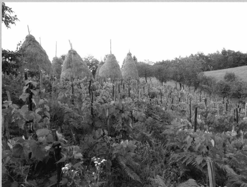
Fig. 7 Organizarea terenului extravilan - imaginea este relevantă pentru modul de valorificare a potențialului economic al terenului după cum urmează: parcele de viticultură, „curele” de livadă și zonă de fânează. De menționat că un asemenea teren se identifică în contextul economic descris de existența unui conac.

Vegetable plots scattered among orchards. In the background, one can see the garden fencing system specific with fences made of „stobori” of acacia