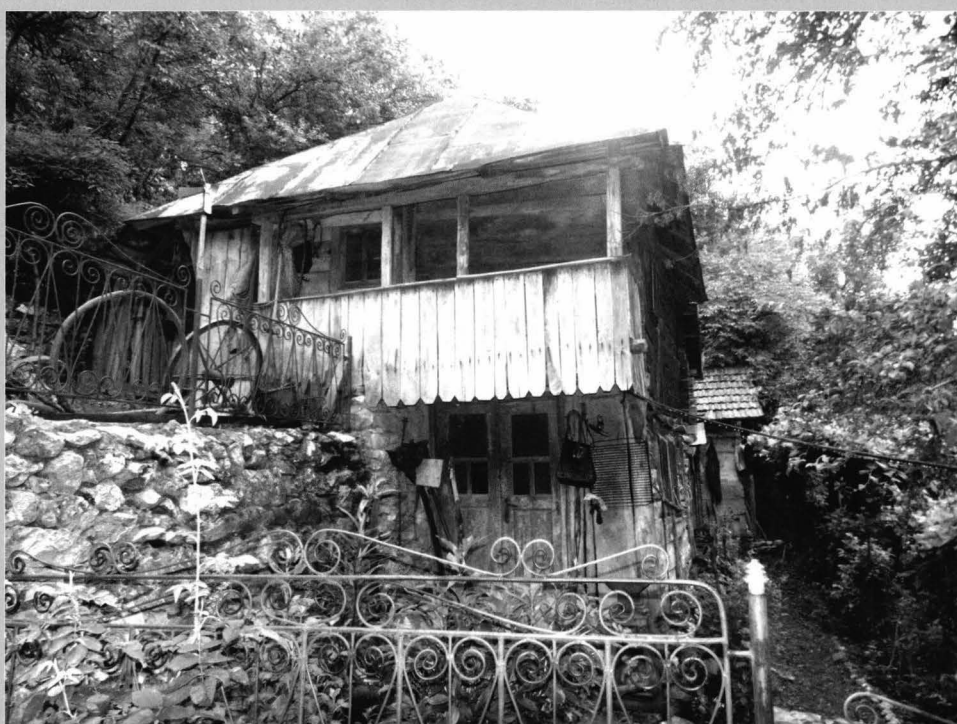
Fig. 13 Pimniță din comuna Ponoarele, cu o structură arhitectonică pe 2 nivele, realizată din lemn de fag și acoperită inițial cu șindrilă din același material. Această tipologie de pimniță aproape că a dispărut din configurația gospodăriei din podișul Mehedișului.

Closed „pătuleag”. These building is found within the homestead and mountain household annexes, representing an effective type of storage of forage and tools.