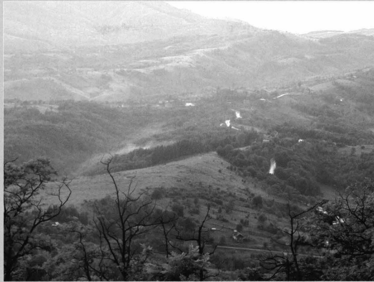
Platoul Mehedinți