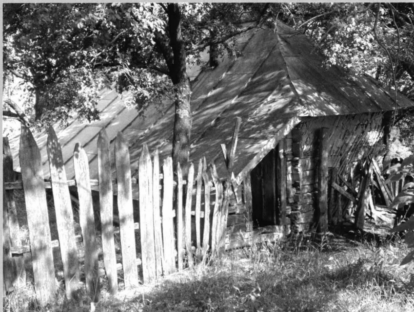
Fig. 10 Conacul de plai – formă de locuire sezonieră, de organizare a activității agricole și de creștere a animalelor, cu rol esențială în economia satelor de munte din Mehedinți. Se observă structura constructivă și accesul în șatră sau aplecătoare - spațiul longitudinal din zona peretelui spate cu rolul de adăpostire a animalelor.

Field „conac” - type of temporary housing, the organization of agricultural activity and livestock, with essential role in the economy of the mountain villages in Mehedinți. It notes the constructive structure and the acces by „șatră” or „aplecătoare” – longitudinal space in the rear wall, for sheltering animals.