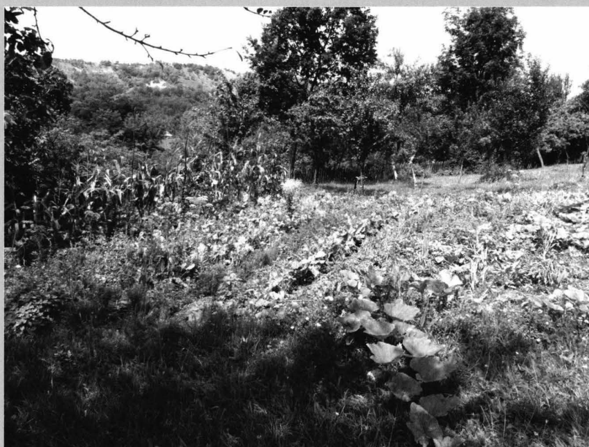
Fig. 4 Livezi și loturi parcelate pentru plante legumicole, amplasate în grădina din raza gospodăriei, pe terenuri de pantă cu deschidere solară (sursa: arhiva foto personală, fotografie realizată în anul 2014)

Crops on small areas within the perimeter of the homestead. The image reveals the the presence of corn crop, indispensable food for animals and humans, which is the source of forage stored in stacks of stalk, „pătluge” and hay barns (source: personal photo archive, photo taken in 2014)