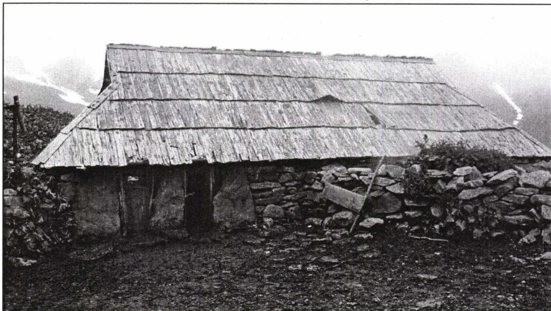
Stâna și strunga din piatră Stone sheep - fold

În proiectul tematic al Muzeului Tehnicii Populare din 1962, un loc important în structura sectorului alimentar l-a ocupat grupa tematică a creșterii vitelor și păștoritului . Importanța acordată acestei grupe tematice se datorează faptului că, „păștoritul la români a constituit multă vreme obiect de studiu pentru istorici, care au demonstrat vechimea ocupației, pentru lingviști, ale căror cercetări au arătat că majoritatea terminologiei păștoritului în limba română își are originea în limba latină, pentru sociologi și etnografi, ale căror studii au relevat că în cadrul păștoritului s-au păstrat, până în zilele noastre numeroase elemente arhaice în sistemele de creștere a animalelor, în arhitectura pastorală, în instrumentarul și tehnicile de prelucrare a produselor specifice, în formele de organizare socială” 1 .