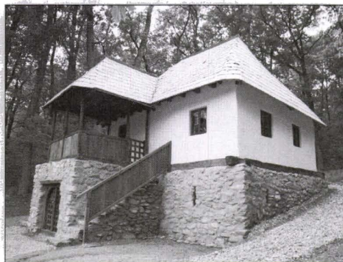
Casa tip culă, Vlădești, județul Vâlcea