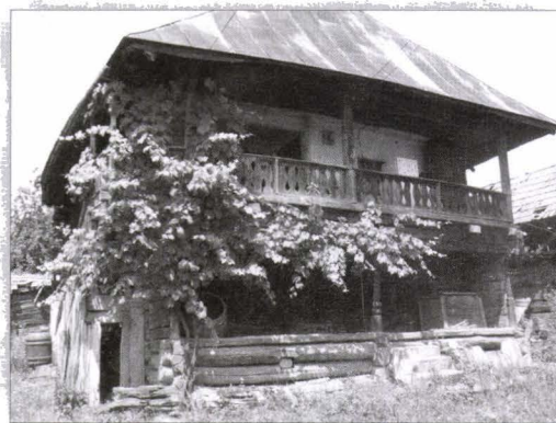
Casă (in situ), Bălănești, județul Gorj