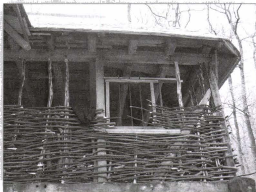
Detalii de construcție a pereților casei, Vlădești, județul Vâlcea