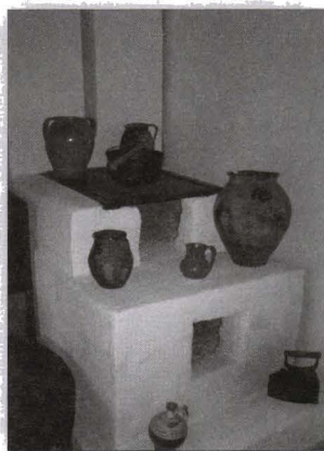
Cuptoare, Vlădești, județul Vâlcea