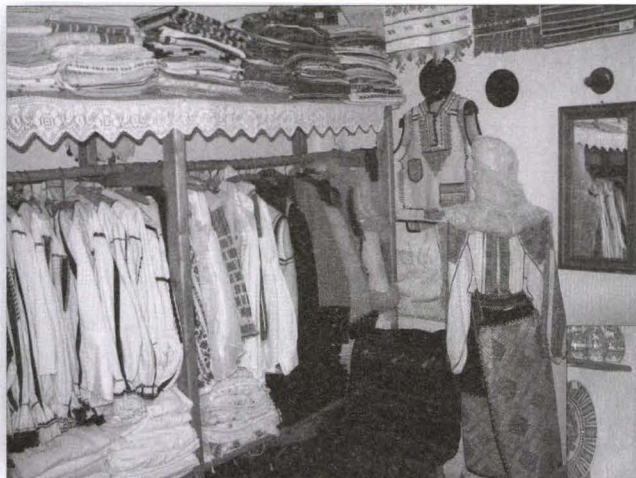
Galeriile de Artă Populară