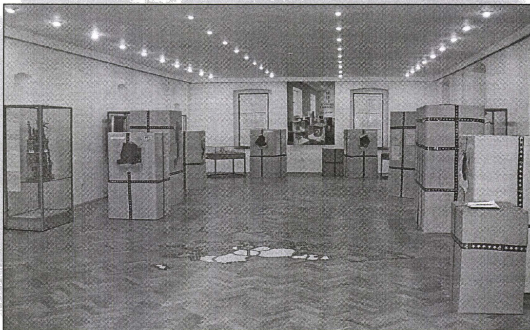
Aspecte din expoziția temporară 15+10+2 Identități Europene