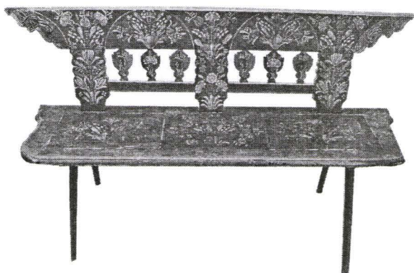
Bancă cu spetează, Nr. inv. 844 L Bench with Back

Banca cu spetează 11 completa ansamblul patului de paradă. Piesa cu nr. de inventar 844 L aparținând colecției Muzeului „Emil Sigerus” ne atrage atenția prin bogăția sa ornamentală, spătarul prezentând o decorare prin traforare și pictare a motivelor florale stilizate și fitomorfe (pomul vieții). Pe spatele spătarului prin pictare apare inscripționat „ANNO 1876” și inițialele M.B.