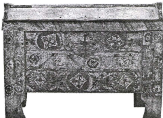
Ladă transilvăneană cu capac tip sarcofag, Nr. inv. 1853 L Transylvanian Carpentry Trunk with Sarcophagus like Lid

O piesă răspândită în toate colecțiile muzeale este lada de zestre 7 care, pe lângă rosturile sale funcționale, de păstrare a zestre, oferea și un prilej de etalare a calităților artistice decorative realizate pe suprafața pictată. Locul lăzii de zestre era bine definit în interiorul locuinței săsești, fiind dispusă între soba de cahle și patul de paradă, completând astfel bogăția ornamentală a textilelor și hainelor de sărbătoare. De cele mai multe ori în interiorul capacului este inscripționat numele proprietarului și anul în care a fost confecționată lada.