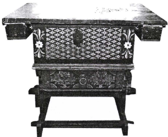
Masă, Nr. inv. 841 L Table

Colțul cu masa era completat de cele patru scaune cu spătar . În general acestea prezintă un profil ușor curbat în partea terminală, un decupaj cu profil funcțional, cu laterale simetrice, traforate precum și decor pictural dispus central pe spătar.