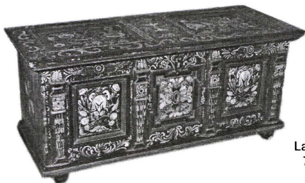
Ladă pictată săsească, Nr. inv. 2741 L Transylvanian Saxon Painted Trunk

Printre lăzile de zestre, bogat ornamentate ale colecției se remarcă exemplarul cu numărul de inventar 2741 L, de factură renașcentistă, cu decor pictural ce încântă privirea oricărui iubitor de artă, constând în pilaștri, acant, rozeta, rodia și solzi de pește.