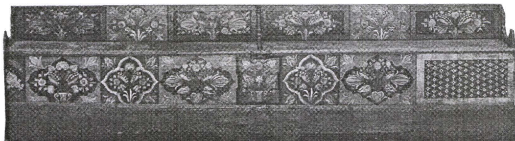
Laviță, Nr. inv. 829 L Transylvanian Saxon Bench

O piesă de mobilier cu mai multe utilități este lavița 12 folosită atât pentru odihnă și dormit cât și pentru depozitare. Trebuie evidențiat faptul că există o diferență între această piesă și lada de zestre. Lavița mult mai lungă decât lada, ajungând între 2 și 3 m își păstrează funcția de depozitare ca și în cazul lăzii de zestre fiind compartimentată și prevăzută cu capac. Piesa cu numărul de inventar 829 L reprezintă exponatul cel mai reprezentativ, având un repertoriu ornamental traforat și pictat cu motive florale încadrate în registre casetate.