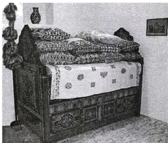
Pat de paradă, Nr. inv. 1305 L The "Show Off" Bed

Patul de paradă 10 , plasat în colțul din stânga al camerei bune este piesa cea mai spectaculoasă, datorită înălțimii de 1,55 m și lungimii de 1,90 m, precum și a rolului decorativ pe care îl ocupă ansamblul textil compus din 8-12 perne și cuvertură brodată. Căpătăiele de pat și lada extensibilă prezintă o adevărată bogăție ornamentală. Din această categorie muzeul deține șapte astfel de ansambluri deosebită fiind piesa cu număr de inventar 1305 L.