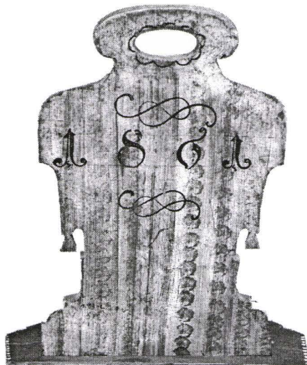
Spătar scaun, 1861, Nr. inv. 837 Back chair, 1861

1. Ladă transilvăneană cu capac tip sarcofag Nr. inv. 1853 L