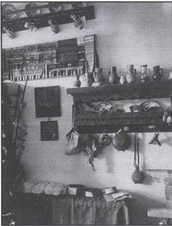
1905. Muzeul Asociațiunii. Secțiunea etnografică. Piese populare din Valea Giurgeului