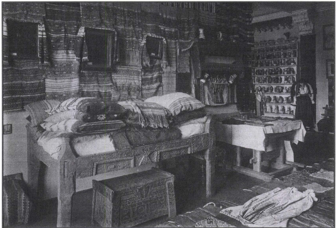
1905. Muzeul Asociațiunii. Secțiunea etnografică. Piese populare din Săliște și împrejurimi