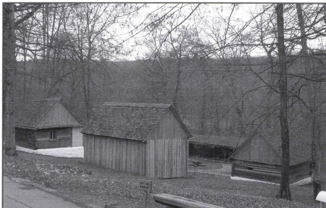
Gospodăria de jogărar din Gura Râului – în muzeu Homestead with sawmill from Gura Râului – inside the museum