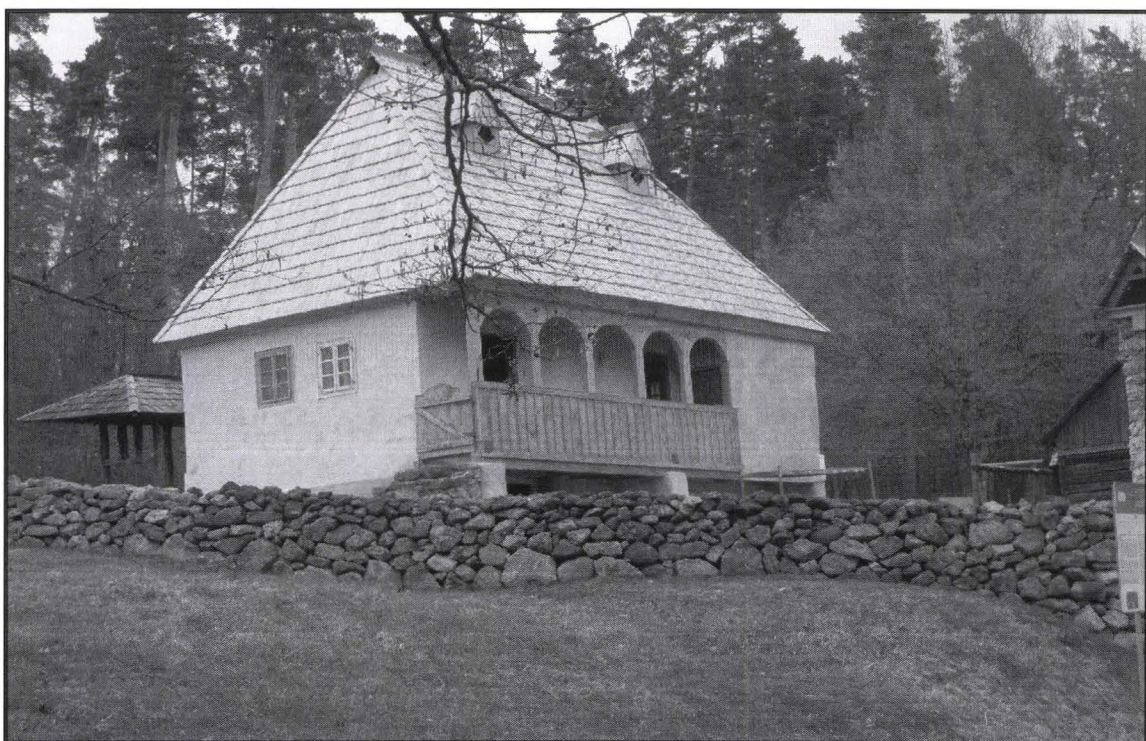
Gospodăria de miner aurar din Corna – reconstruită în muzeu Homestead of a gold ore miner from Corna – rebuilt within the museum