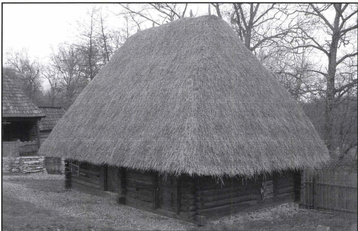
Gospodăria de miner marmurar din Alun – în muzeu Marble miner's homestead from Alun – inside the museum