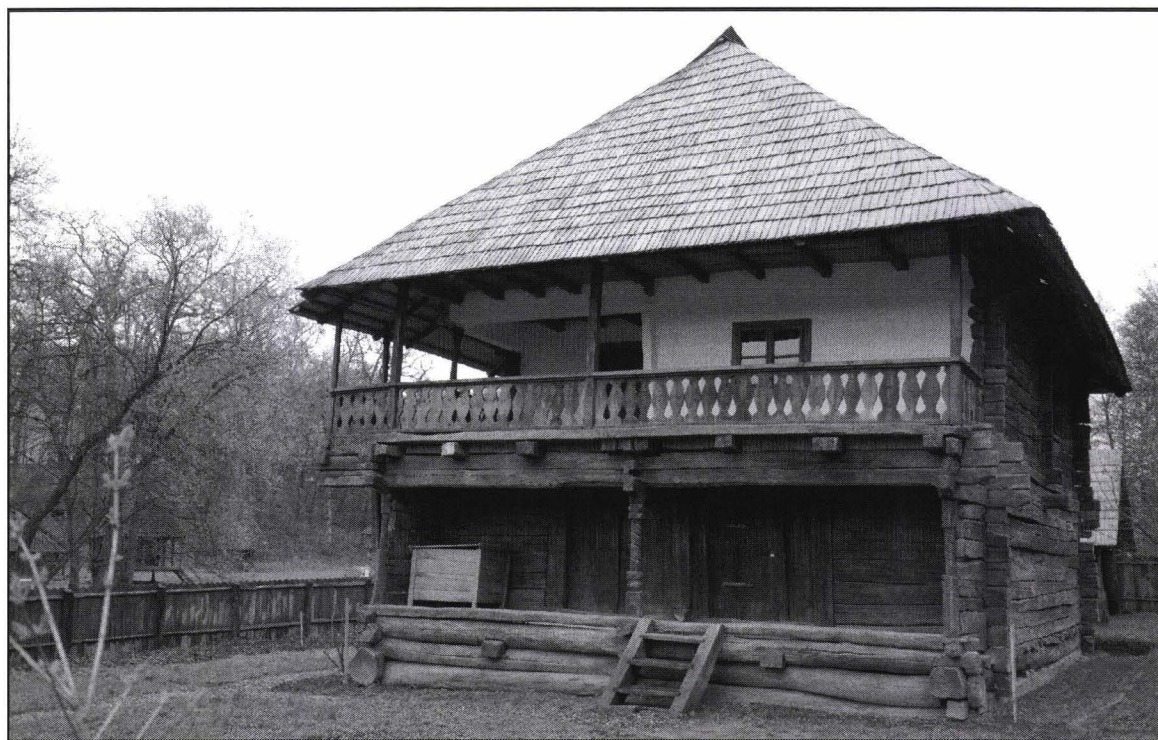
Gospodăria de pomicultor din Bălănești – în muzeu Orchard homestead from Bălănești – inside the museum