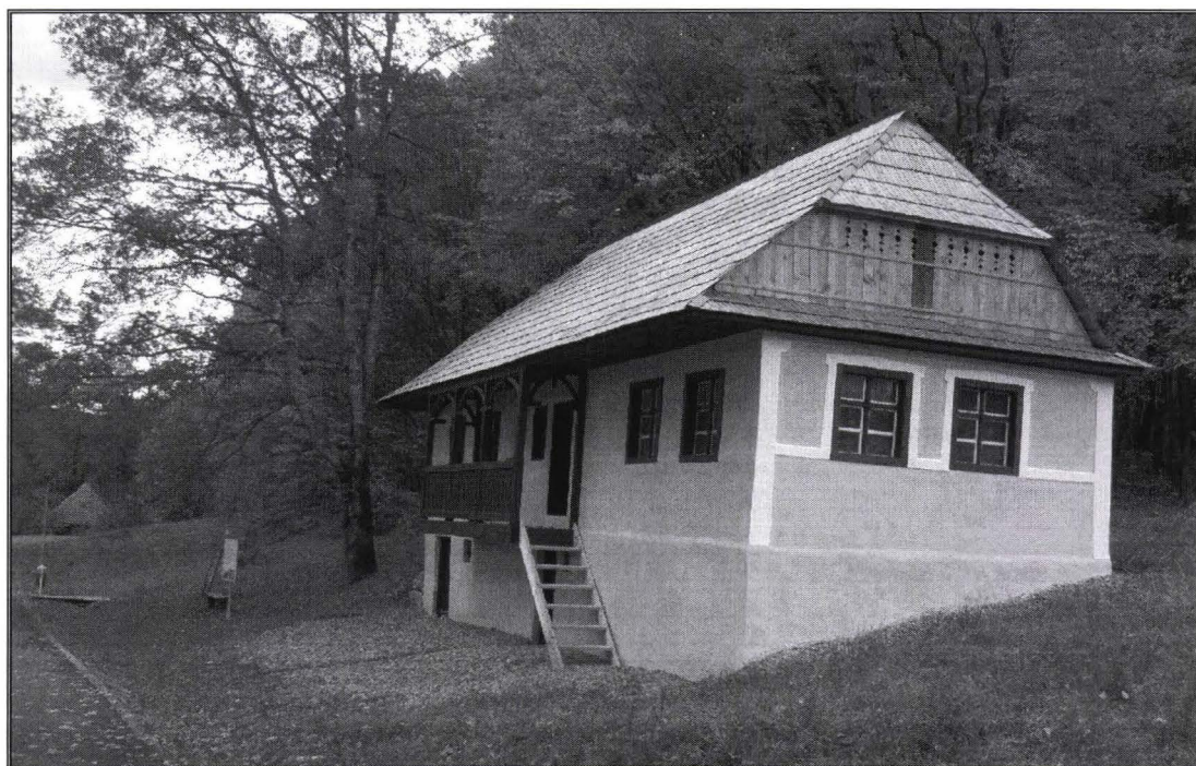
Casa din Șcheii Brașovului – reconstruită în muzeu The house from Șcheii Brașovului – rebuilt within the museum