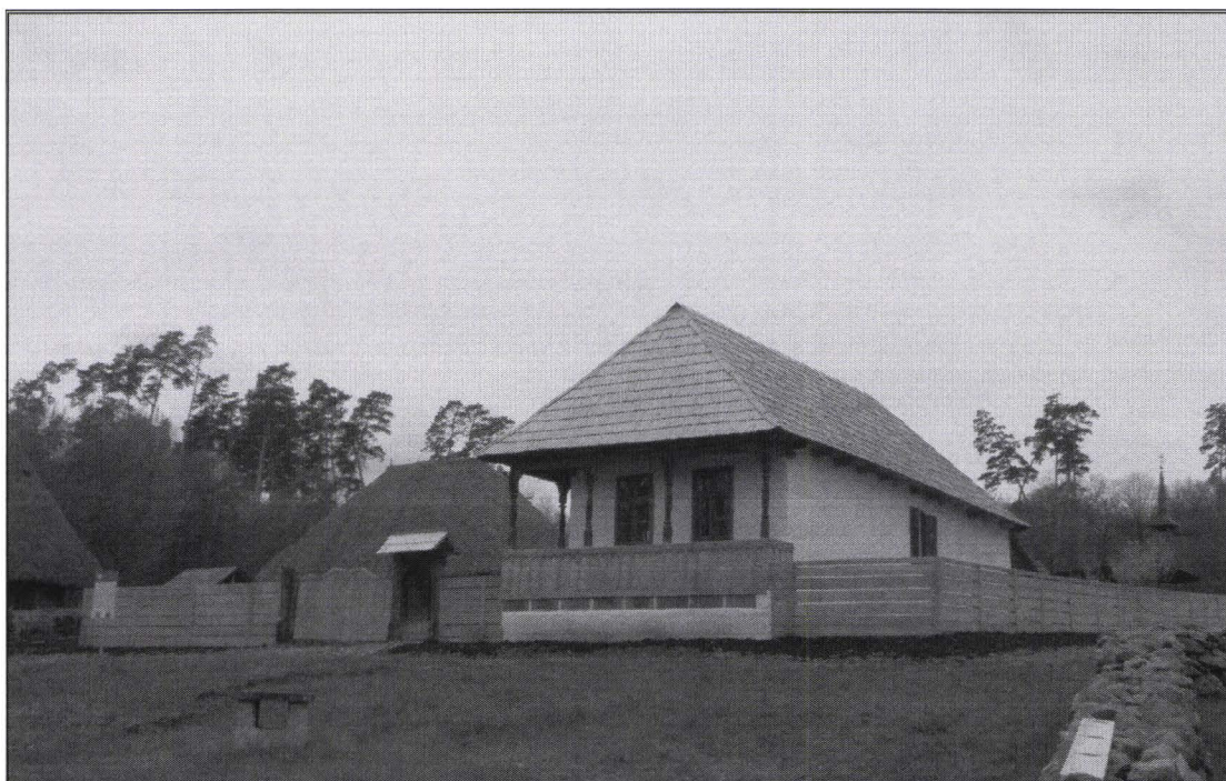
Gospodăria de miner sărar din Sărățeni – reconstruită în muzeu Homestead of a salt miner from Sărățeni – rebuilt within the museum