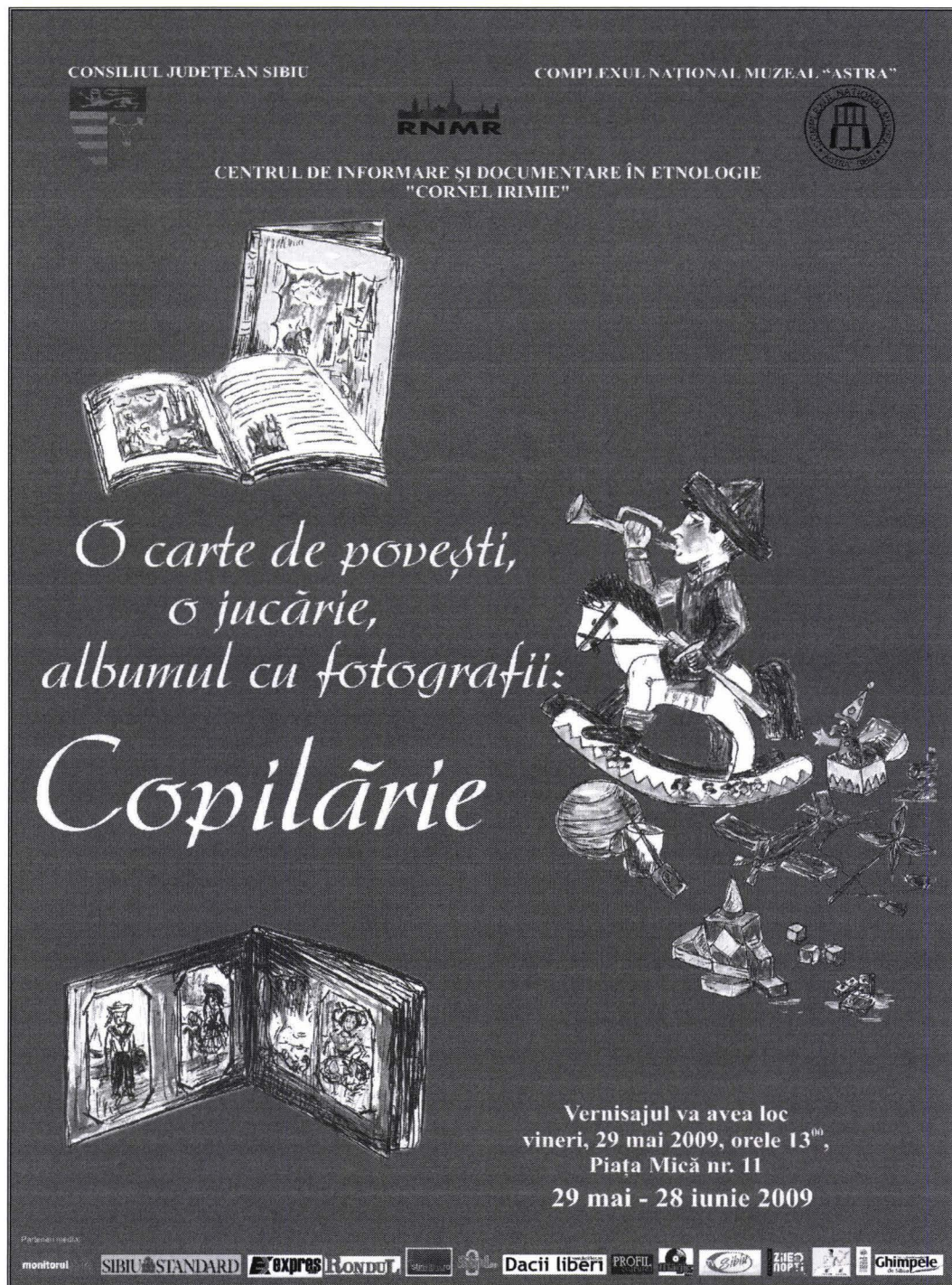
Afișul / Poster

„pentru că sunt mult mai frumoase”, chiar au întrebat dacă nu se pot cumpăra cele expuse. Vernisajul s-a bucurat de o reprezentare de poezii și cântece datorată grădiniței nr. 41. Educatoarele care au onorat invitația și-au exprimat dorința acestei performanțe, cei mici s-au simțit în largul lor în sala expoziției, încântați să participe și ei la eveniment. Orele de pedagogie muzeală din toată această perioadă au avut un plus de farmec, completate cu vizitarea expoziției. Și pentru vizitatori și pentru realizatori s-a dovedit o experiență deosebită, reușită.