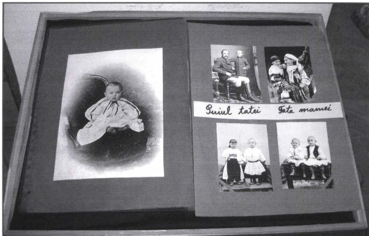
Album cu fotografii / A photo album