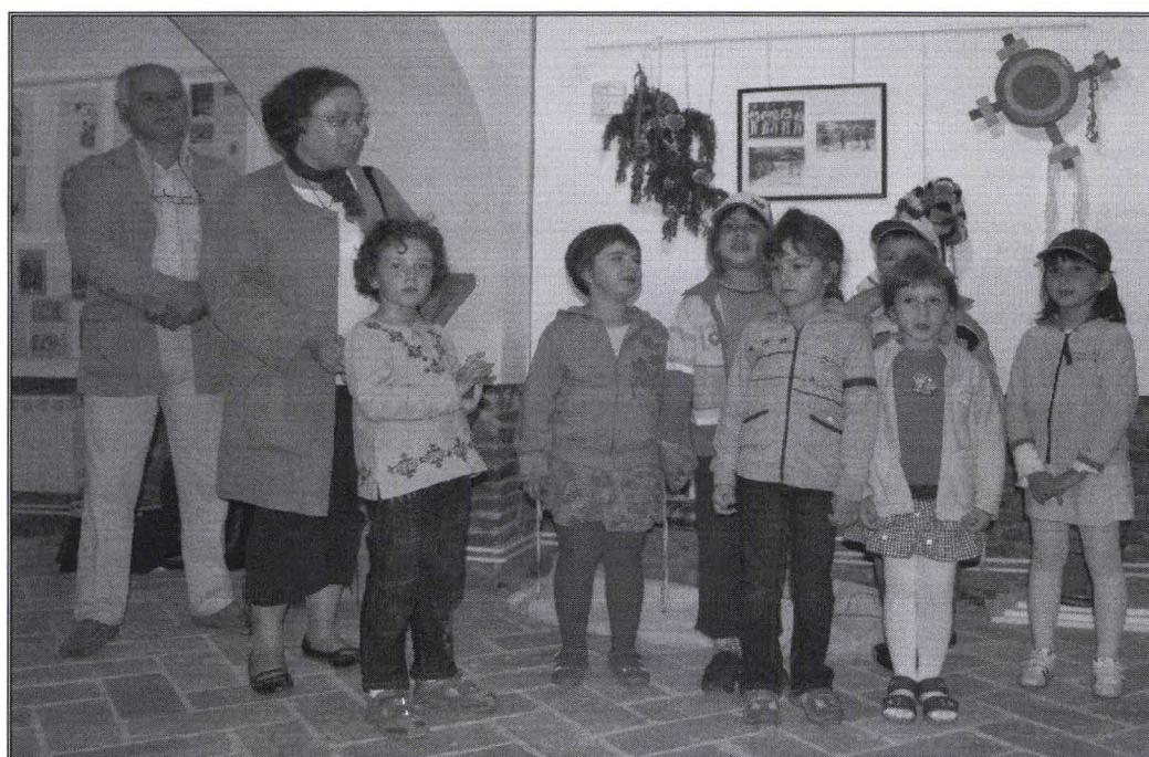
Copii recitând la vernisaj / Children performing at the vernishing day