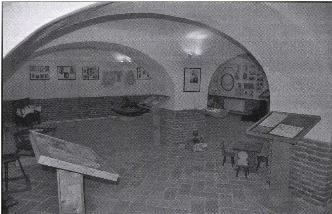
Aspect din expoziție / An aspect from the exhibition