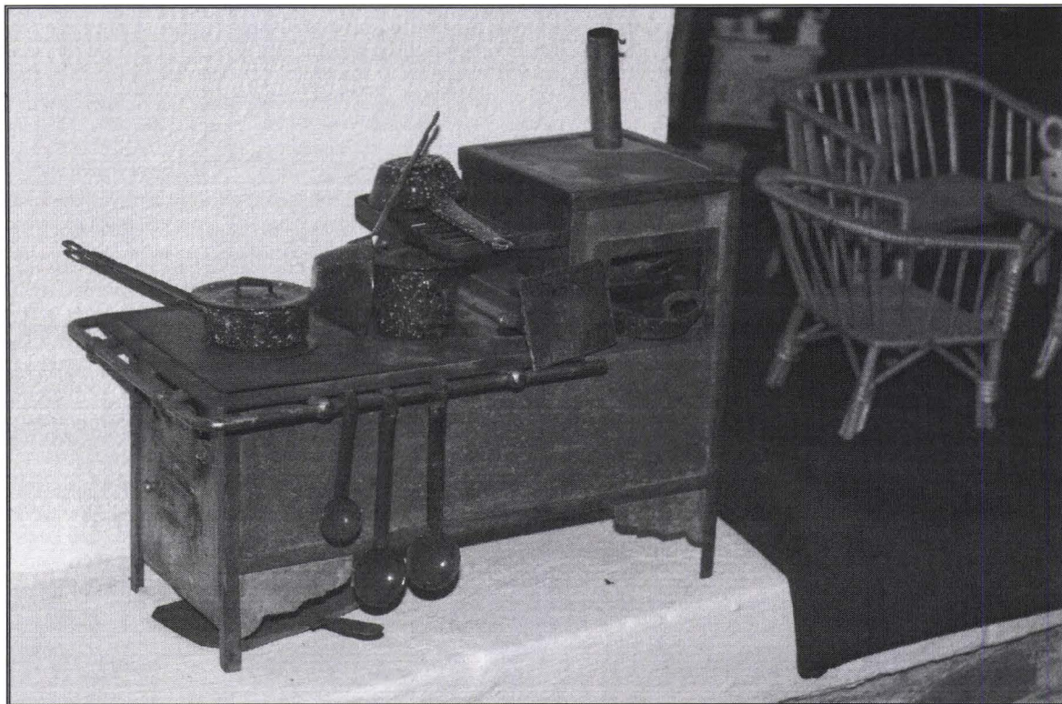
Jucării / Toys