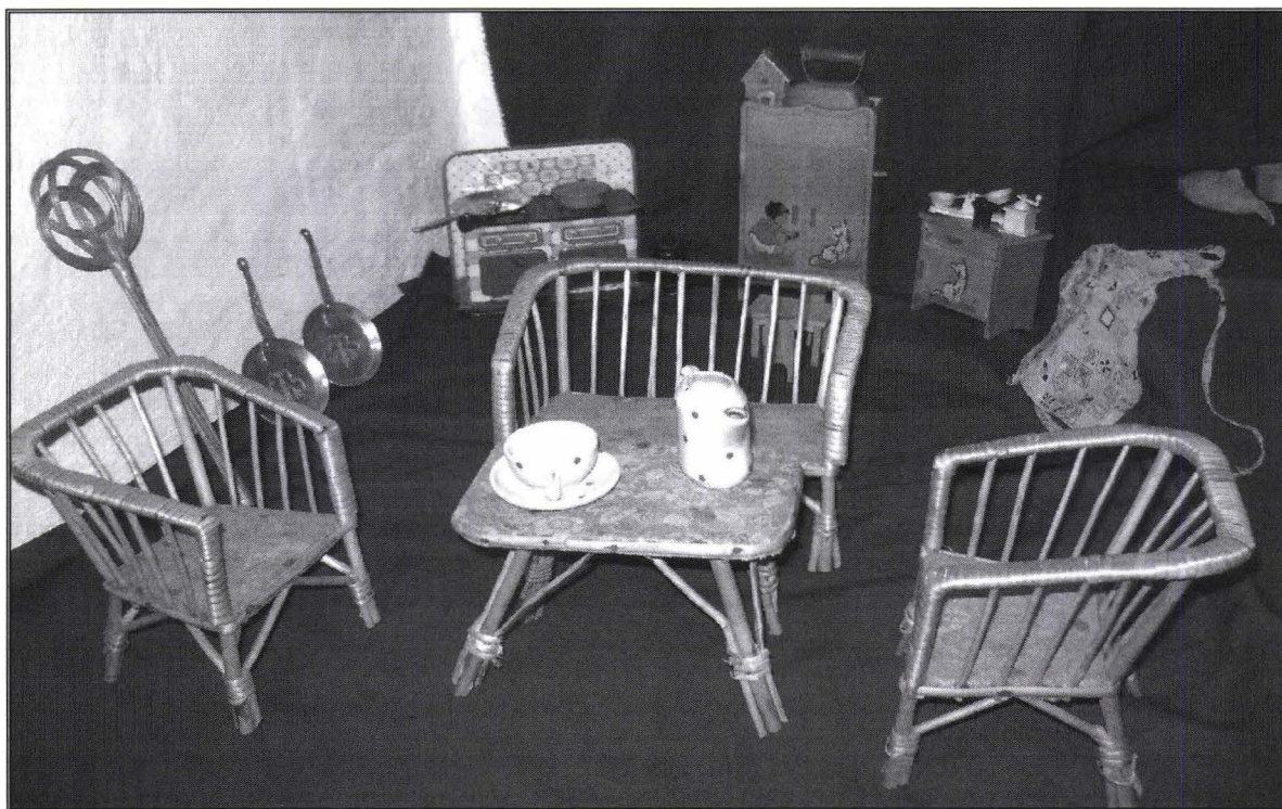
Jucării / Toys