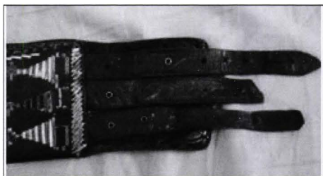
Detaliu după restaurare