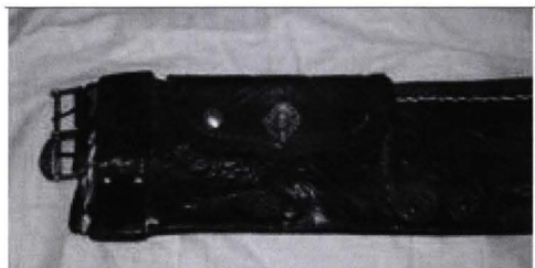
Detaliu după restaurare