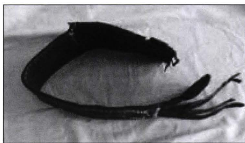
Ansamblu înainte de restaurare