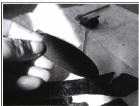
Detaliu în timpul restaurării