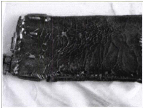
Detaliu înainte de restaurare