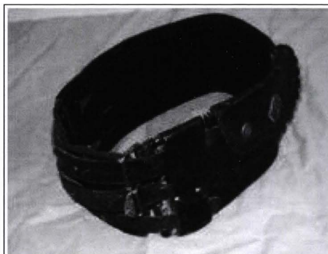
Ansamblu după restaurare