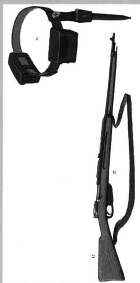
Figura 5 - Centura cu 2 cartușiere a câte 40 cartușe fiecare și pușca cu repetiție Mannlicher model 1893, folosite de armată și de jandarmii din România

Figure 5 - Belt with 2 pockets with 40 bullets each and the bolt action rifle with repetition Mannlicher model 1893, used by the army and gendarmerie, in Romania