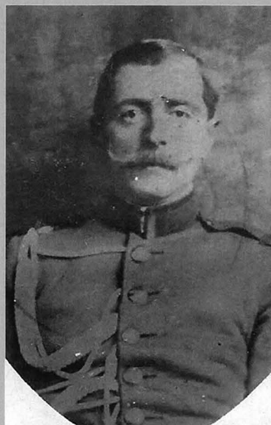
Figura 3 - Grad inferior (jandarm, caporal, sergent sau sergent major), jandarmeria rurală din România, uniformă model 1893