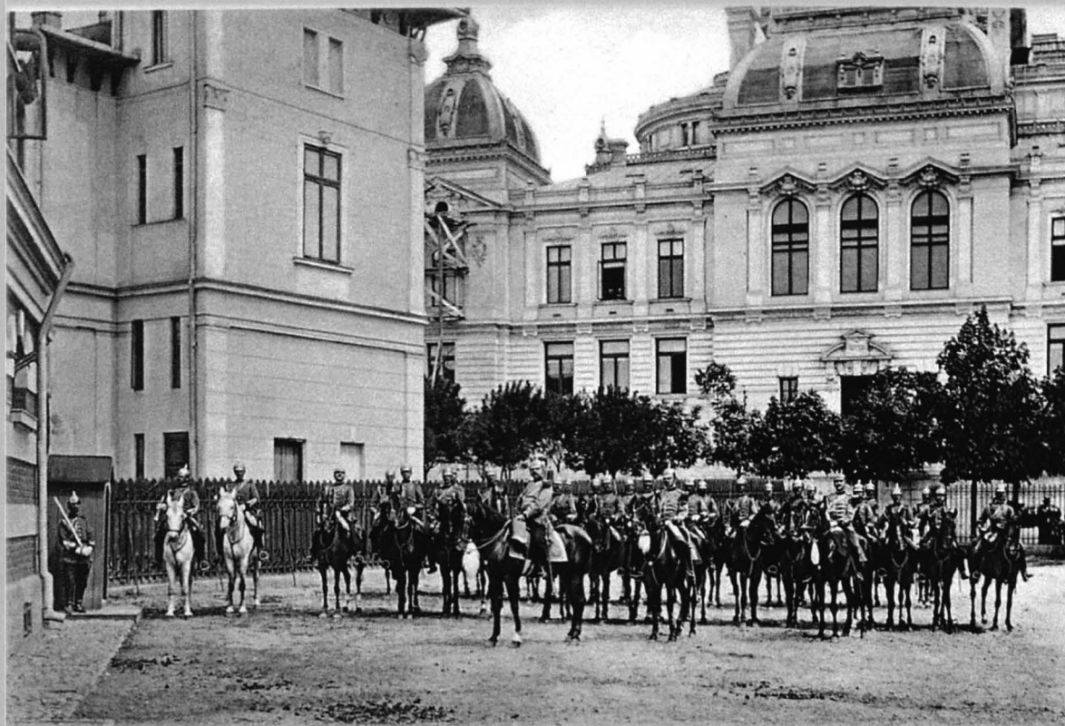
Figura 10 - Imaginea de sus: ofițeri, în cea de jos ofițeri și reangajați din jandarmeria rurală, în ținute de ceremonie model 1893, fotografie din capitala țării, București, anul 1902