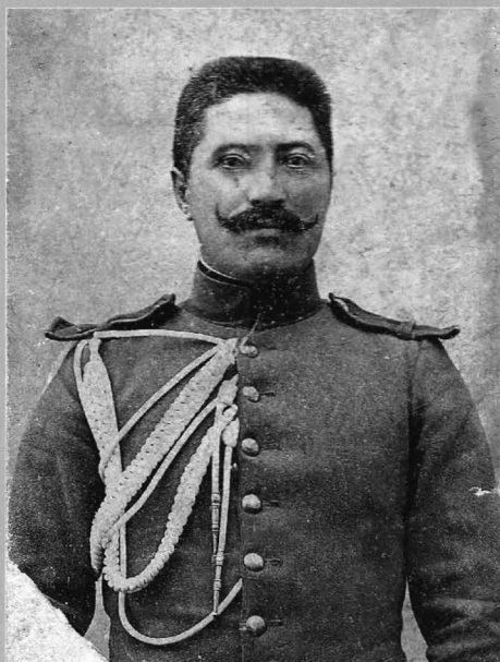
Figura 2 - Grad inferior (jandarm, caporal, sergent sau sergent major), jandarmeria rurală din România, uniformă model 1893

Figure 2 - Lower rank (gendarme, corporal, sergeant or sergeant major), rural gendarm from Romania, uniform model 1893