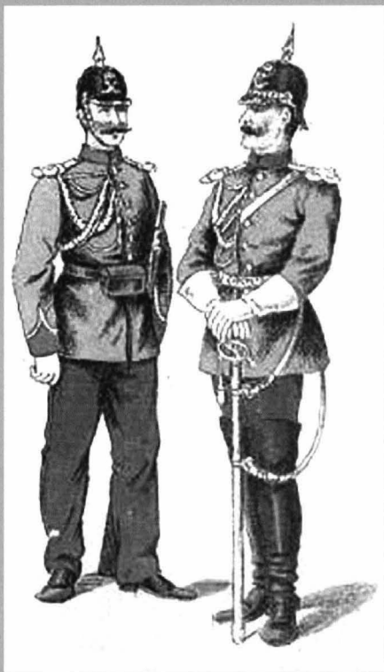
Figura 11 - Sergenți de jandarmi rurali din România, ținuta de ceremonie (cel din dreapta este jandarm rural călare) model 1893

Figura 11 - Sergeants from Romania rural gendarmerie ceremony dress (the right one is mounted rural gendarm) model 1893