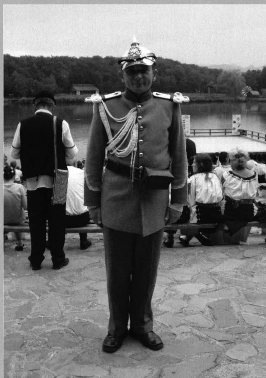
Figura 12 - Replică după uniforma de sergent de jandarmi rurali, model 1893, ținuta de ceremonie Figura 12 - Reply of the rural gendarmerie uniform, sergeant rank, model 1893, parade dress (foto Muzeul ASTRA).

(sursa: ***, Uniformul del Armatul de Romanie , Vinkmuizen Collection, Draper Fund, f. e., f. a., f. l., p. 96).