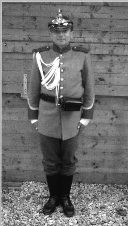
Figura 9 - Replică după uniforma de sergent de jandarmi rurali, model 1893, ținuta de serviciu

(sursa: Carte poștală datată 1912 pe verso, cu legenda „Armata Română. Jandarmi rurali”).