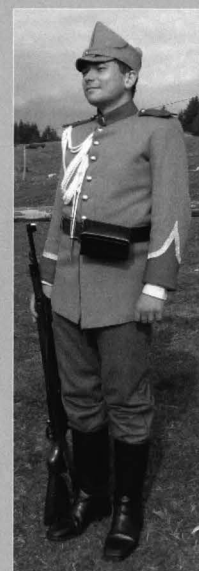
Figura 6 - Replică după uniforma de sergent de jandarmi rurali, model 1893, ținuta zilnică cu replică după pușca Mannlicher model 1893