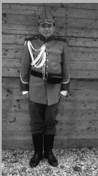
Figura 4 - Replică după uniforma de sergent de jandarmi rurali, model 1893, ținuta zilnică

(sursa: fotografie din colecția personală a autorului).