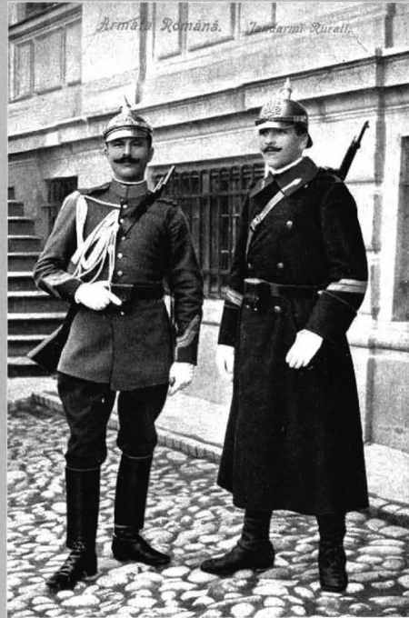
Figura 8 - Caporali de jandarmi rurali din România în uniforme model 1893, ținuta de serviciu (cel din stânga în tunică, cel din dreapta în manta)