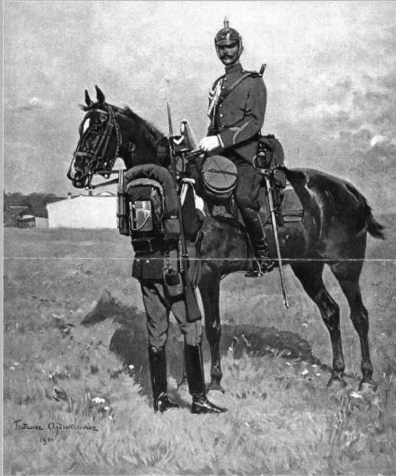
Figura 7 - Sergent de jandarmi rurali călare, ținuta de serviciu model 1893 și jandarm pedestru (din orașe), ținuta de campanie model 1895, pictură datată 1901

Figure 7 - Sergeant of mounted rural gendarm, service dress model 1893 and pedestrian gendarm (from the towns), field dress model 1895, painting dated 1901