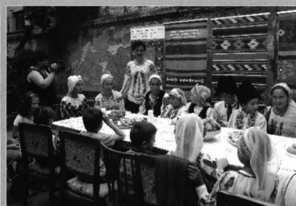
Școala de vară, iulie 2014 – Șezătoarea Sumemr school, July 2014 – The sewing bee

Cunoscând din experiențele anterioare că pedagogizarea excesivă periclitează acțiunile cu specific etnografic, inițiem un proiect educațional în care parteneri vor fi două școli, una din mediul urban (Școala cu clasele I -VIII Alice Voinescu din Drobeta Turnu Severin), cealaltă din mediul rural, Școala cu clasele I-VIII din satul Balta, proiect ale cărui acțiuni vor fi gândite independent de contextul strict școlar, implicit a rigurozității pedagogiei școlare. Considerăm că acestea vor contribui la maximizarea dimensiunii educative și vor favoriza dezvoltarea unor sentimente pozitive față de obiectul de patrimoniu și de lumea înconjurătoare. Continuăm tema Satul mehedințean văzut prin ochii copilului ca investigând subiecții să obținem de data aceasta două puncte de vedere. Ca acțiunile să aibă forță educativă vom valoriza în manieră didactică exponate din colecțiile secției de Etnografie și Artă Populară - descriere, reproducere în creion, reproducere în cazul pieselor ușor de realizat (cusături, traforaj etc) astfel încât să obținem concluzia pe care altfel, într-un tur ghidat, muzeograful o transmite, și anume dificultatea, ingeniozitatea și de foarte multe ori bunul gust cu care obiectele, cu valoare decorativă sau utilitară au fost lucrate. Cu turul ghidat interactiv în Muzeul Hidrocentralei scontăm pe incitarea curiozității și dorința descoperirii unei lumi necunoscute de către copilul secolului XXI.