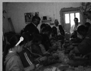
Imagini din timpul activităților subsumate proiectului Satul tradițional mehedințean văzut prin ochii copilului Images during the activities of the project Mehedinți traditional village seen through the eyes of the child

Una dintre acțiunile Scolii de vară 2014, Șezătoarea , ai cărei actanți au fost elevii școlilor din comuna Balta - Mehedinți, au pus față în față două tipuri de grupe de copii, copiii care trăiesc și cresc la sat și copiii care locuiesc în oraș. Primele observații au fost asupra diferențelor în modul de viață al fiecărui grup, în timp ce pentru copilul de la sat fiecare etapă a manifestării era parcursă cu un firesc natural, copilul de la oraș, exponentul omului modern, devine tot mai surprins de frumusețea, veselia, vitalitatea și îndemânarea pe care le dovedește celălalt. Dispare astfel ideea că satul înseamnă primitivul, că este sub nivelul unei bune condiții umane și din momentul acela timpul petrecut împreună de cele două categorii de copii devine insuficient pentru multele curiozități trezite în timpul întâlnirii.