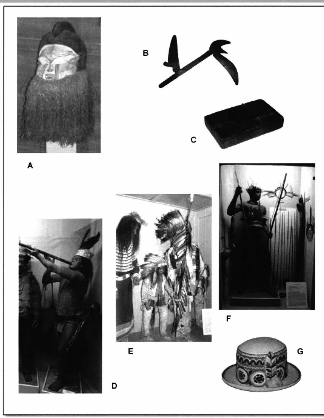
Fig. 2 A, Mască ritualică Bakota, Congo, donația W. A. Engel; B, Cuțit de aruncat, Congo; C, obiect muzical Likembe, Congo; D, daiak, donația Ernst Kiessling; E, familie de Dakota, donația Max Doerstenbach; F, obiecte din Amazonia donate de I. Artur Wraubek; G, pălărie incașă, donația John Predescu. Fig. 2 A, Ritual mask Bakota, Congo, W. A. Engel; B, throwing knife, Congo; C, musical object Likembe, Congo; D, daiak, Ernest Kiessling donation; E, family from Dakota, Max Doerdtenbach donation; F, objects from Amazonia donated by I. Artur Wraubek; G, inca hat, John Predescu donation.