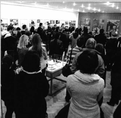
Publicul prezent la vernisaj