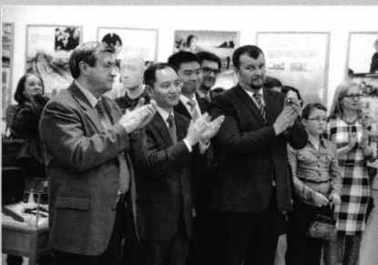
Oficialități participante la vernisaj

Authorities participating at the opening