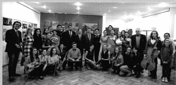
Poză de grup

Authorities participating at the opening