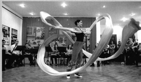
Dans cu panglica