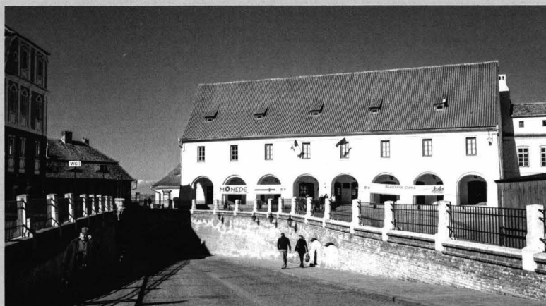
Casa Artelor, Piața Mică, Nr. 21, locația expoziției

http://www.binder.muzeulastra.ro/expozitii/50-expozitii-temporare.html