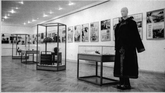
Aspect din cadrul expoziției