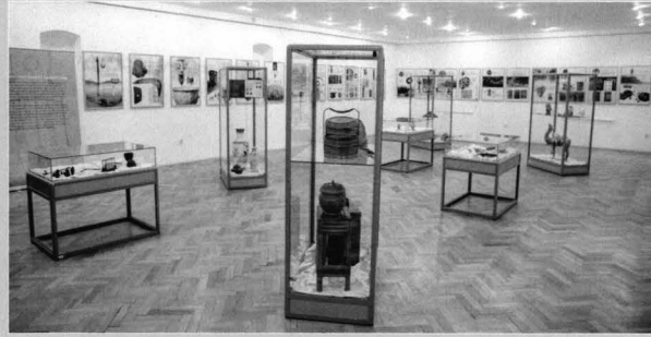
Artefacte din colecțiile Muzeului de Etnografie Universală „Franz Binder” din expoziție

Artifacts from the “Franz Binder” World Ethnography Museum's exhibition