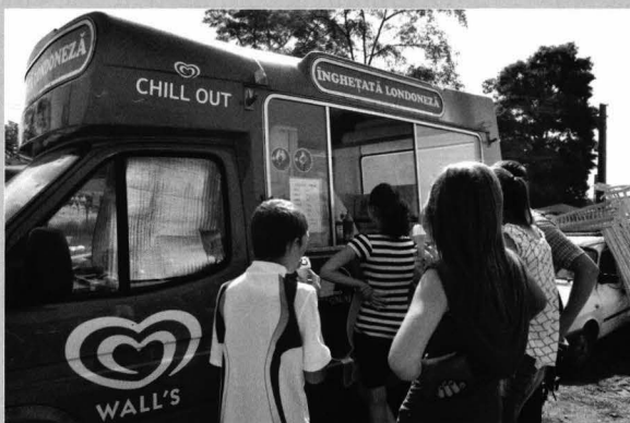
Figura 8 „Înghețată londoneză” la târgul de cai de la Sânpetru de Câmpie

”London icecream” at the horse fair in Sânpetru de Câmpie