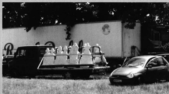
Figura 9 Monumente funerare de vânzare la târgul de fete de la Gurghiu

”London icecream” at the horse fair in Sânpetru de Câmpie