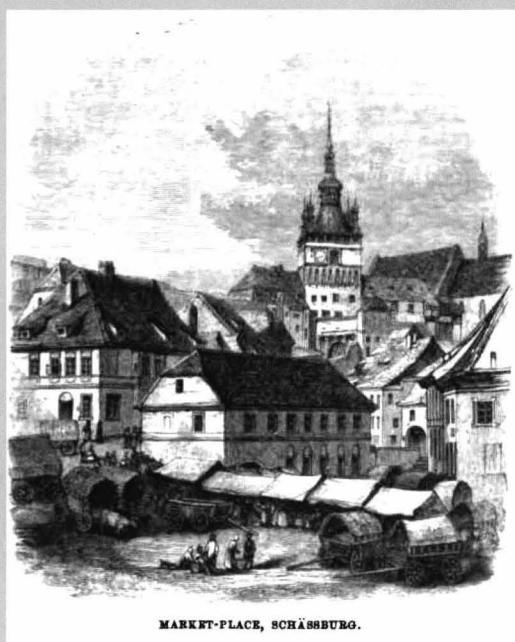
Figura 1 Piața din Sighișoara, sec. XIX, desen Charles Boner

Dincolo de imaginea pitorească a târgurilor de altădată, dar și de astăzi, cu mulțimea de mărfuri diverse, cu tarabe, căruțe cu coviltir, ceea ce impresionează cel mai mult în acest cadru sunt oamenii, ei fiind promotorii și colportorii unei anumite culturi. La mijlocul secolului al XIX-lea, un călător străin prin Transilvania, Charles Boner, a nimerit într-o zi de târg în Sighișoara și a surprins în desen și text, atât imaginea de ansamblu a pieței centrale, căruțele cu coviltir și tarabele, boii care stăteau fără juguri în fața carelor cu porumb și legume, dar a fost impresionat mai ales de oamenii veniți la târg. „În fața lor stăteau valahele înfodelite și valahii cu părul lung” 1 , iar mai încolo spune că a gustat un delicios vin de Batzko Madarasch (posibil Mădăraș).