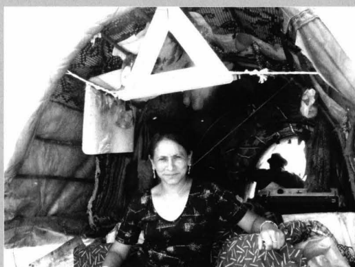
Figura 10 Căruță cu coviltir adaptată la normele de circulație și cu materiale specifice secolului XXI

Funeral Monuments in the ”girls fair” from Gurghiu