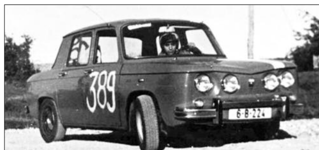
Mașina debutului. Prin anii '70, primele curse se făceau, de regulă, cu mașina familiei.