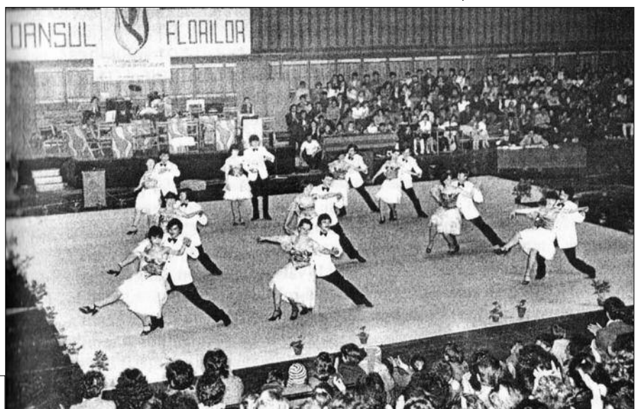
Dansul florilor, prima ediție, 1984

Cel mai important este faptul că, organizat de Centrul Cultural, Primăria Pitești, Consiliul Local și Asociația „Total Dance”, „Dansul Florilor” merge mai departe. A mers chiar la vreme de pandemie, cu ediții online! „Dansul Florilor” de la Pitești e pe mâini bune!