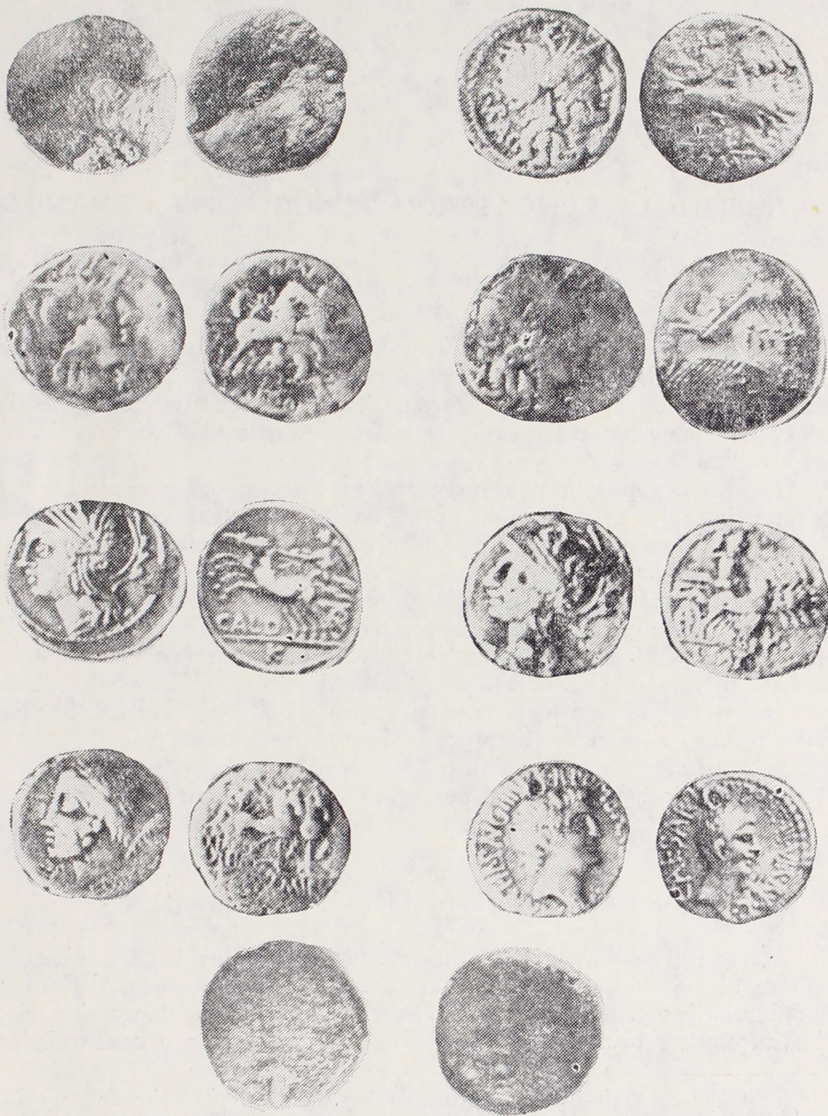
Pl. IV, 31, Monedă geto-dacică. 32—38, Denari romani republicani, 39, Monedă grecească nedeterminată.